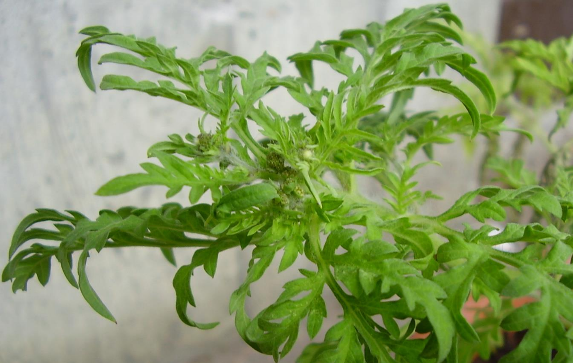
Traubenkraut - Ambrósia artemisiifólia