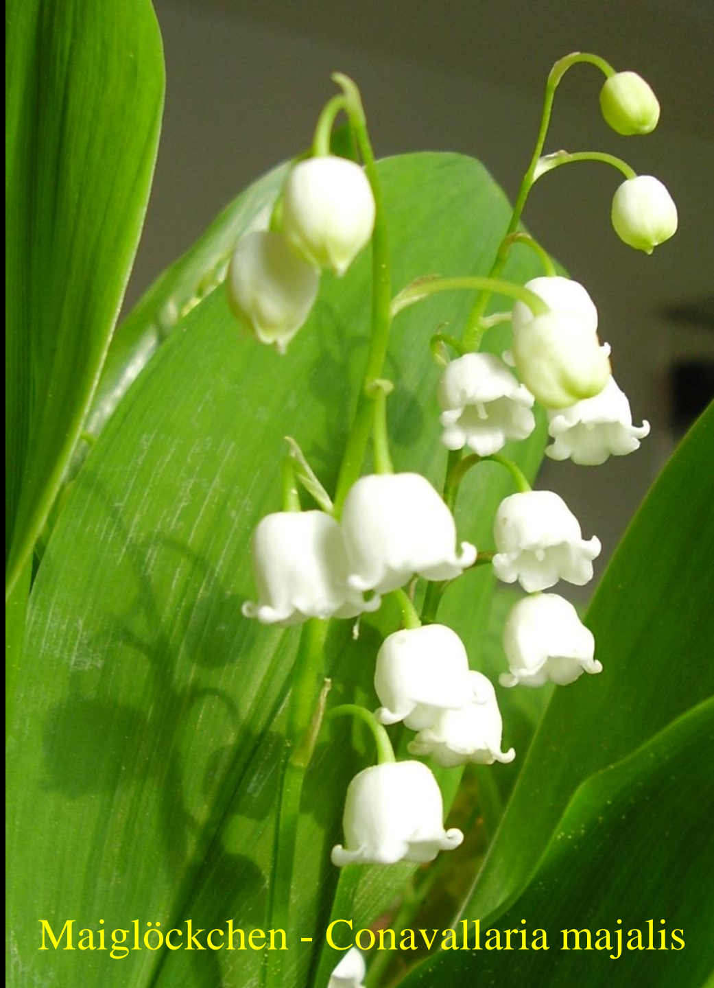
Maiglöckchen - Conavallaria majalis