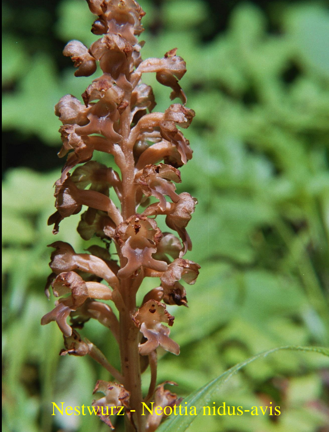
Nestwurz - Neottia nidus-avis