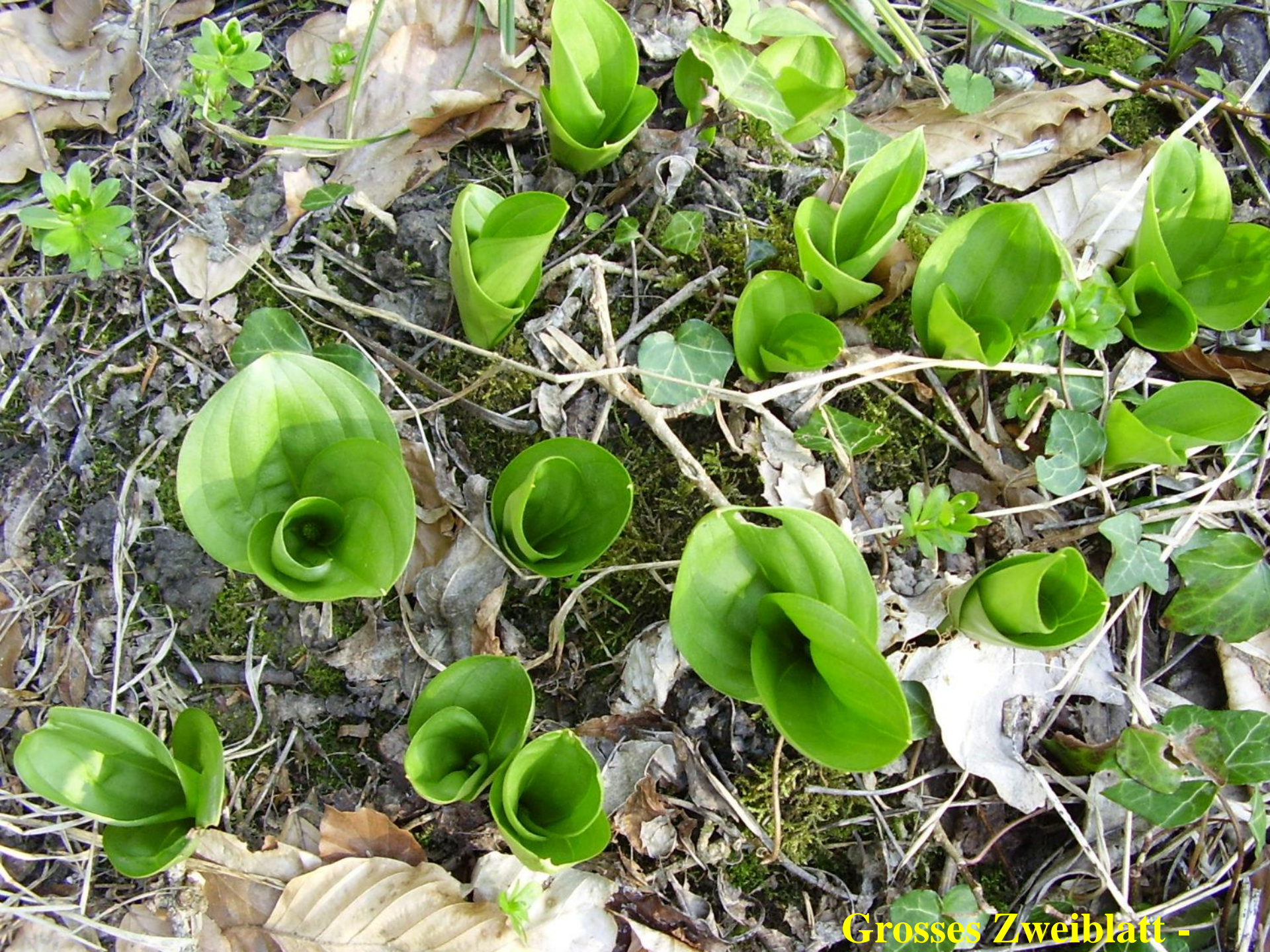
Grosses Zweiblatt -