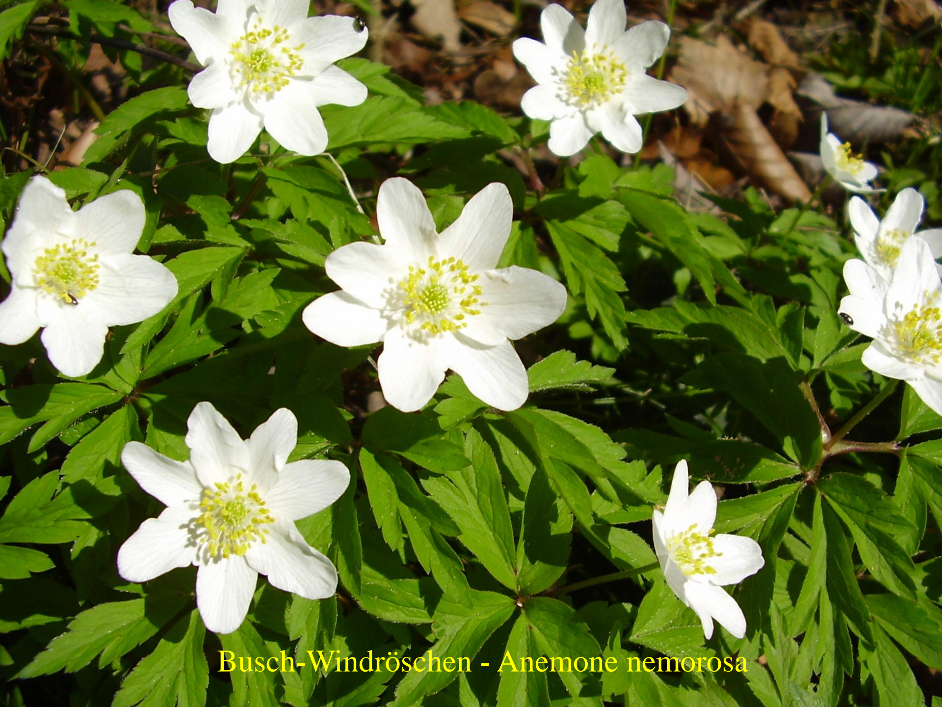
Busch-Windröschen - Anemone nemorosa