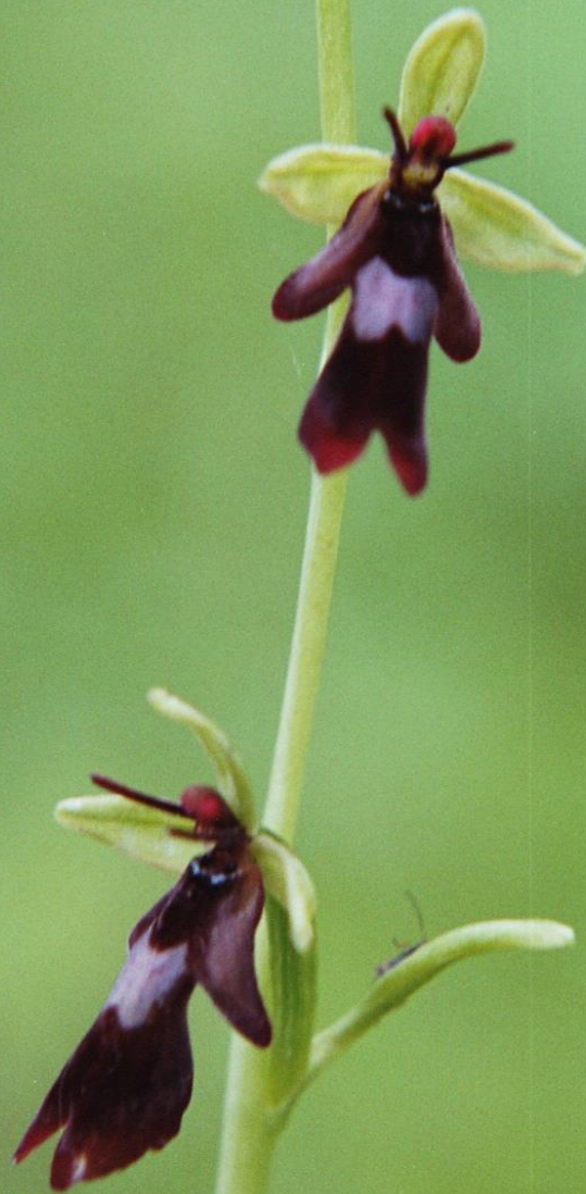
Fliegenragwurz - Ophrys insectifera