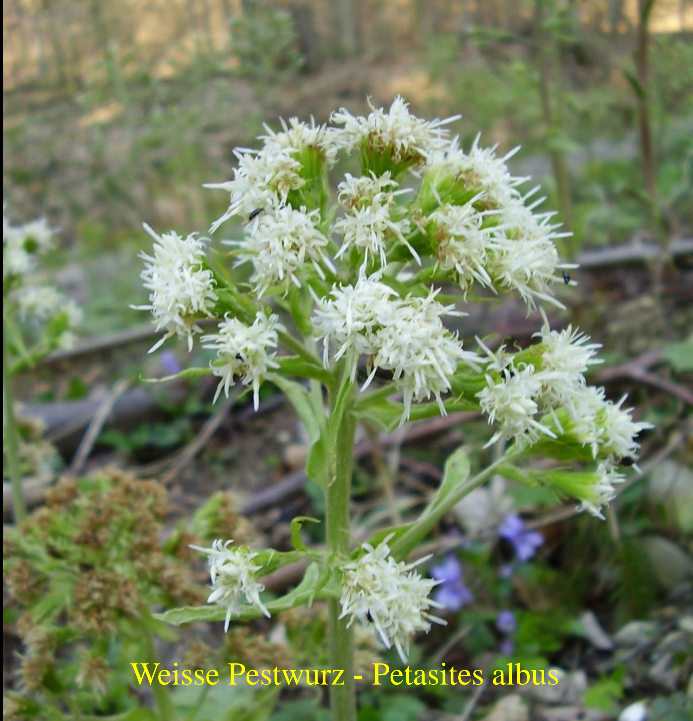
Weisse Pestwurz - Petasites albus