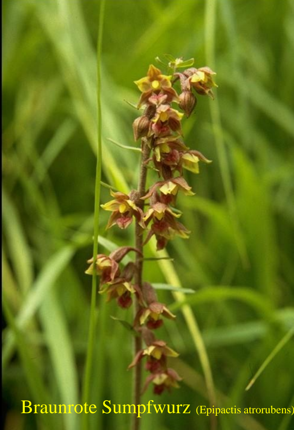
Braunrote Sumpfwurz ( Epipactis atrorubens )