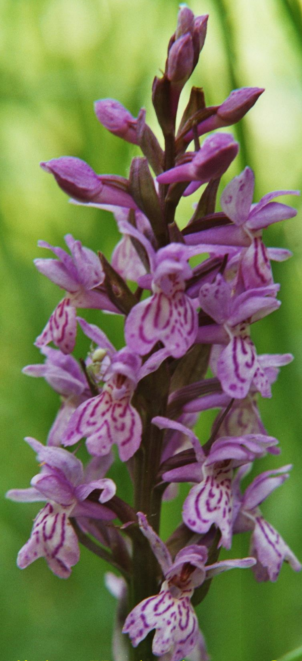
Männliches Knabenkraut - Orchis mascula