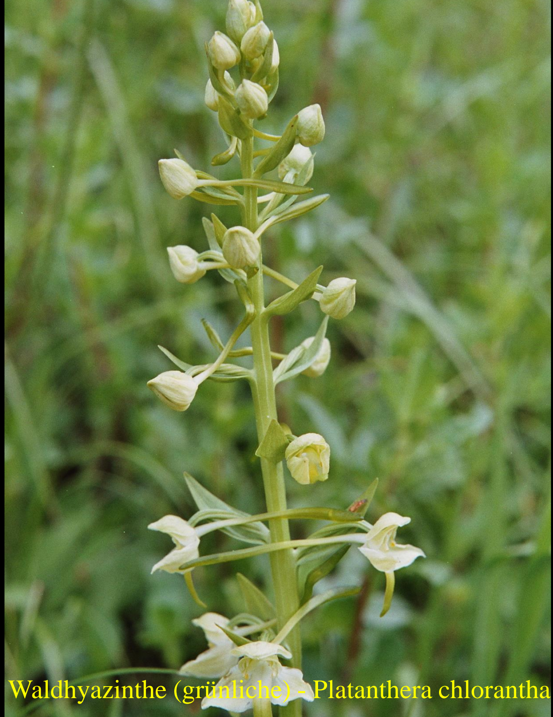
Waldhyazinthe (grünliche) - Platanthera chlorantha