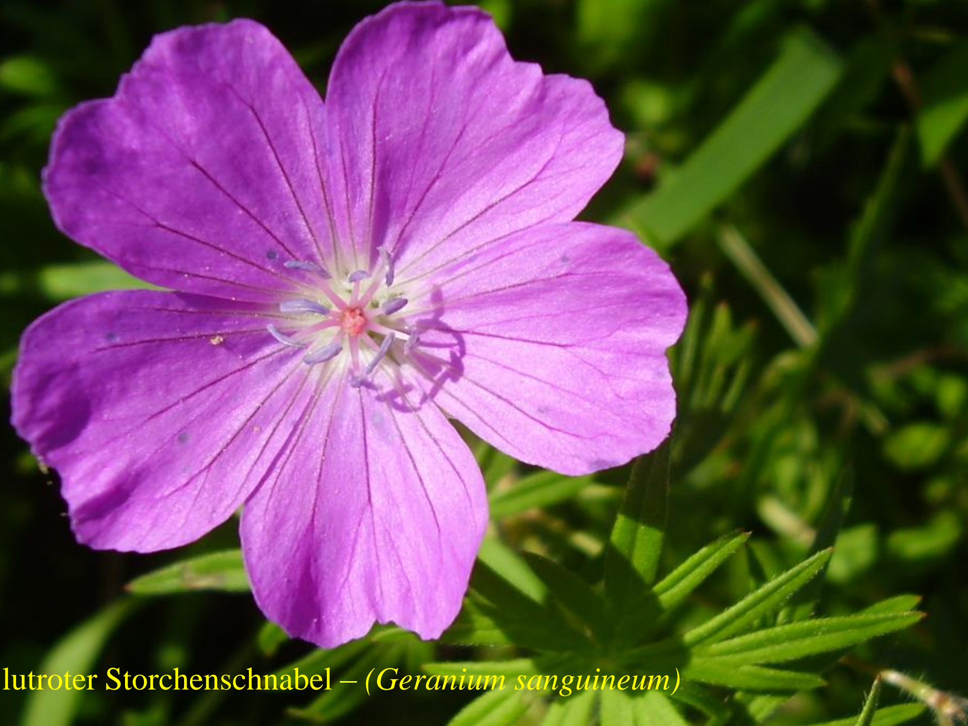
Blutroter Storchschnabel – ( Geranium sanguineum )