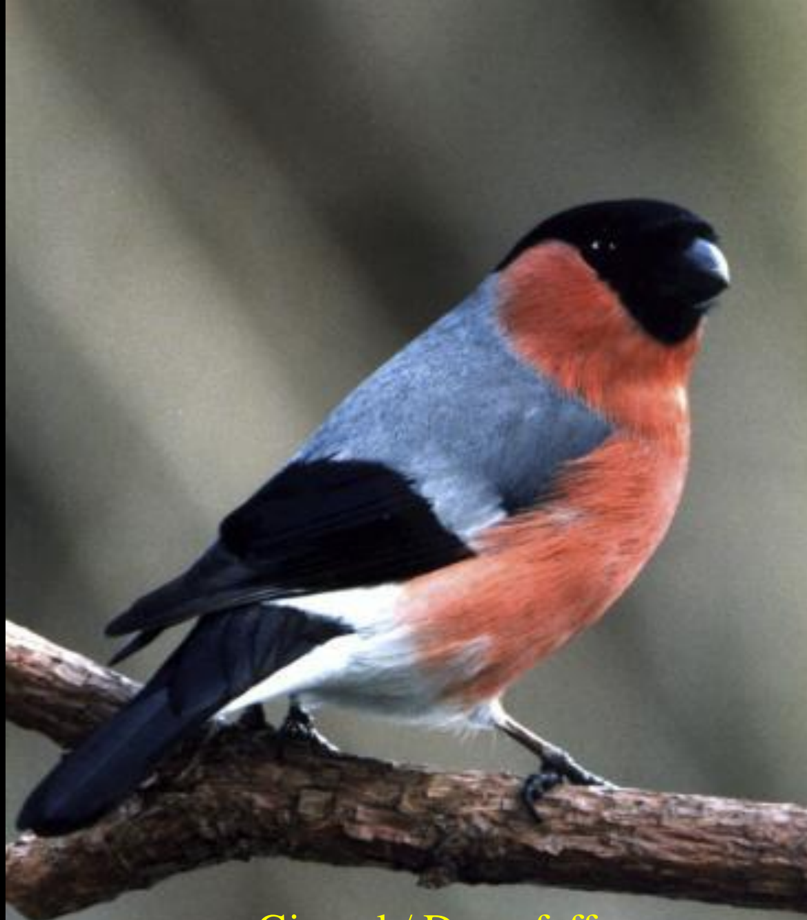
Gimpel / Dompfaff