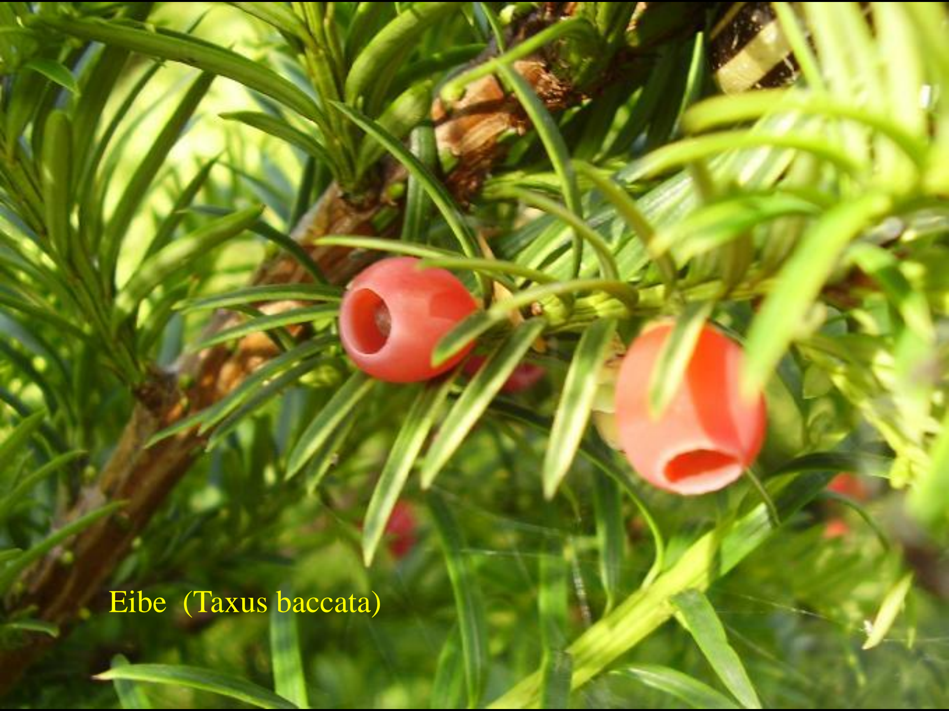
Eibe ( Taxus baccata )