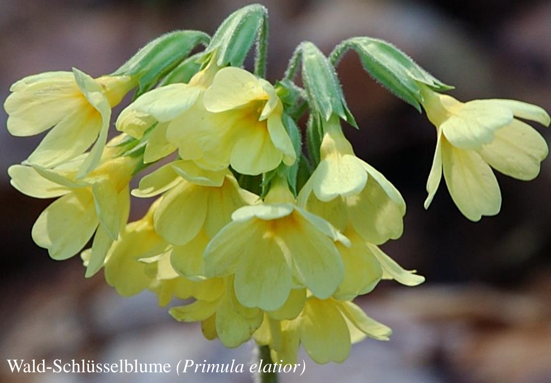
Wald-Schlüsselblume ( Primula elatior )