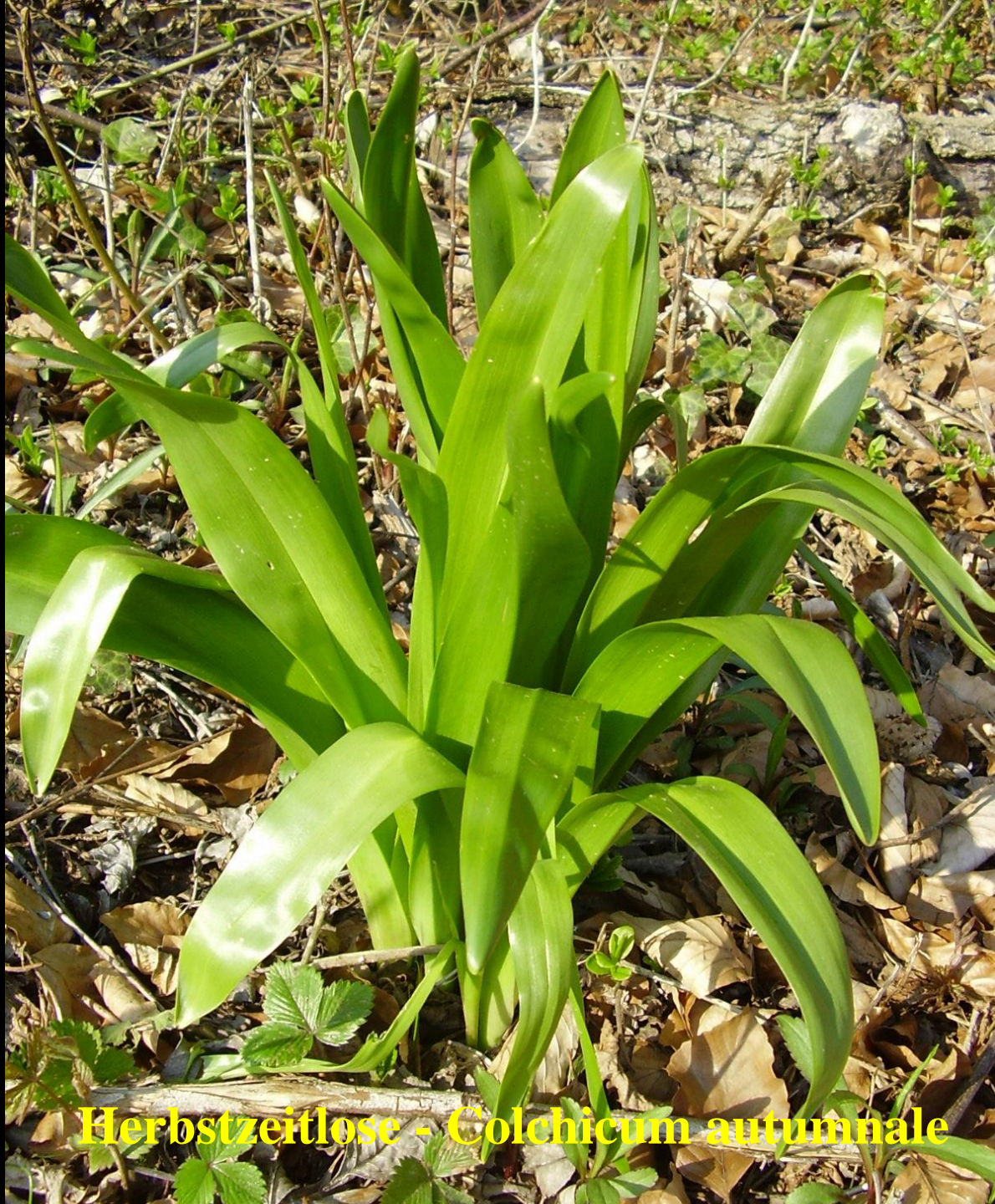
Herbstzeitlose - Colchicum autumnale