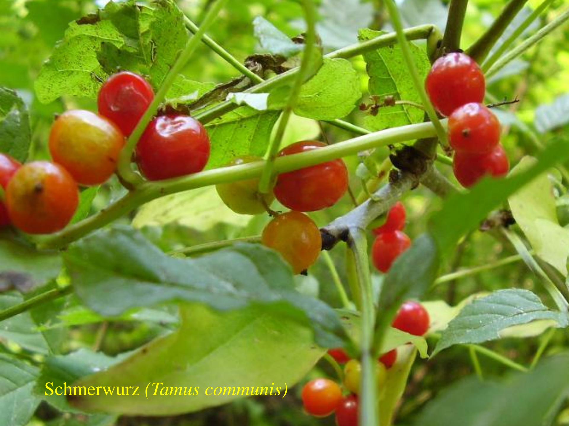
Schmerwurz ( Tamus communis )