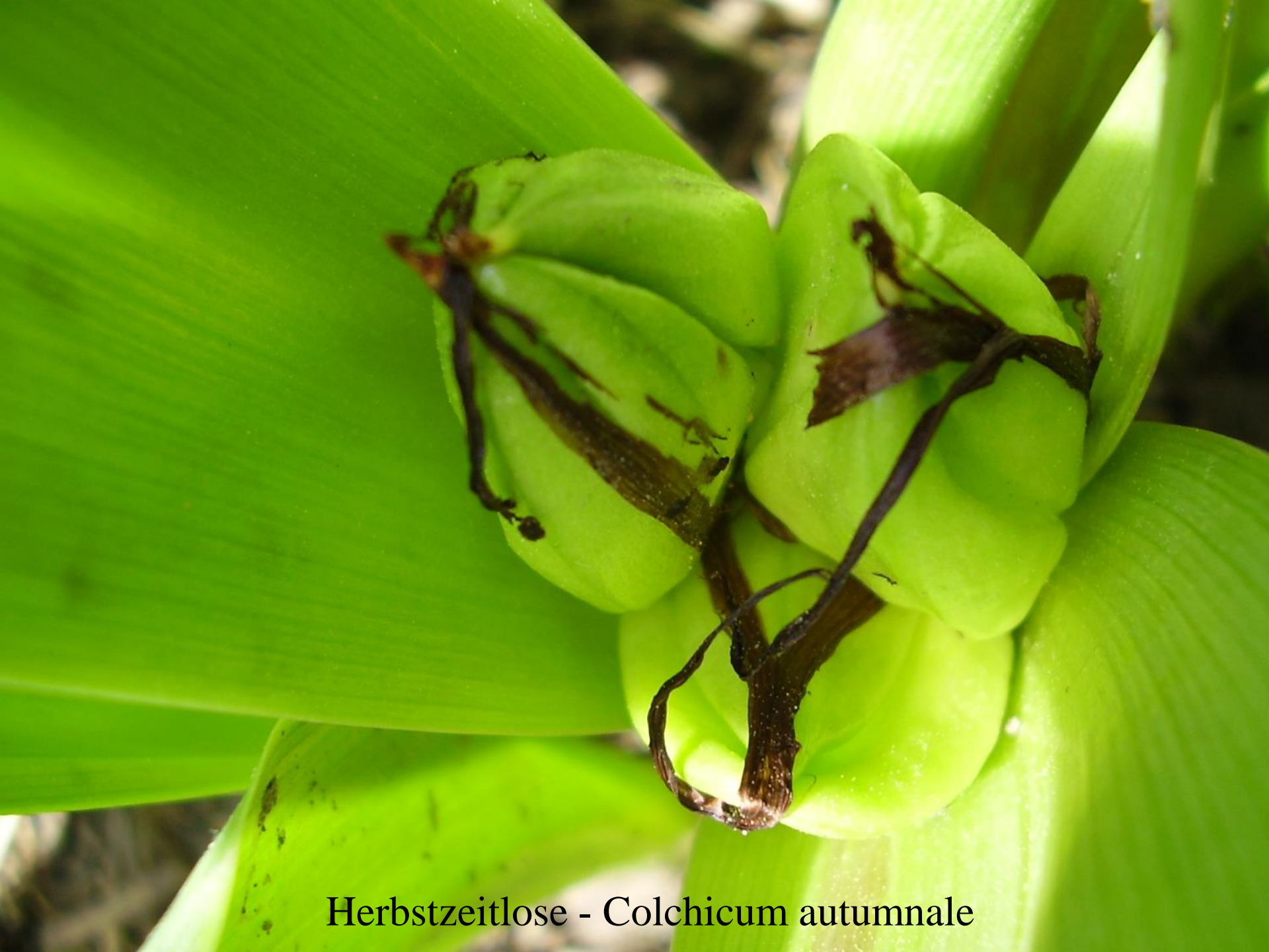
Herbstzeitlose - Colchicum autumnale