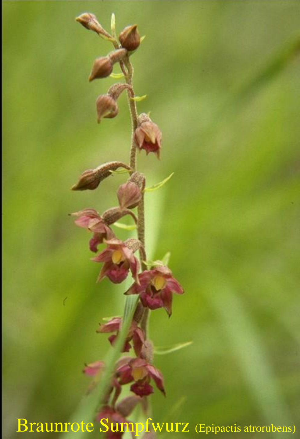
Braunrote Sumpfwurz ( Epipactis atrorubens )