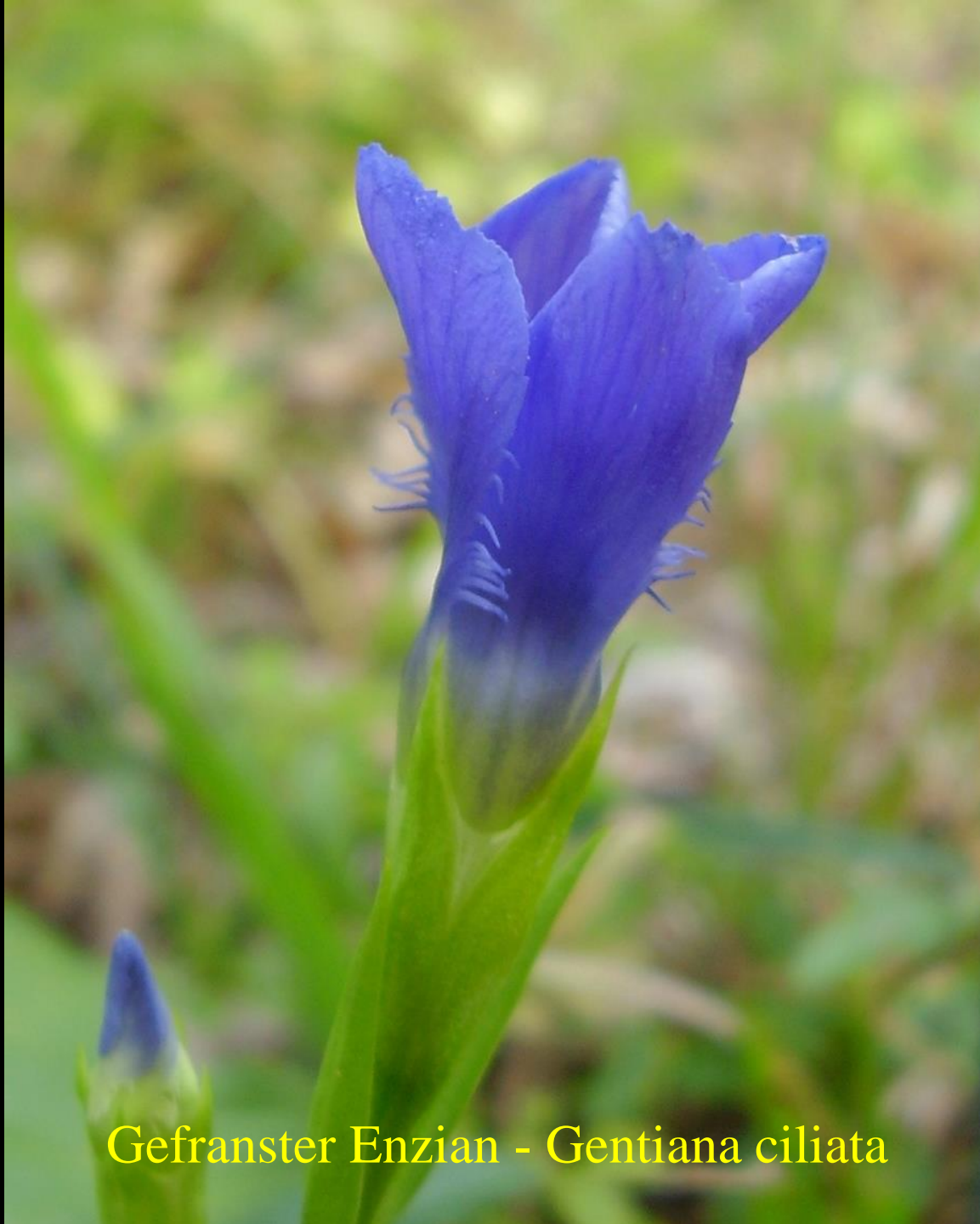
Gefranster Enzian - Gentiana ciliata