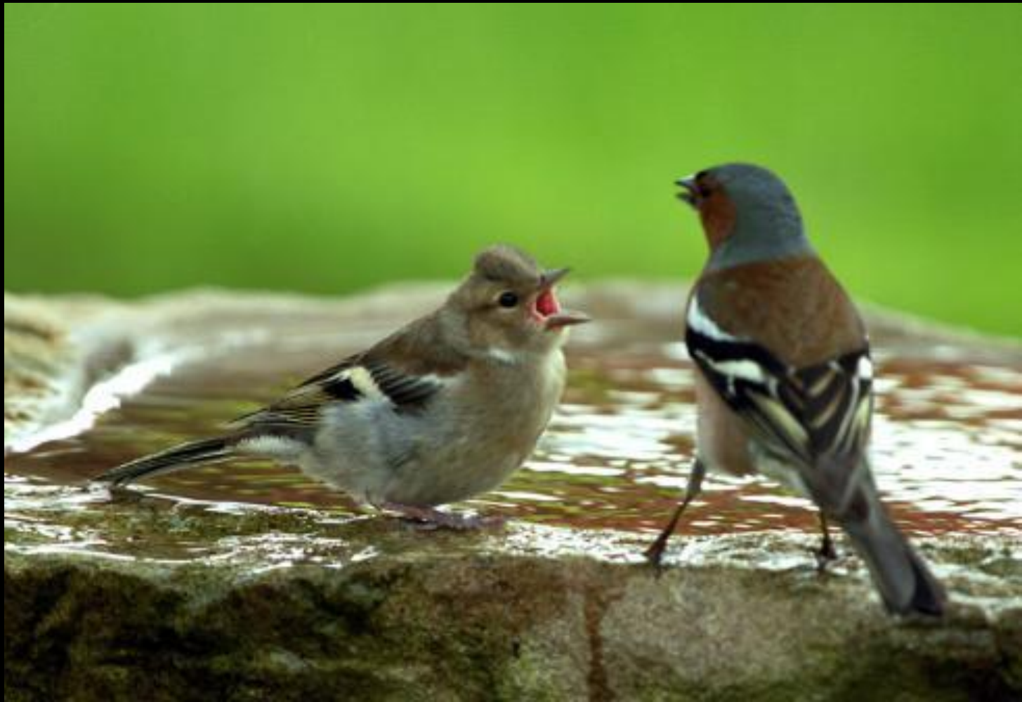
Buchfink (bettelnder Jungvogel)