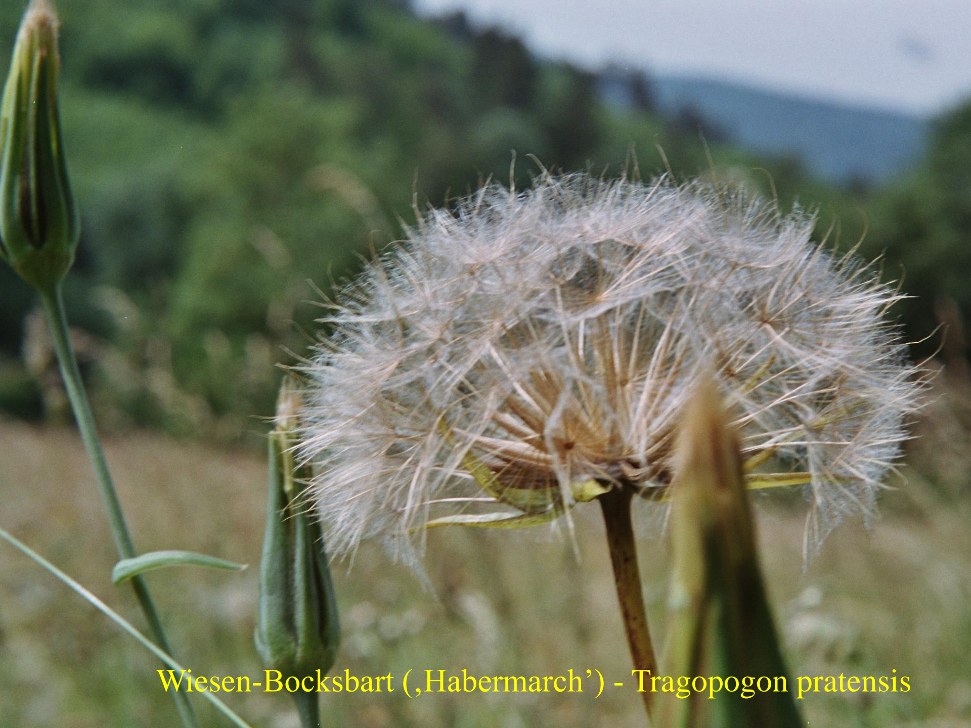
Wiesen-Bocksbart (,Habermarch') - Tragopogon pratensis