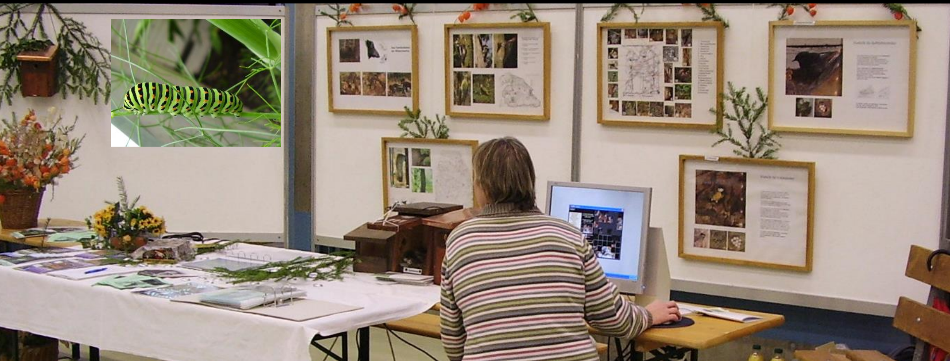
Infostand an Zürcher Unterländer Kleintierverbandsausstellung – Sporthalle Freienstein