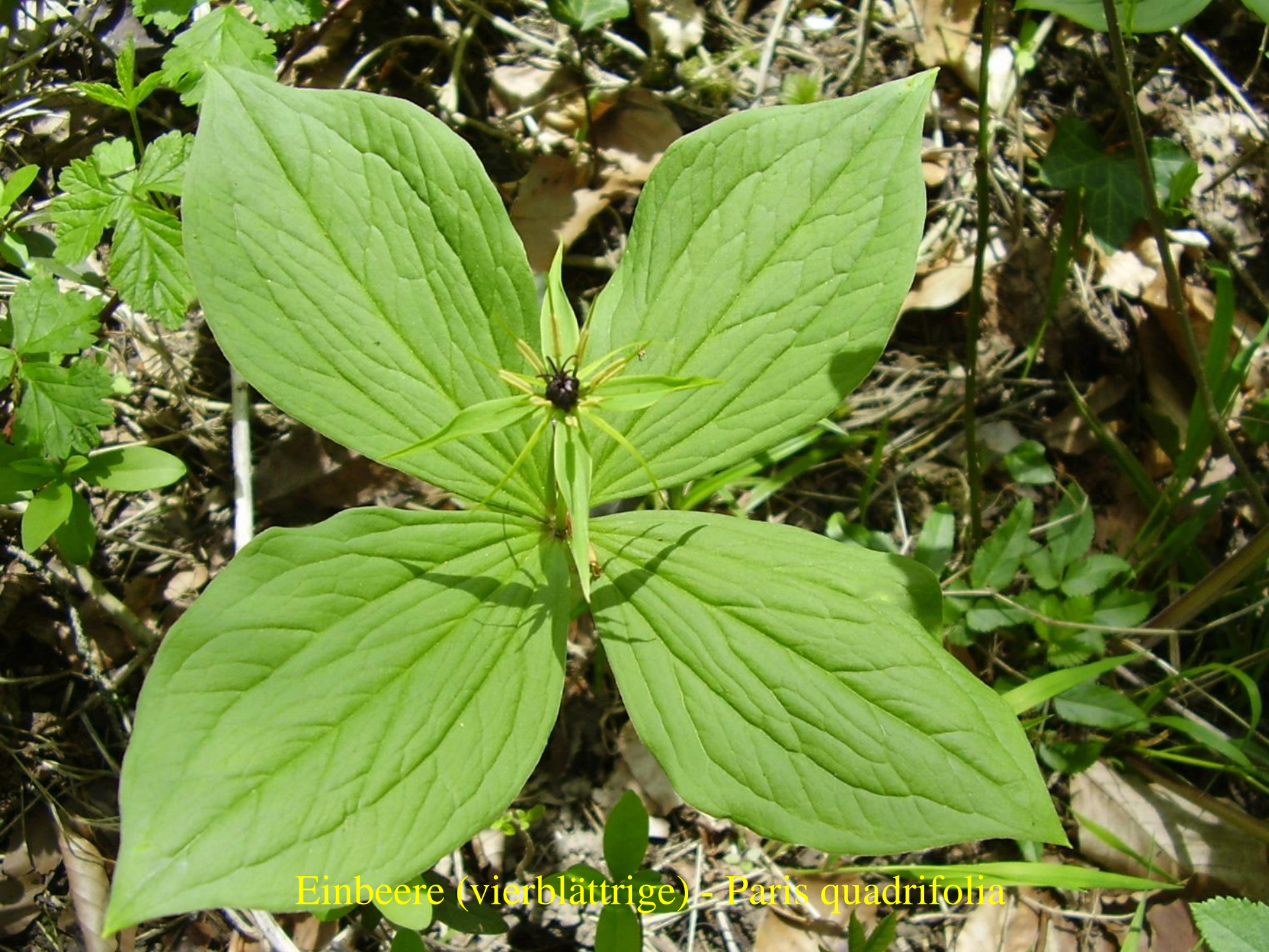
Einbeere (vierblättrige) - Paris quadrifolia