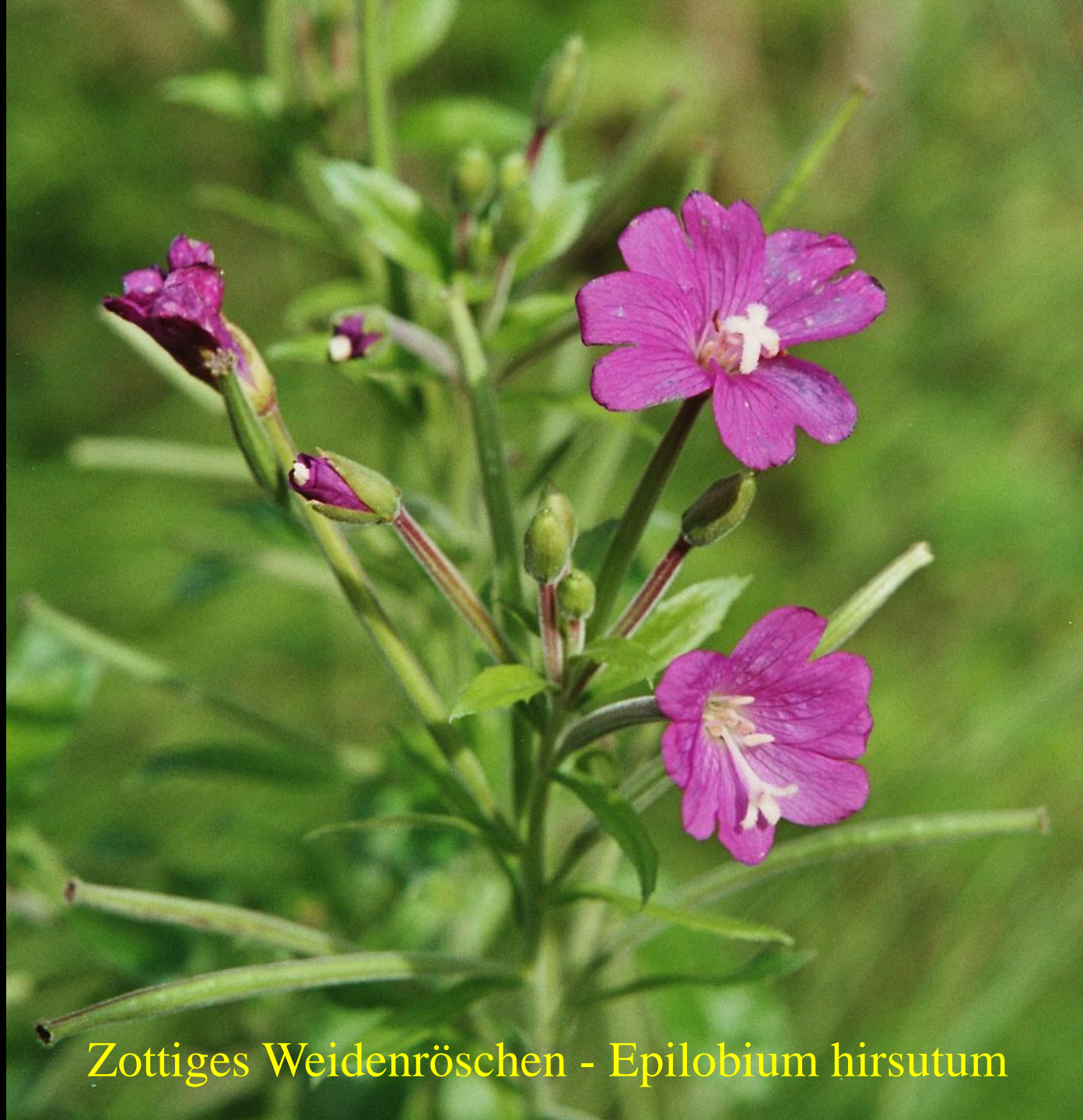
Zottiges Weidenröschen - Epilobium hirsutum