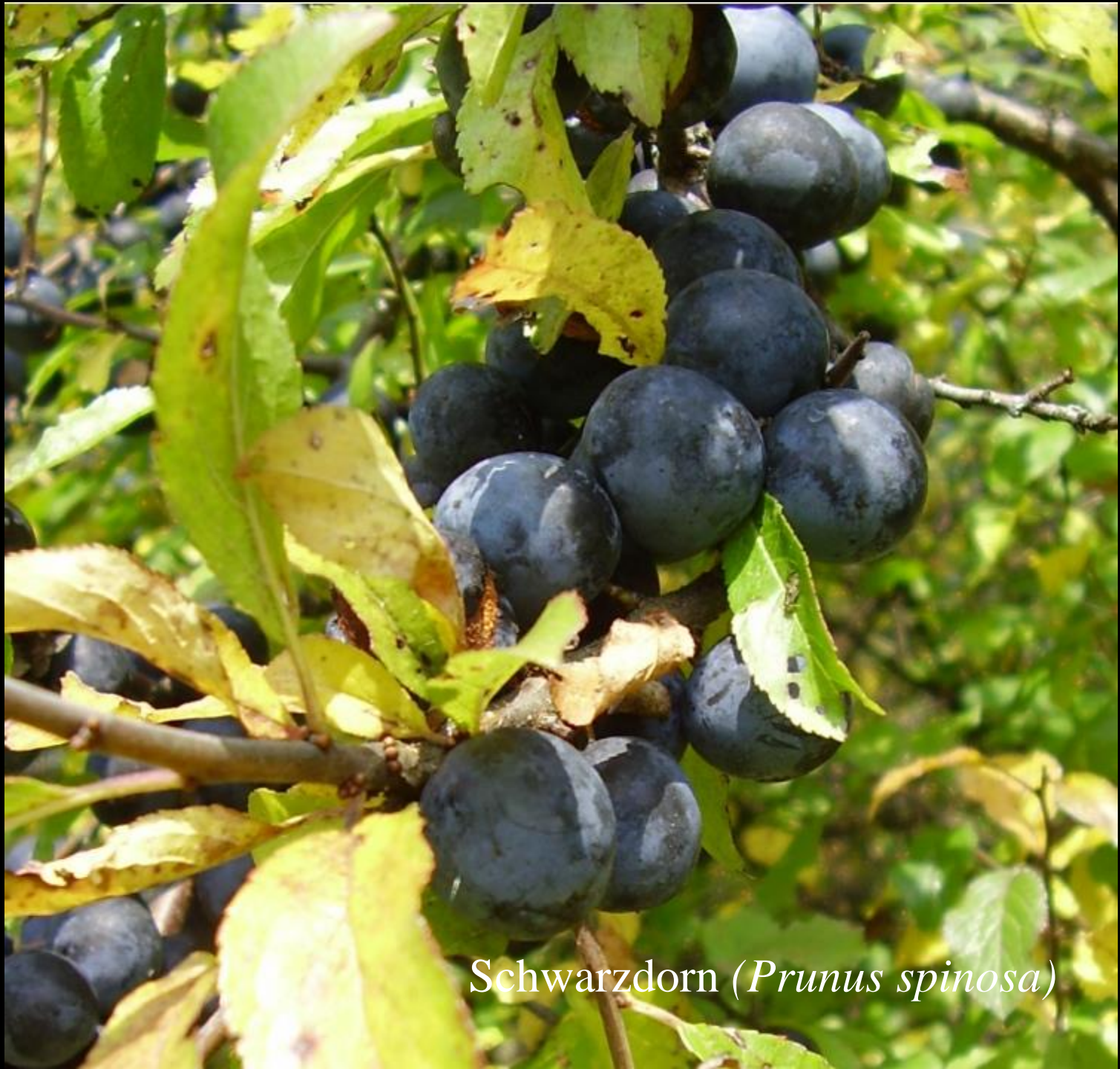
Schwarzdorn ( Prunus spinosa )