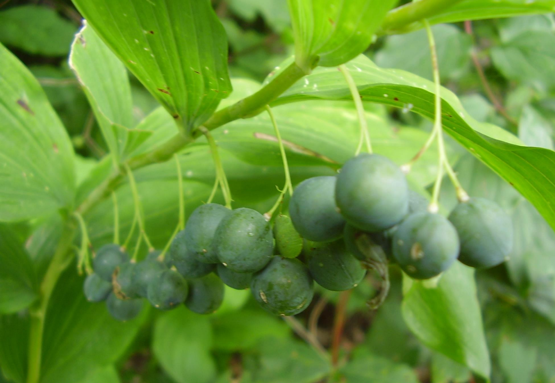
Salomonssiegel (vielblütiges) - Polygonatum multiflorum