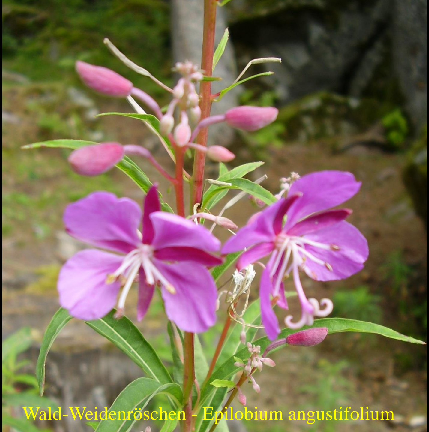
Wald-Weidenröschen - Epilobium angustifolium