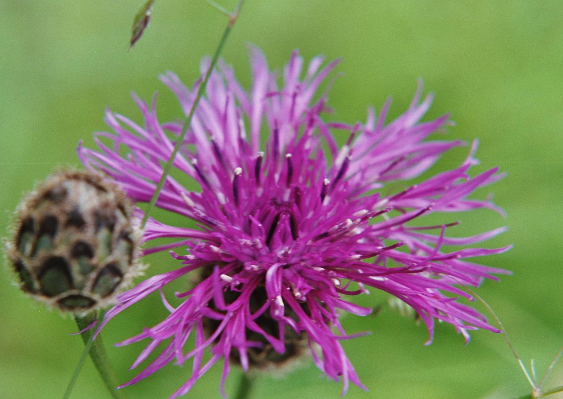
Skabiosen-Flockenblume ( Centaurea scabiosa )