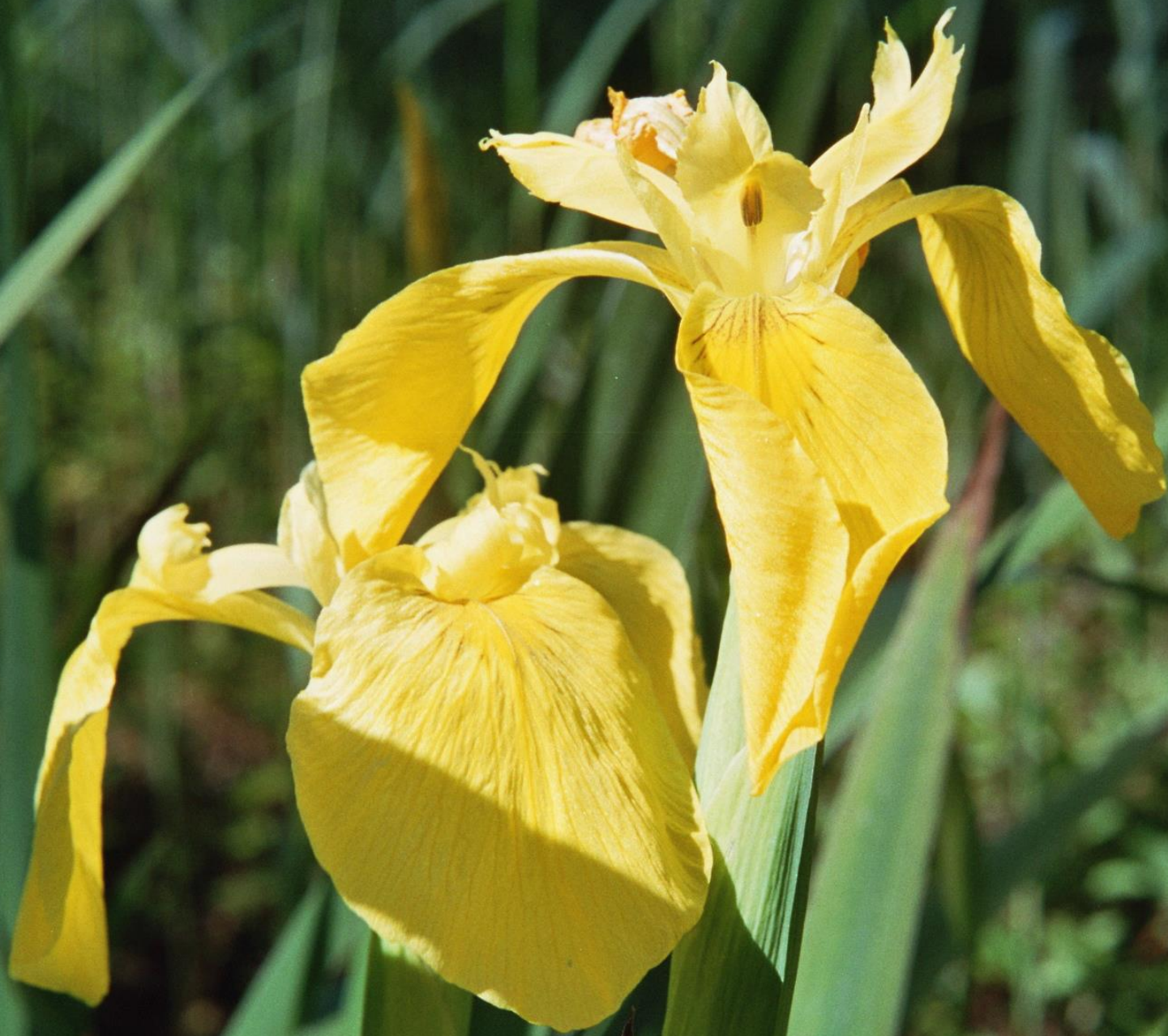
Gelbe Schwertlilie - Iris pseudacorus