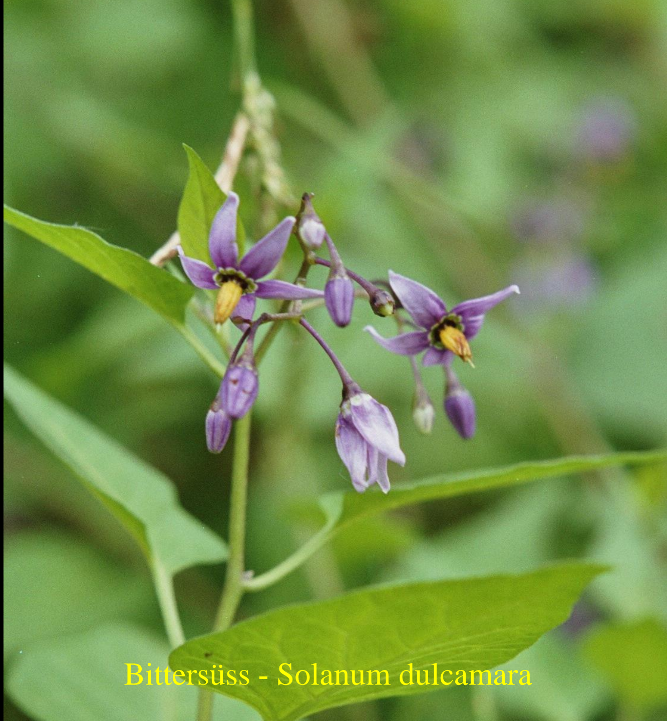
Bittersüss - Solanum dulcamara