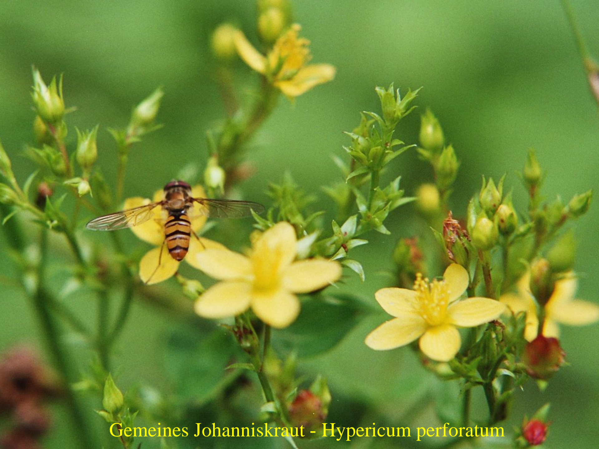
Gemeines Johanniskraut - Hypericum perforatum