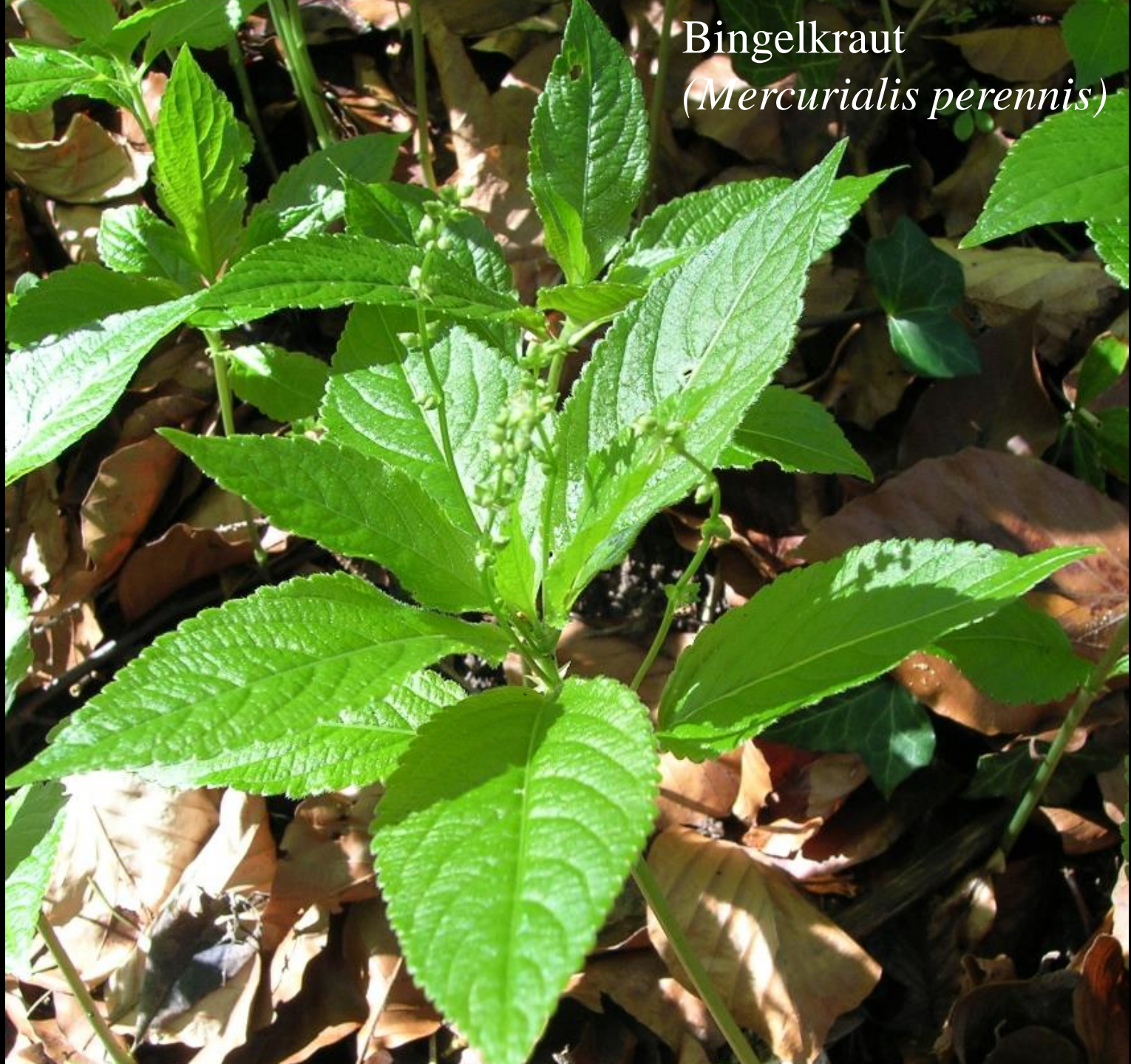
Bingelkraut ( Mercurialis perennis )