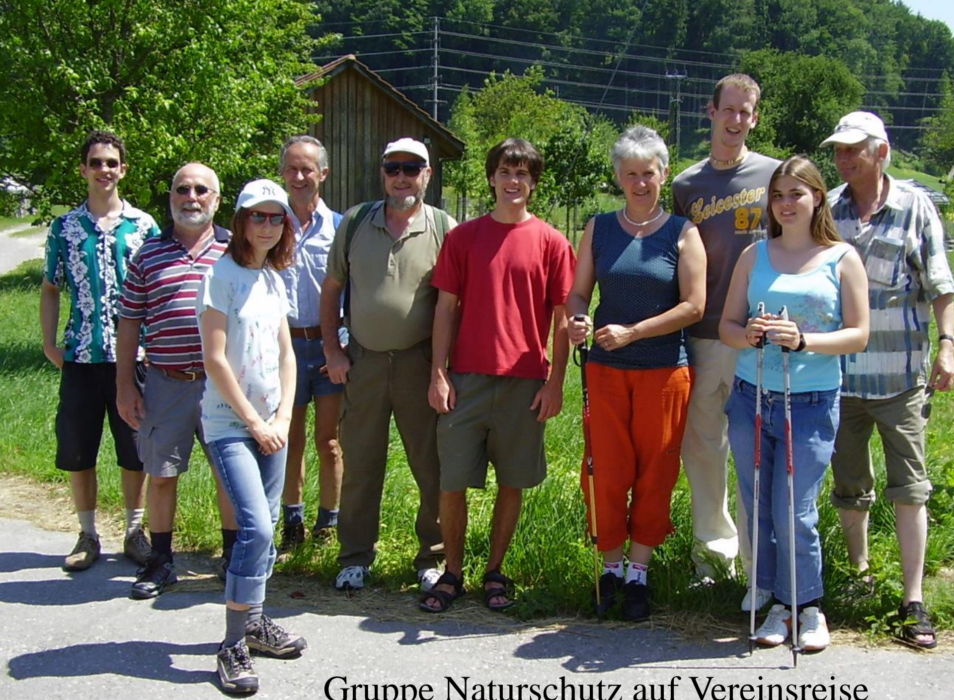
Gruppe Naturschutz auf Vereinsreise