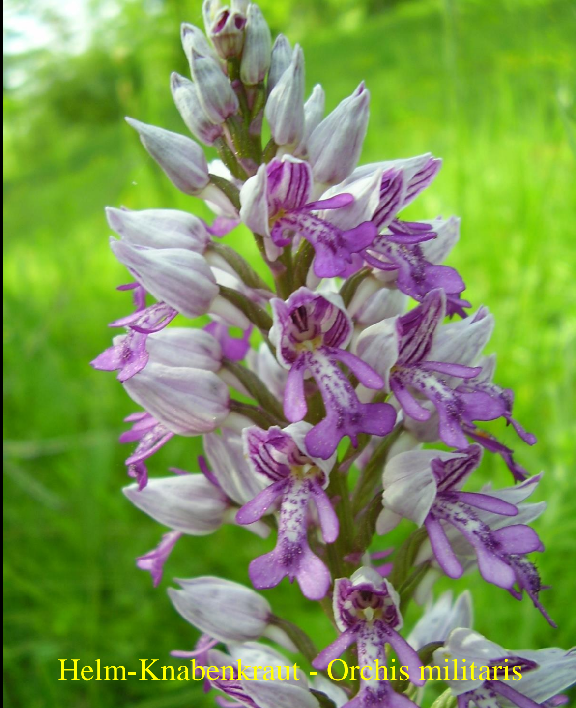
Helm-Knabenkraut - Orchis militaris