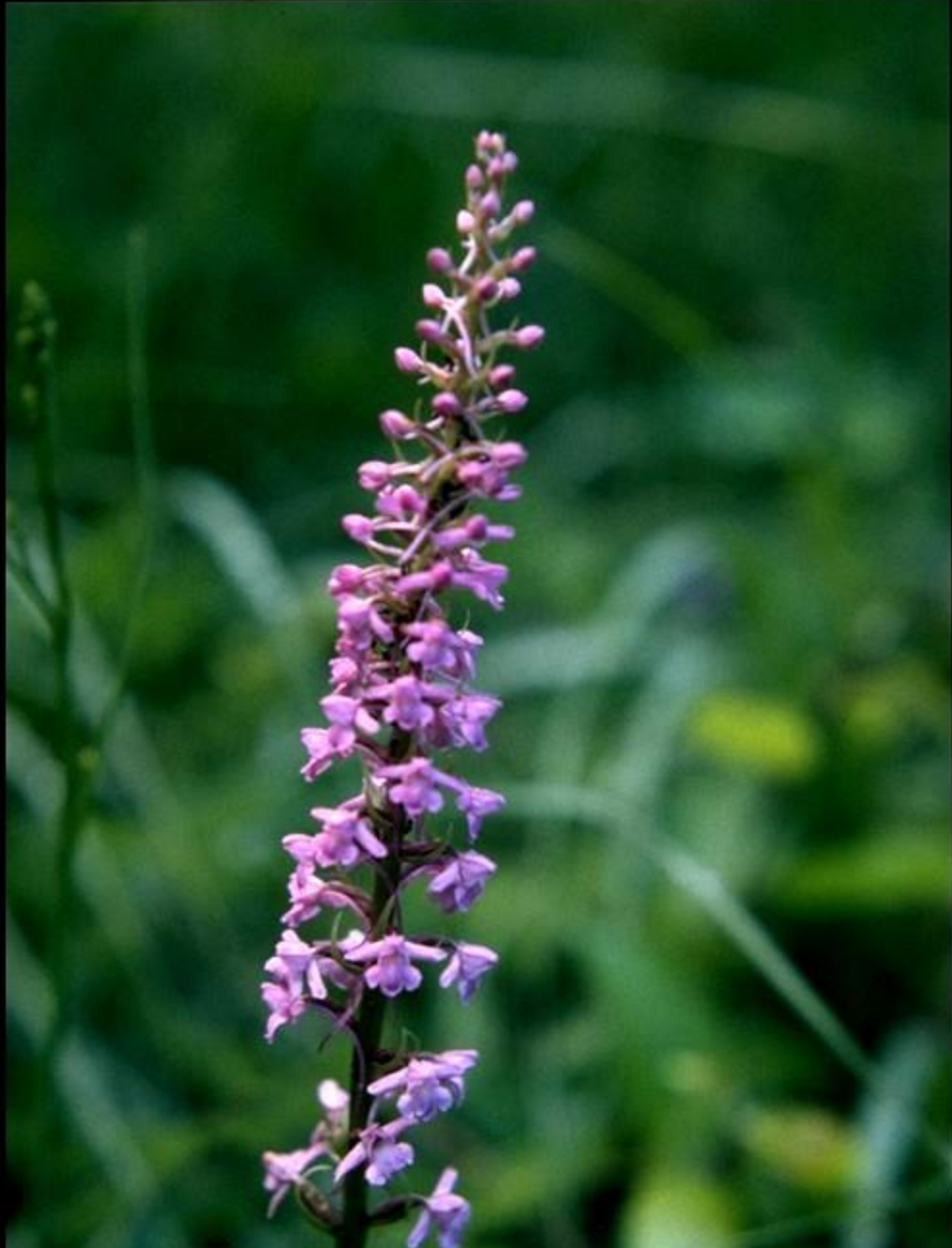
Langspornige Handwurz ( Gymnadenia conopsea )