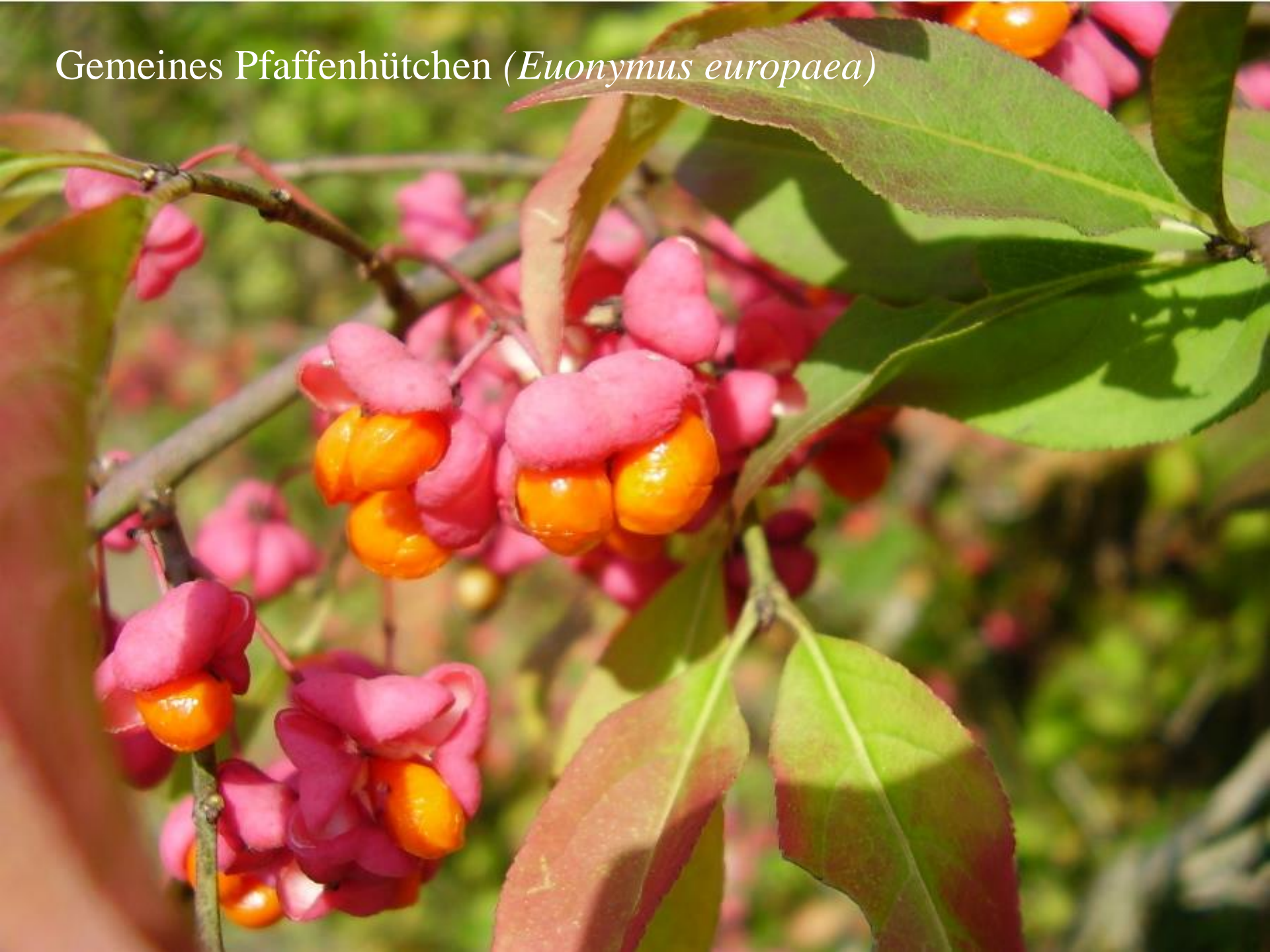
Gemeines Pfaffenhütchen ( Euonymus europaea )