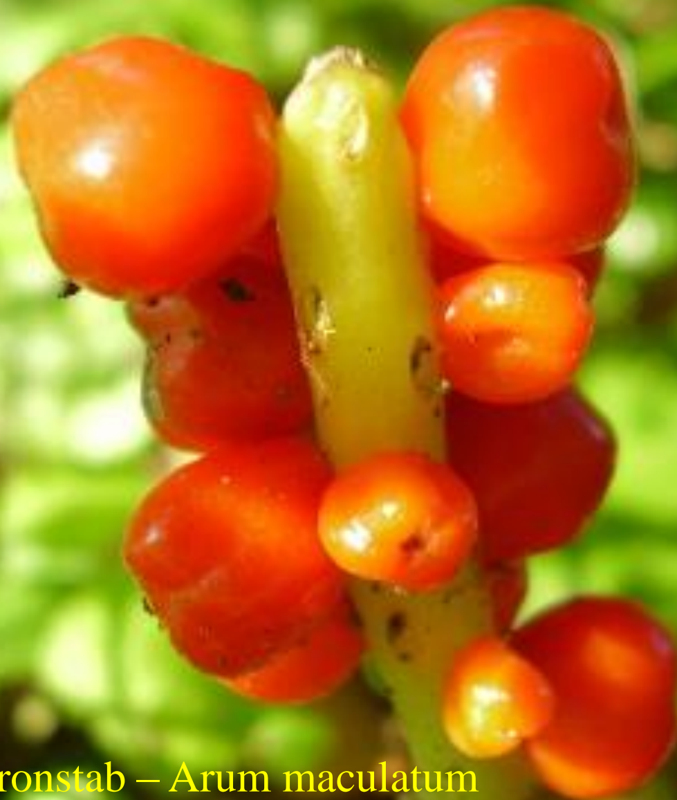
Aronstab – Arum maculatum