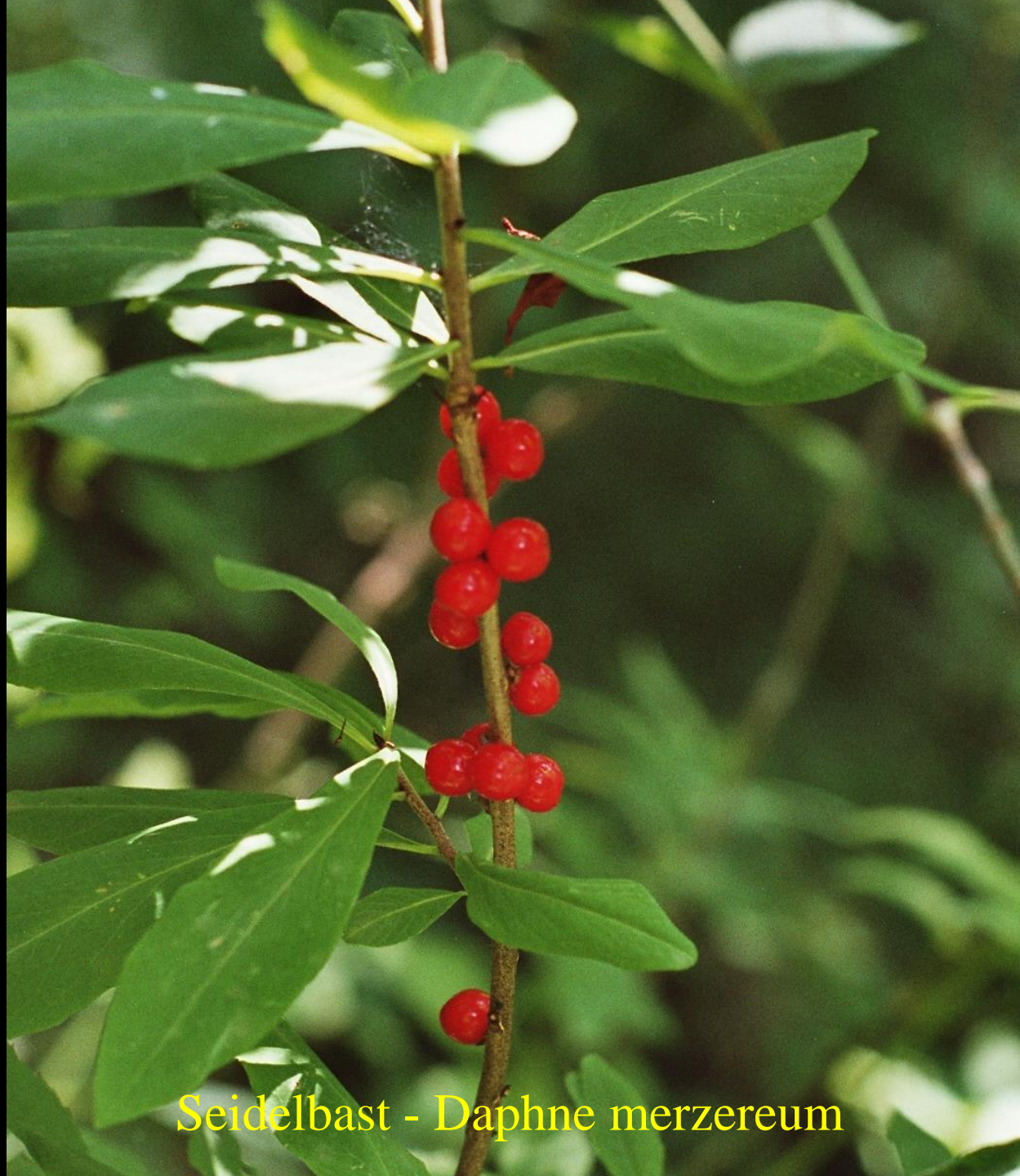
Seidelbast - Daphne mezereum