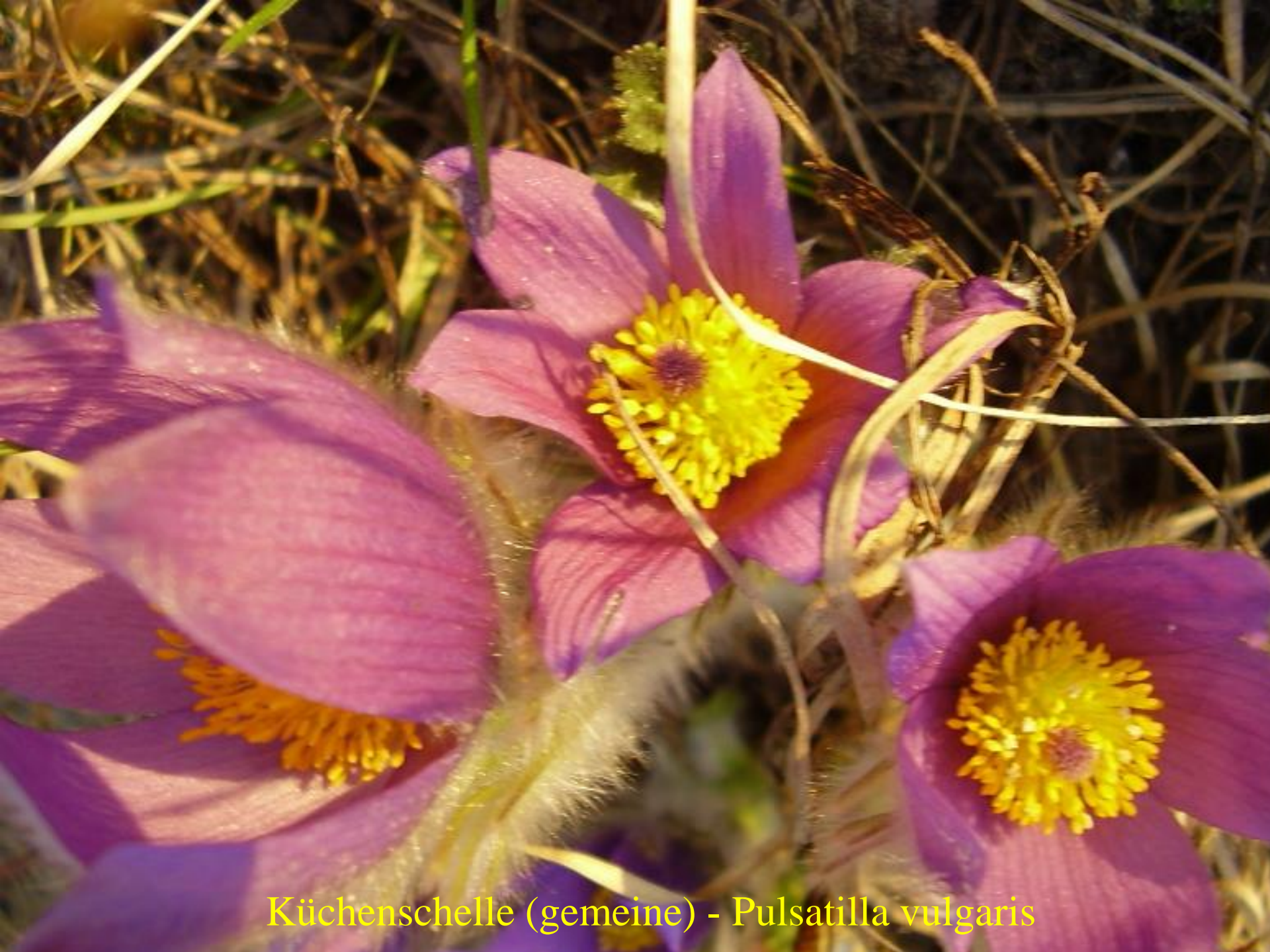
Küchenschelle (gemeine) - Pulsatilla vulgaris