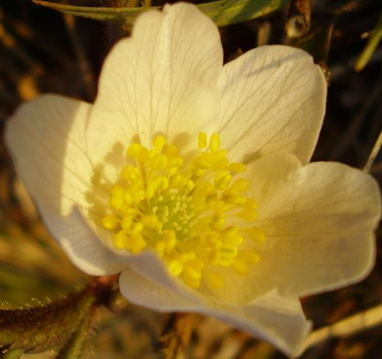
Busch-Windröschen - Anemone nemorosa