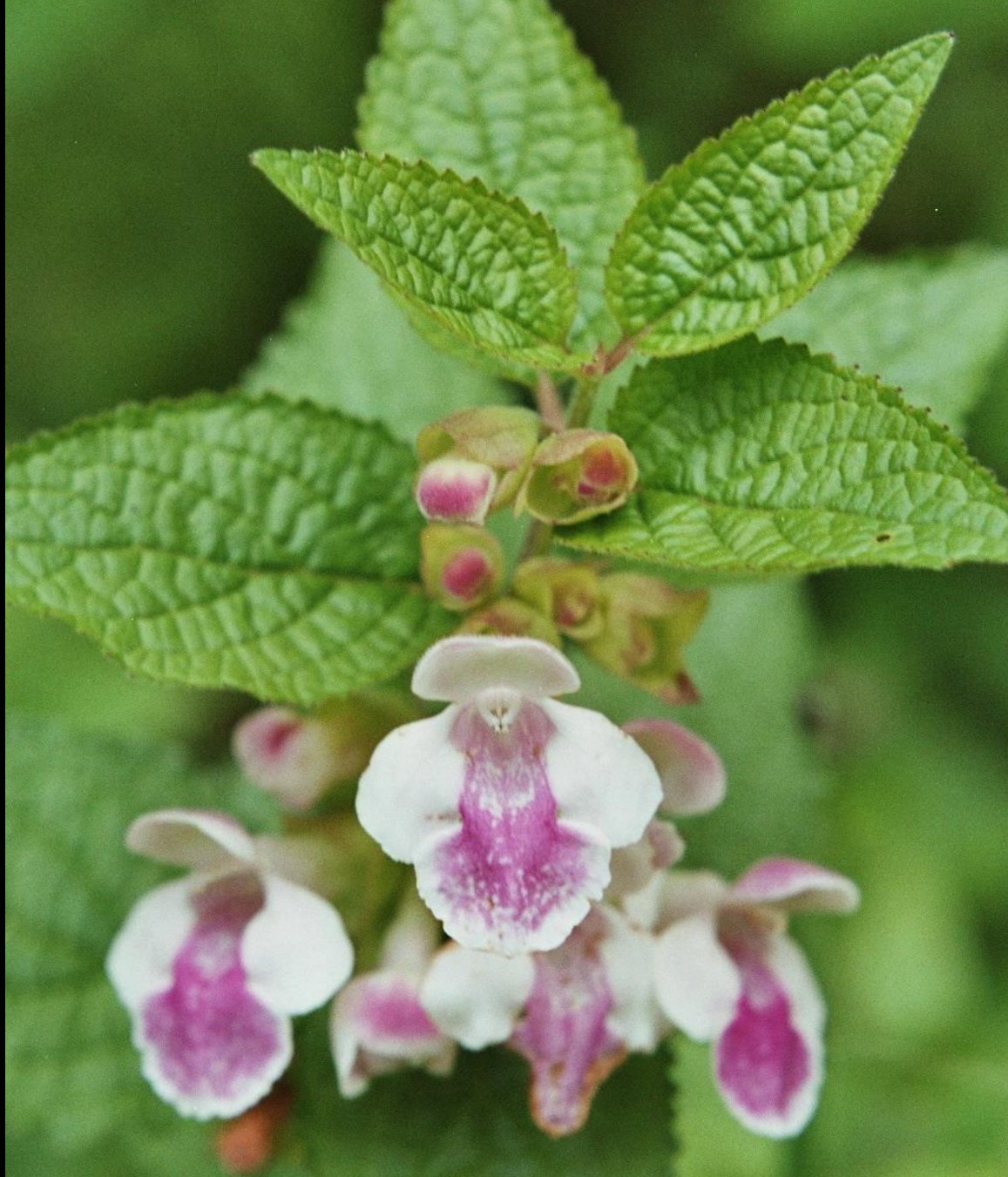
Immenblatt - Melittis melissophyllum