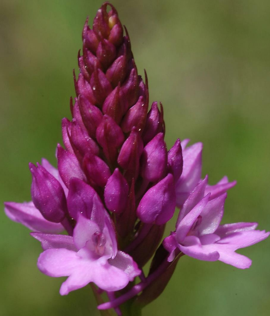
Spitzorchis - Anacamptis pyramidalis