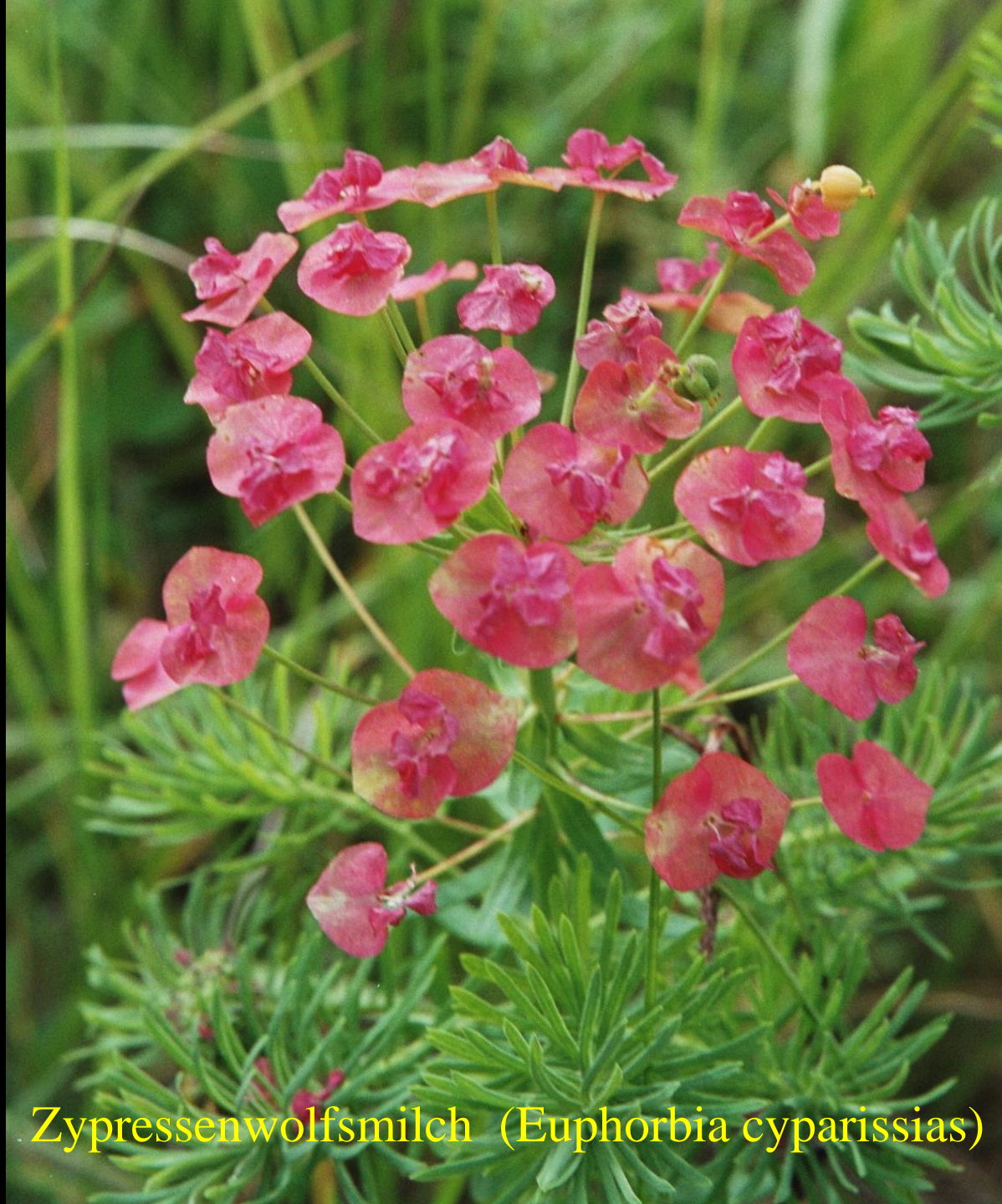
Zypressenwolfsmilch ( Euphorbia cyparissias )