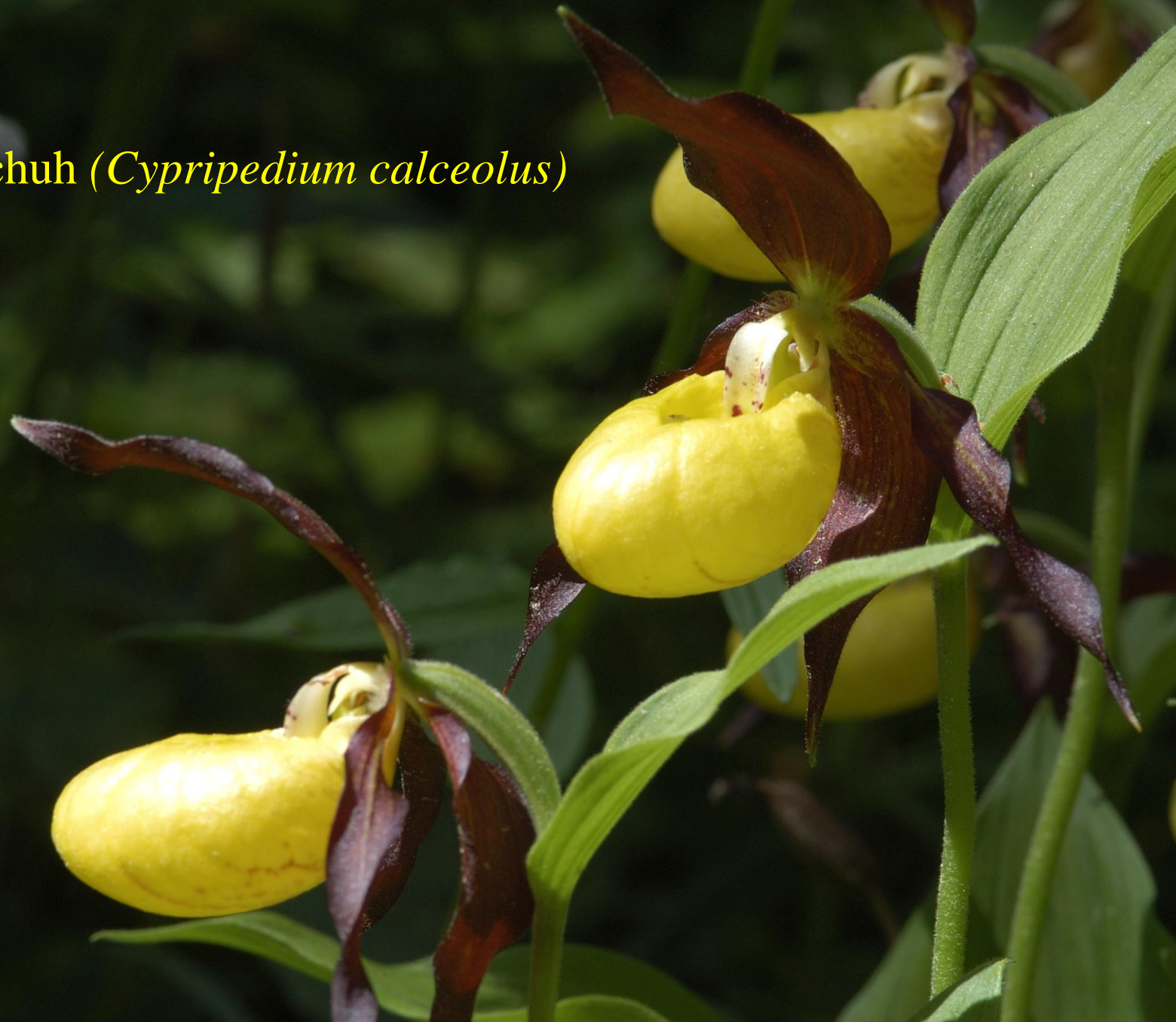
Frauenschuh ( Cypripedium calceolus )