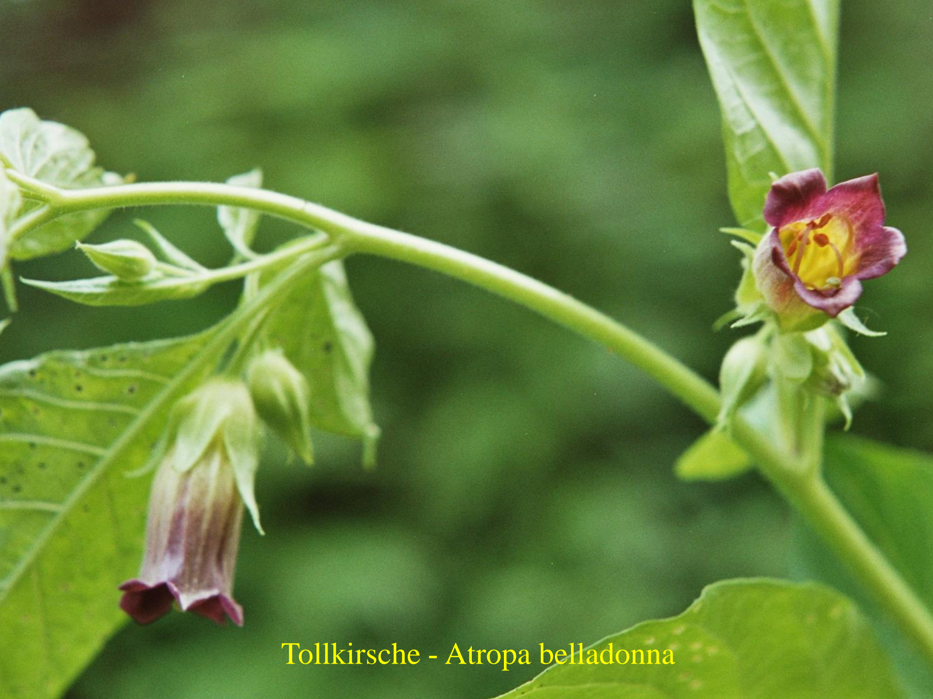
Tollkirsche - Atropa belladonna