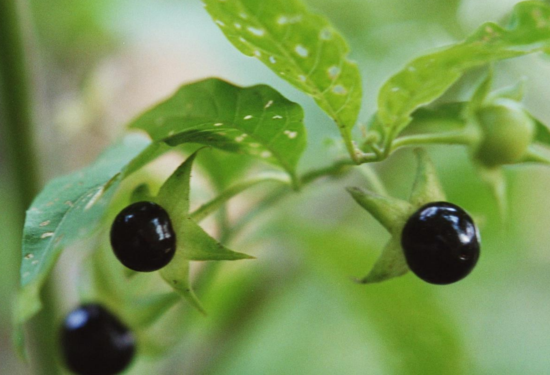
Tollkirsche - Atropa belladonna