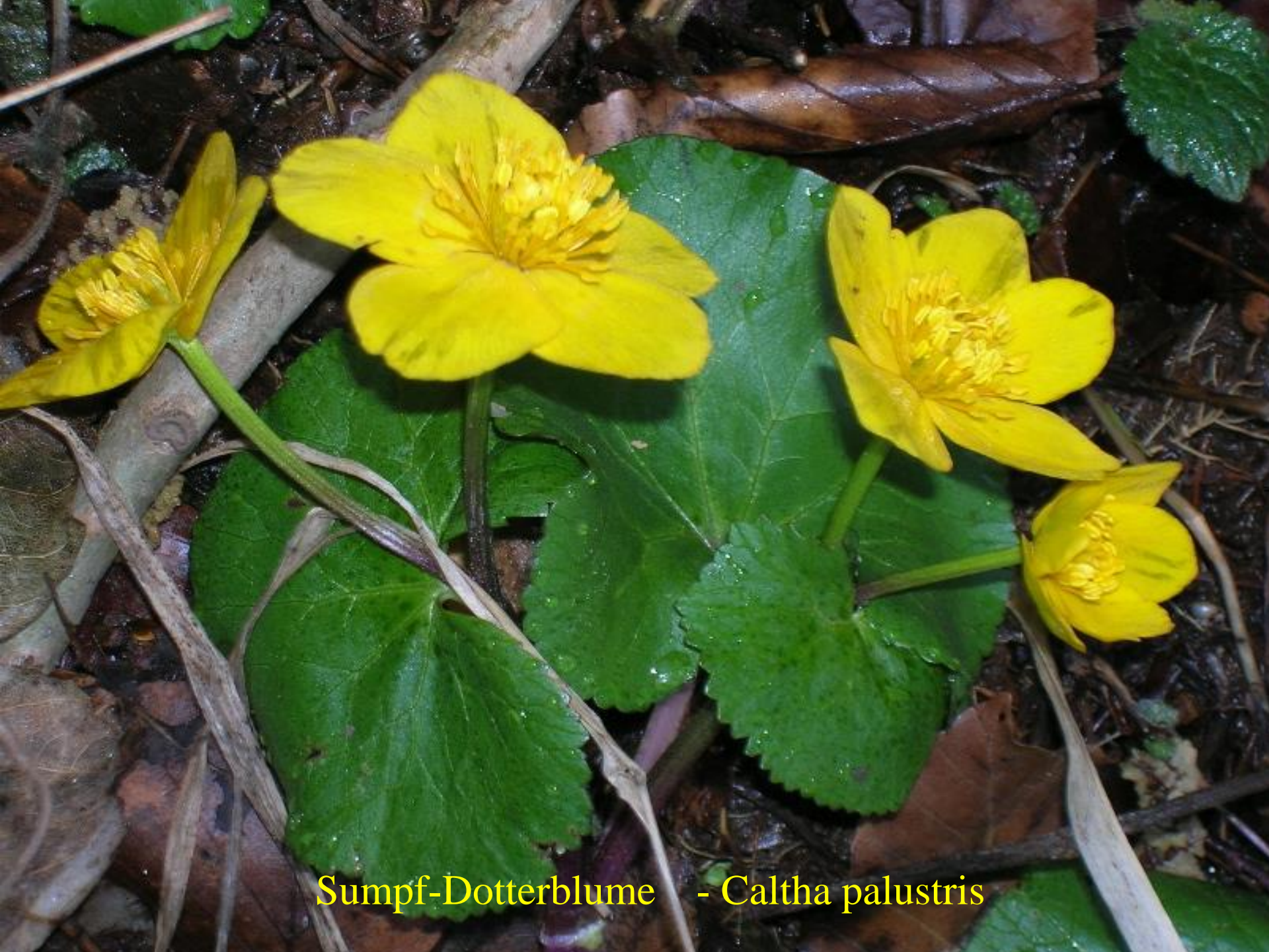
Sumpf-Dotterblume - Caltha palustris