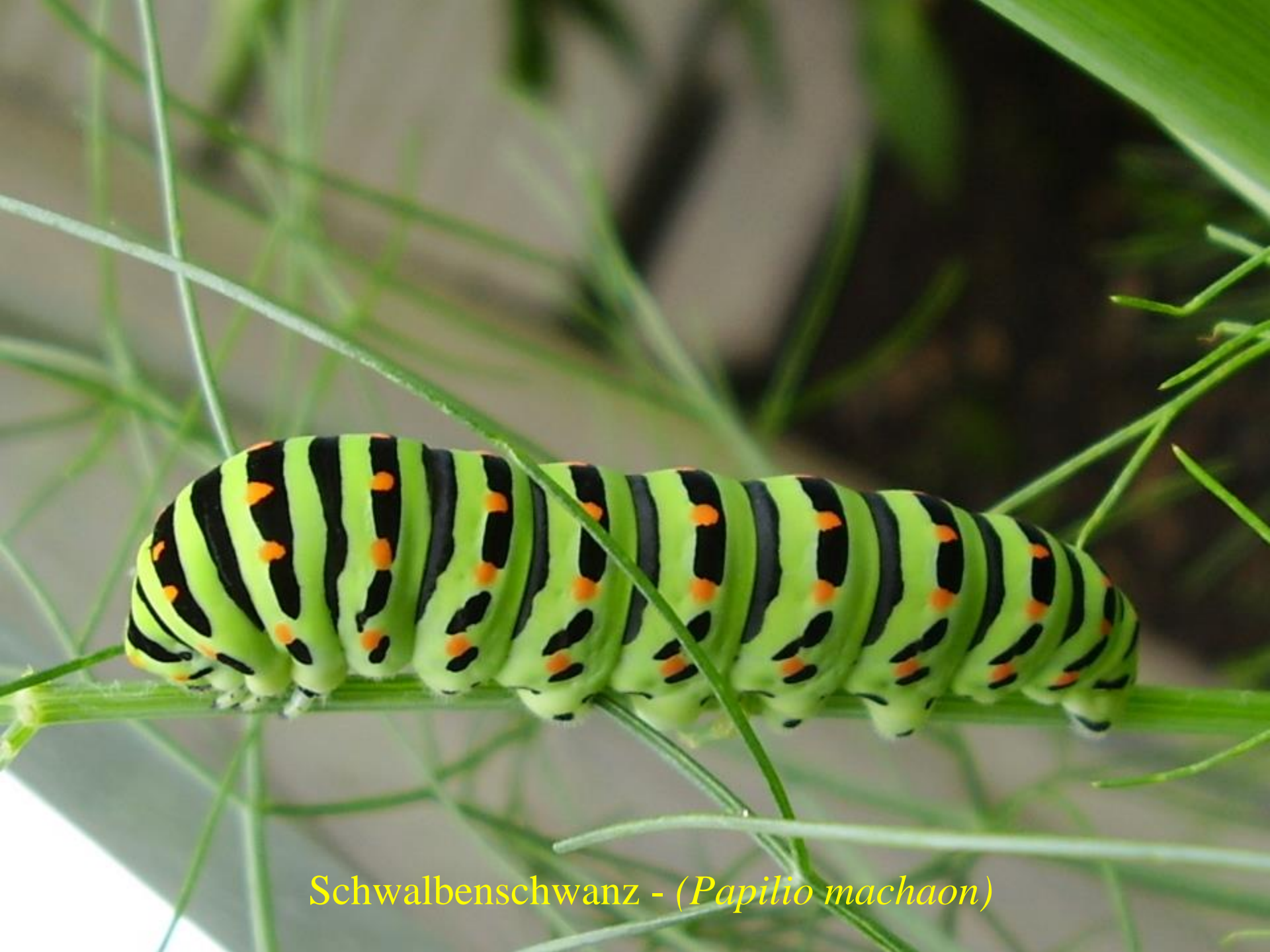
Schwalbenschwanz - ( Papilio machaon )