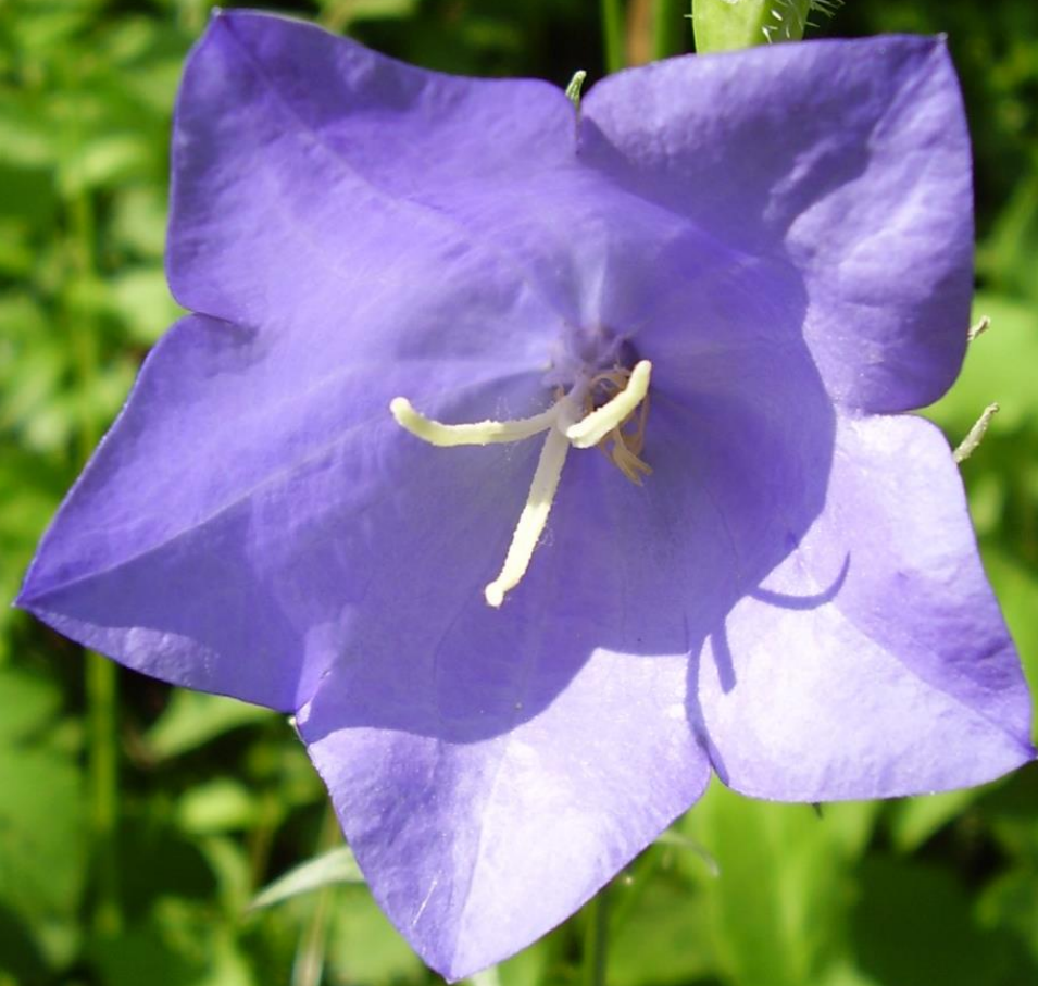
Pfirsichblättrige Glockenblume - Campanula persicifolia