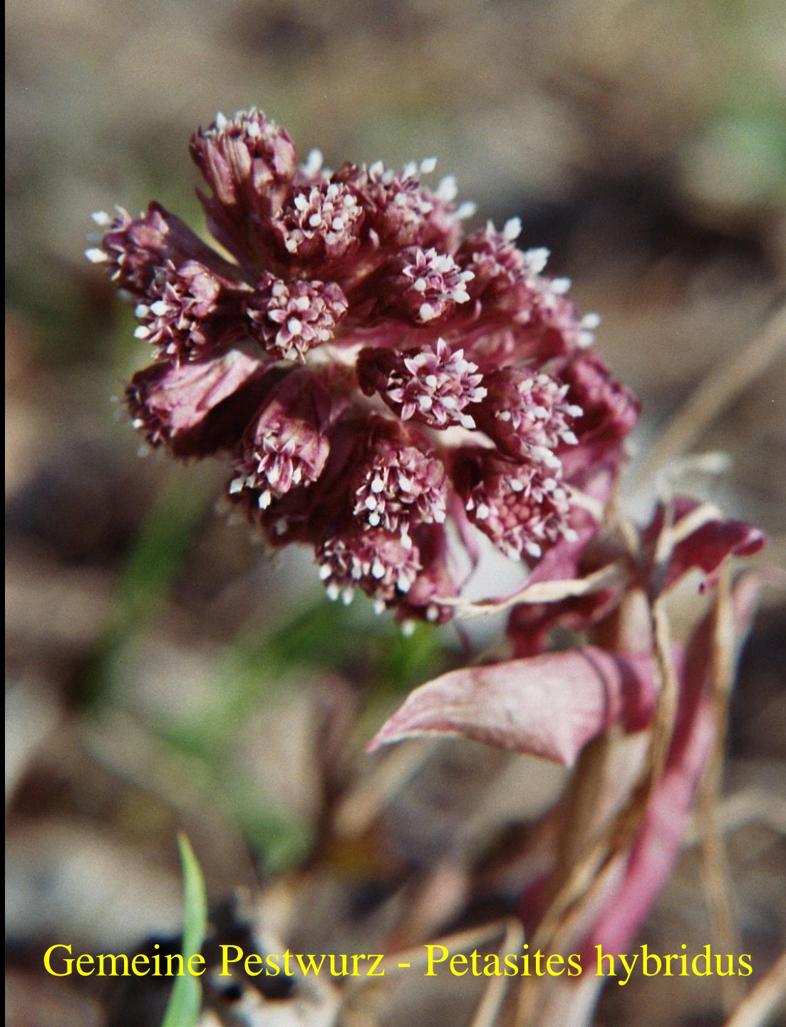
Gemeine Pestwurz - Petasites hybridus