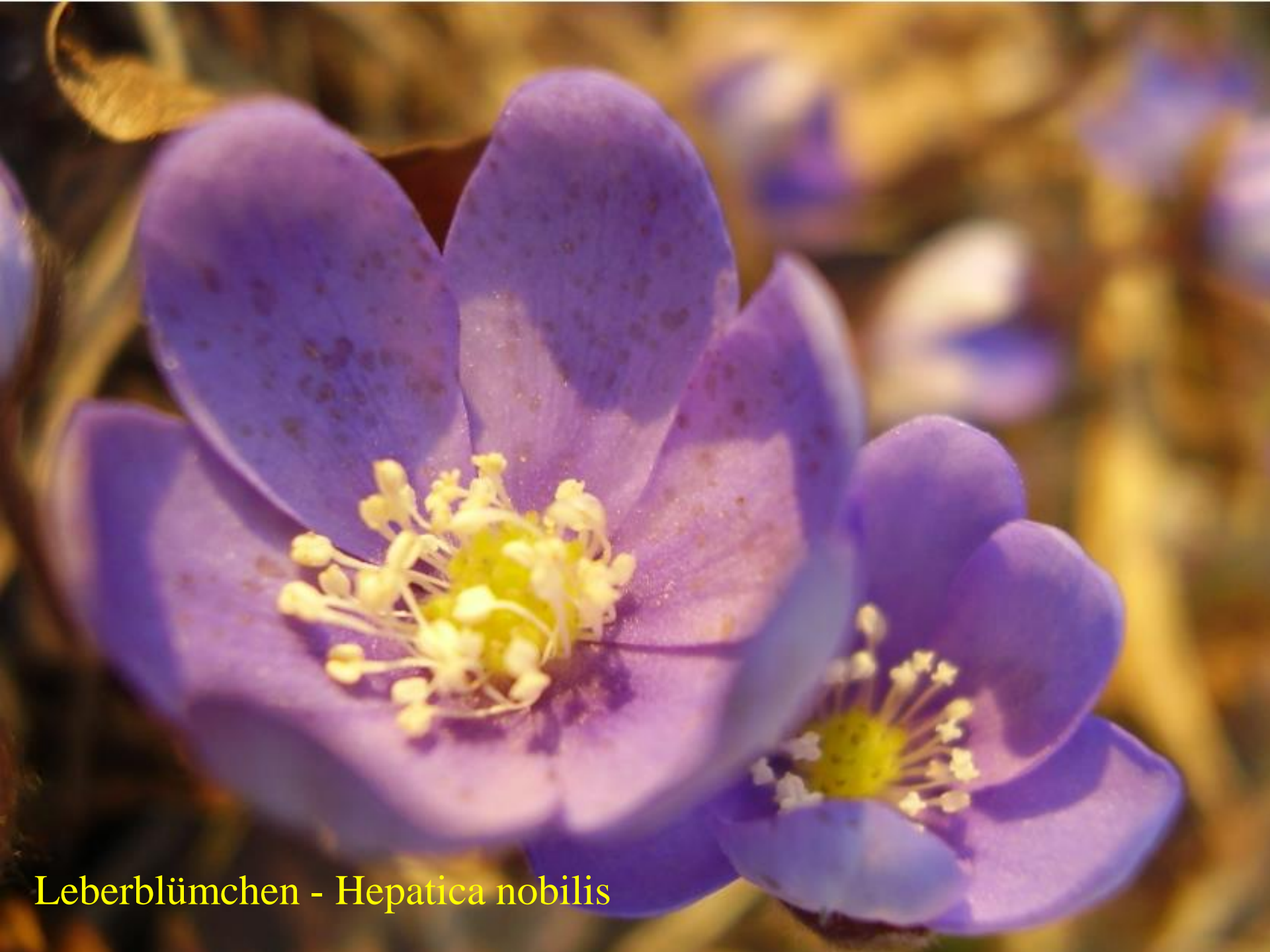
Leberblümchen - Hepatica nobilis