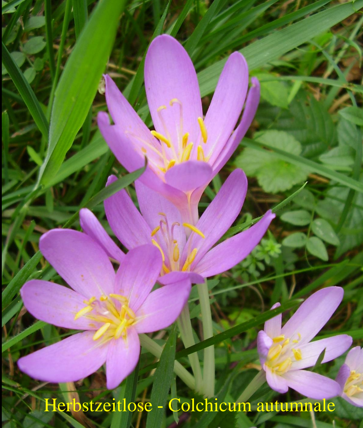
Herbstzeitlose - Colchicum autumnale