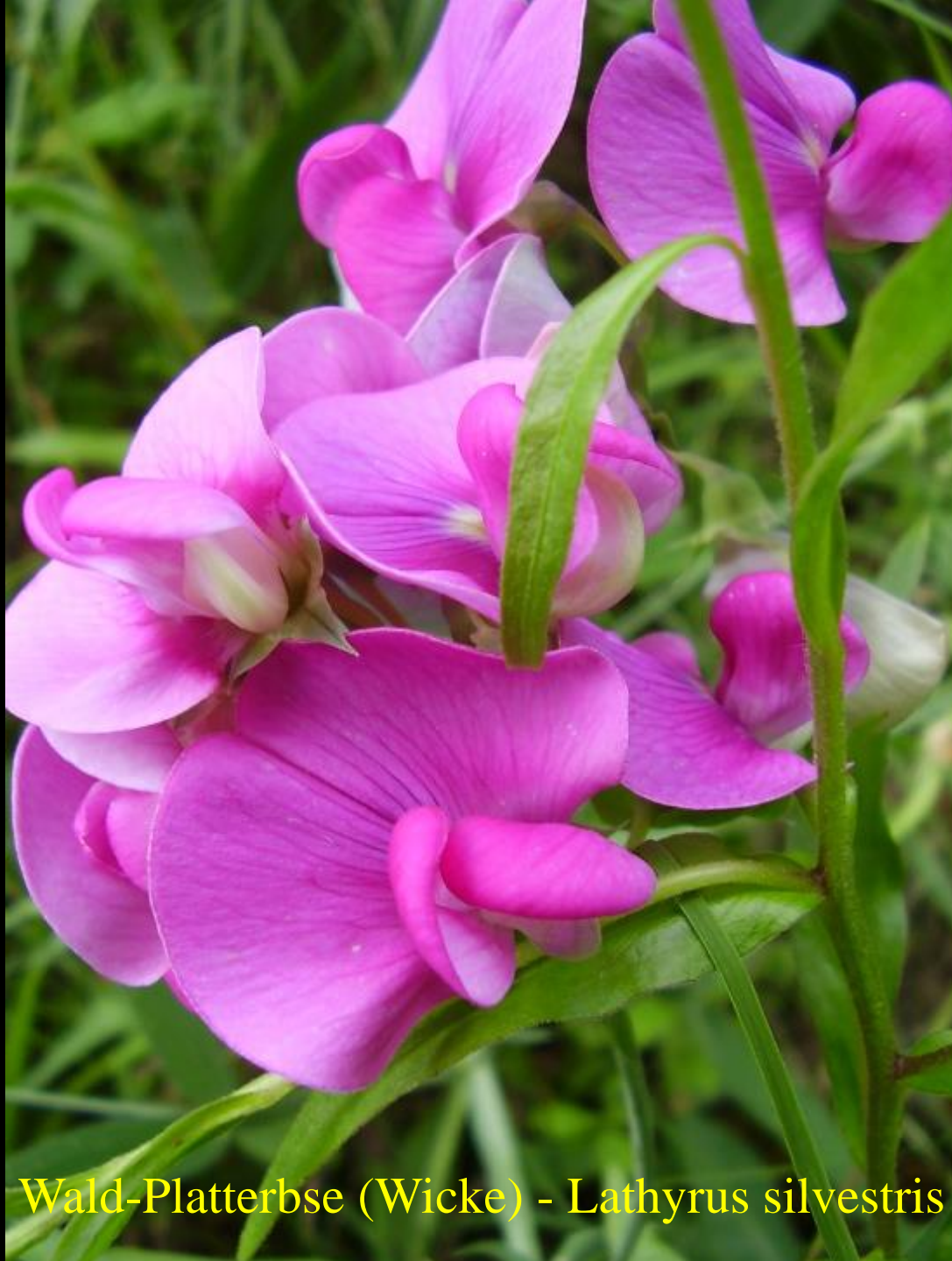
Wald-Platterbse (Wicke) - Lathyrus silvestris