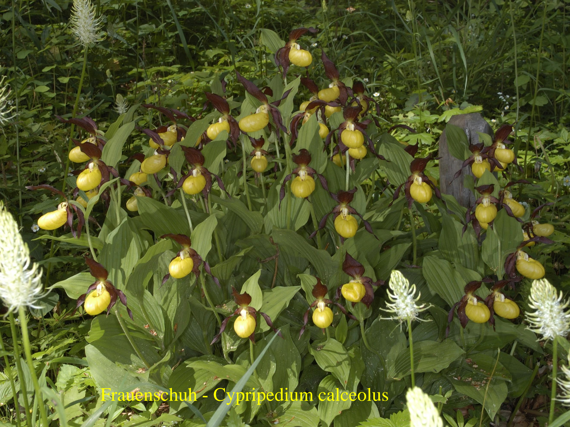
Frauenschuh - Cypripedium calceolus