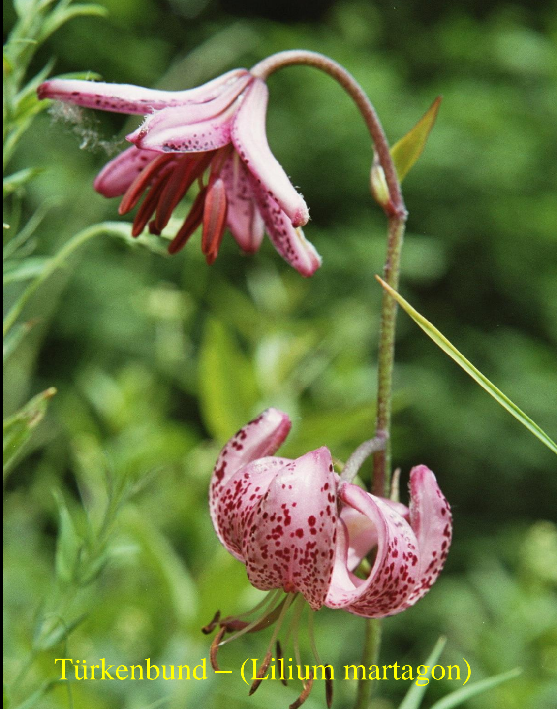
Türkenbund – ( Lilium martagon )