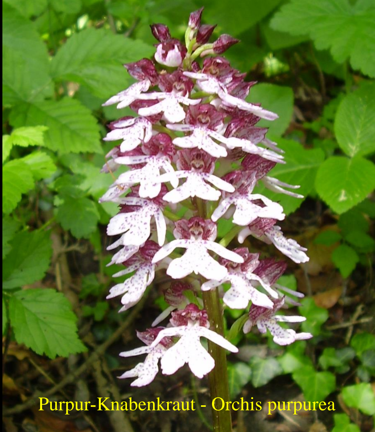
Purpur-Knabenkraut - Orchis purpurea