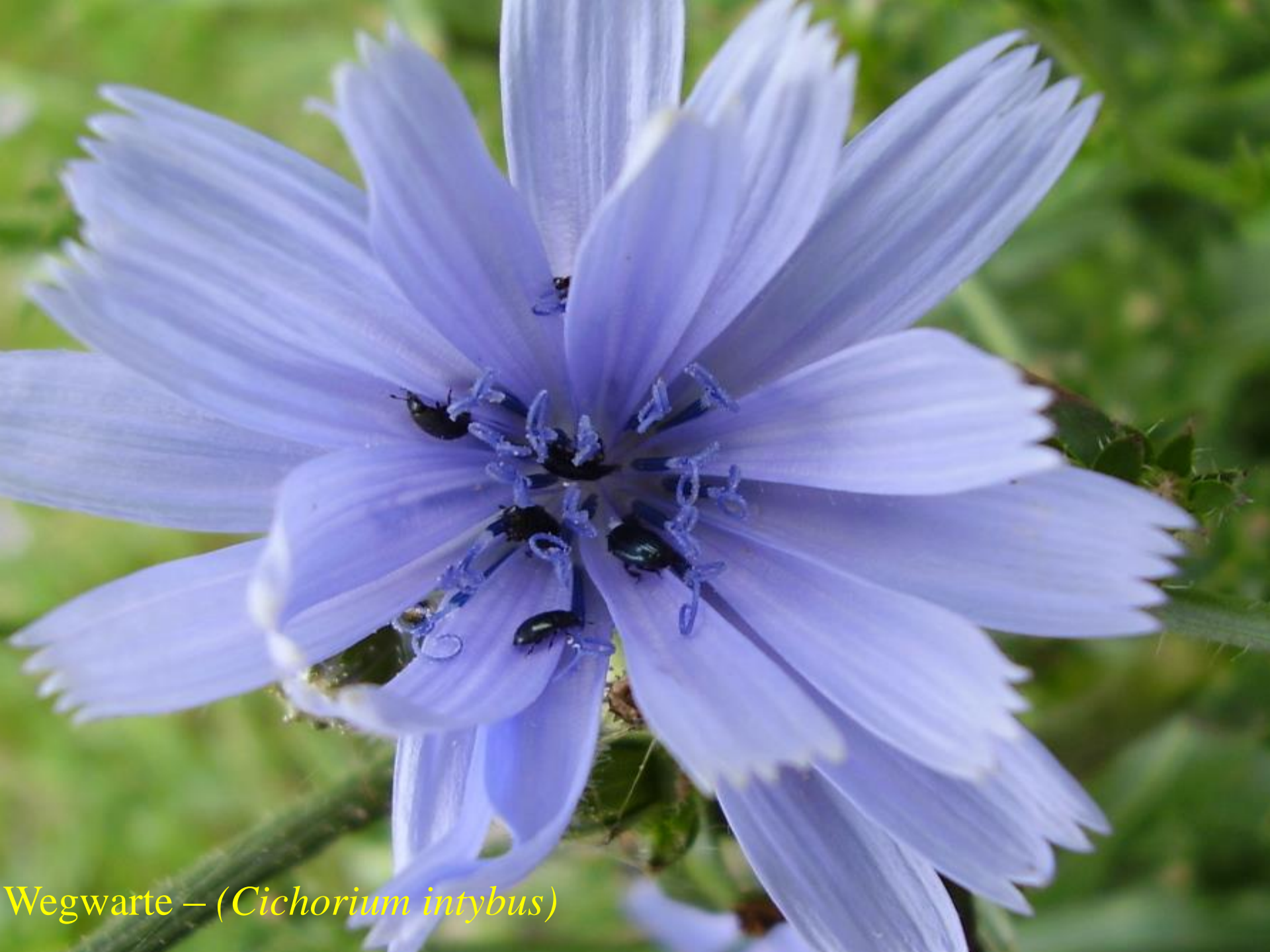
Wegwarte – ( Cichorium intybus )