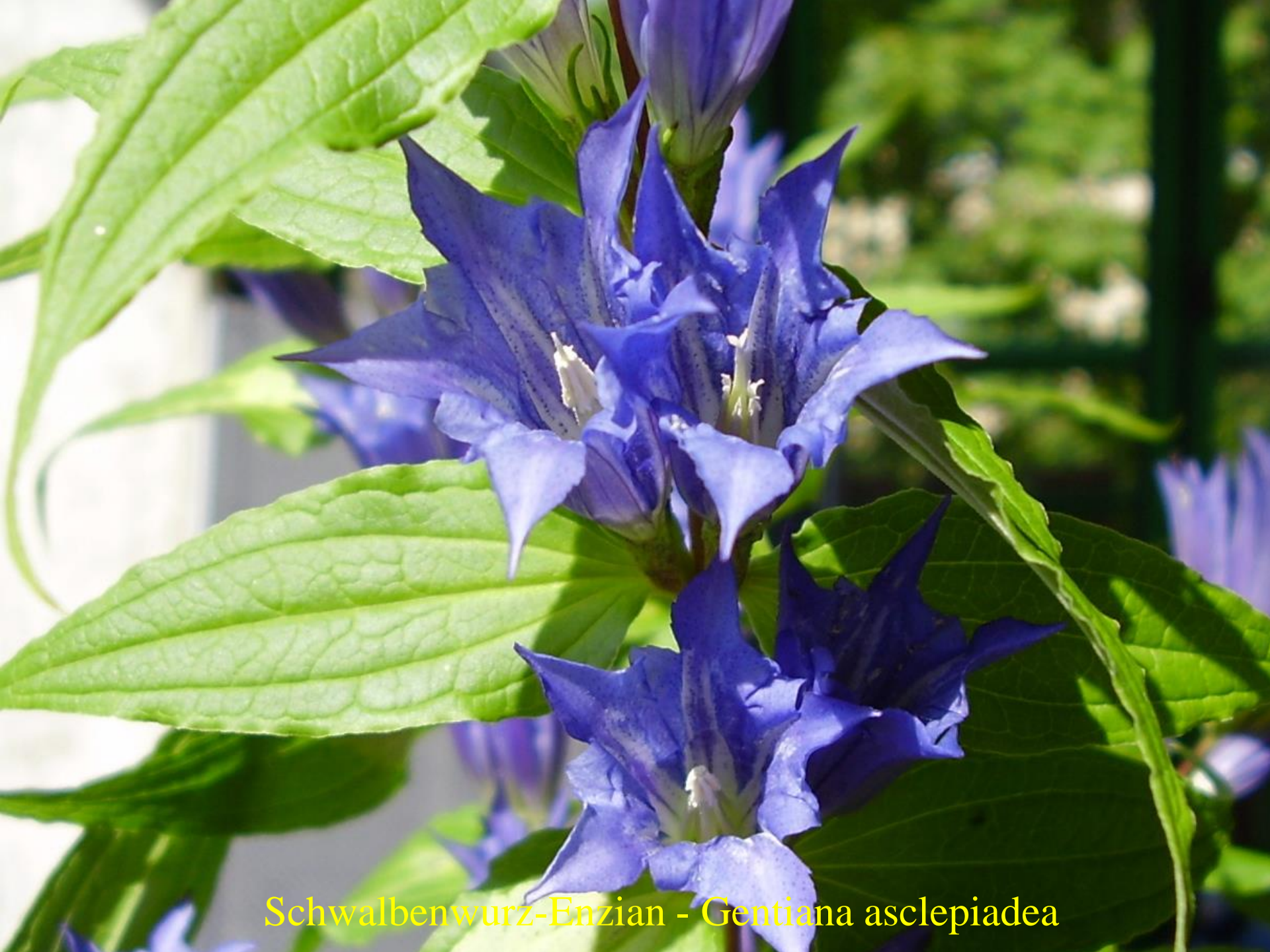
Schwalbenwurz-Enzian - Gentiana asclepiadea