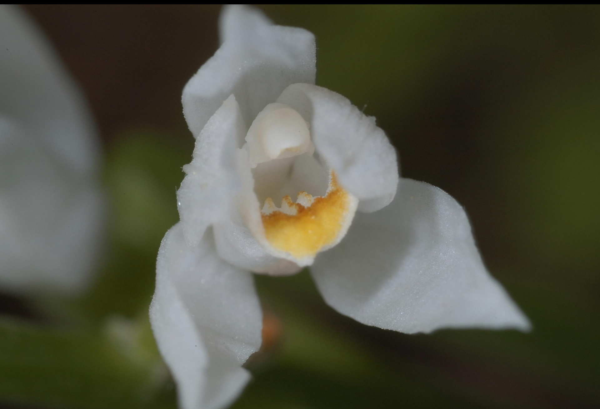
Weisses Waldvögelein – Cephalanthera longifolia