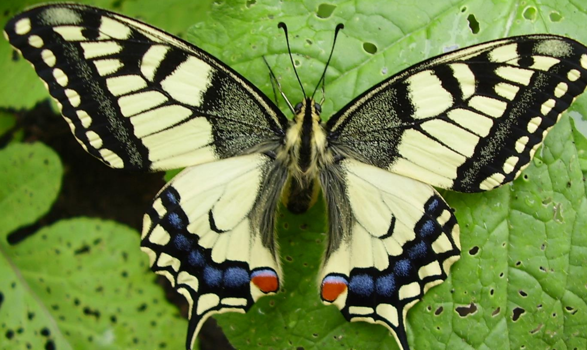
Schwalbenschwanz - ( Papilio machaon )