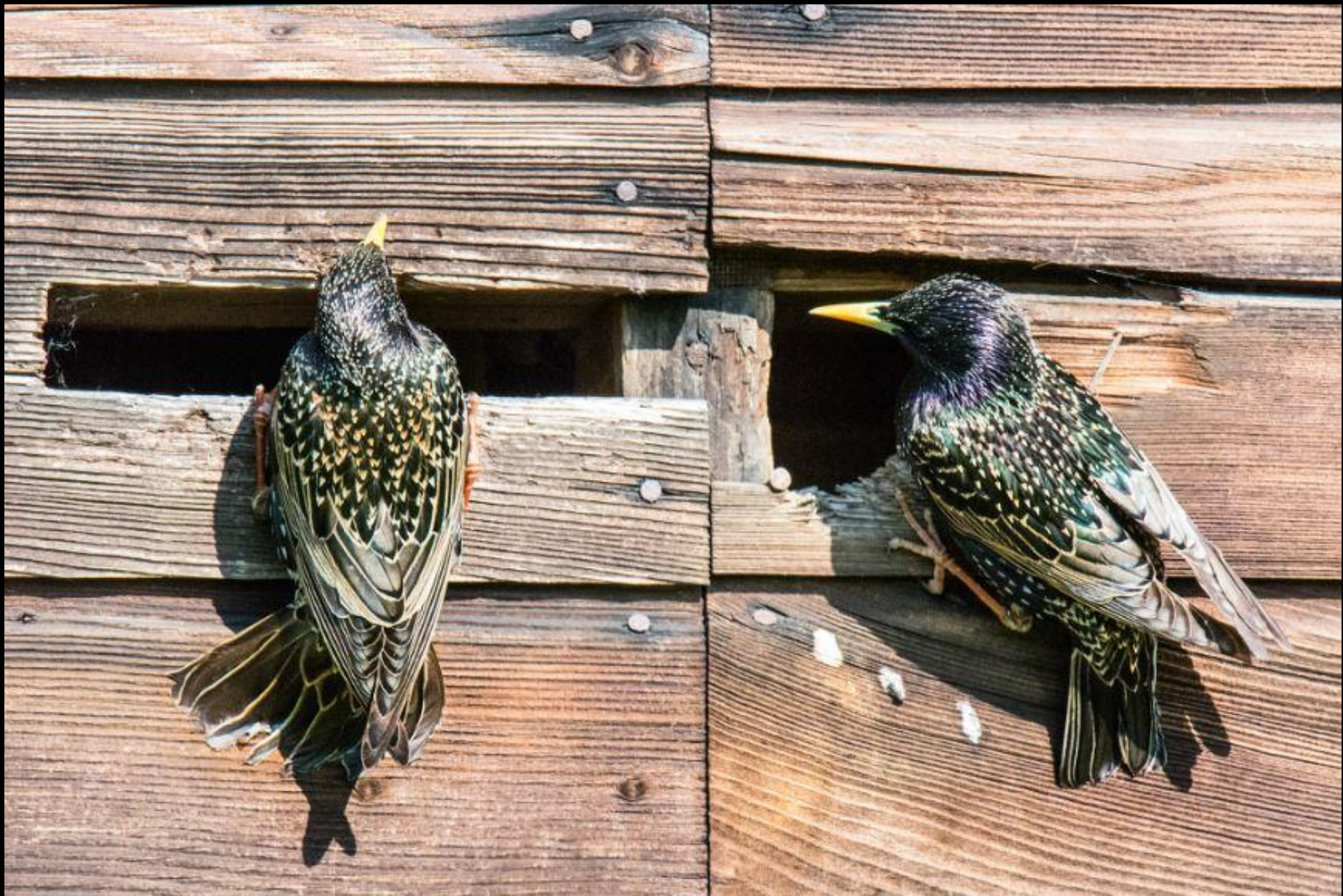
Lindenhof, Stare 29 April