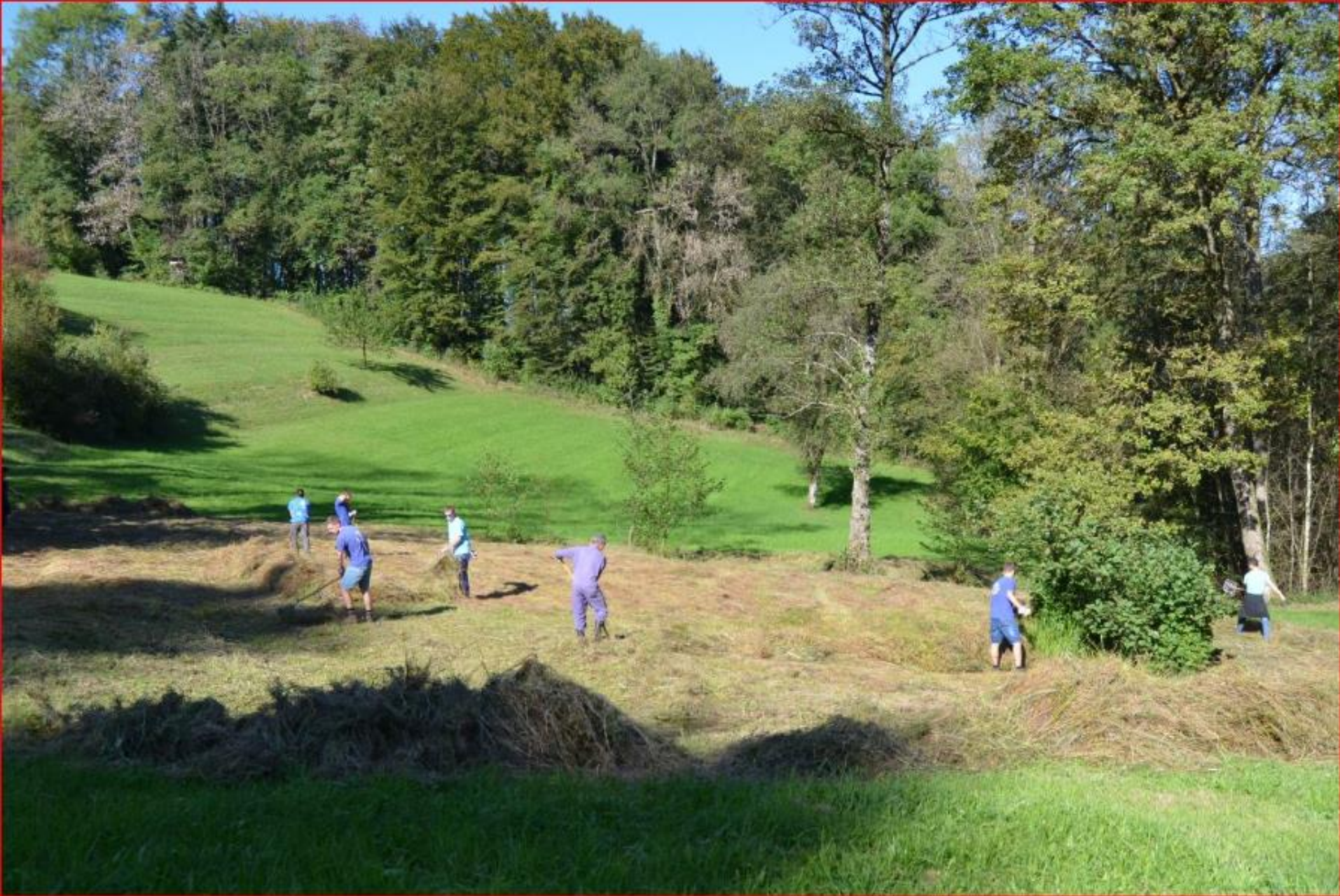
JUBLA im Auenriet 27. September