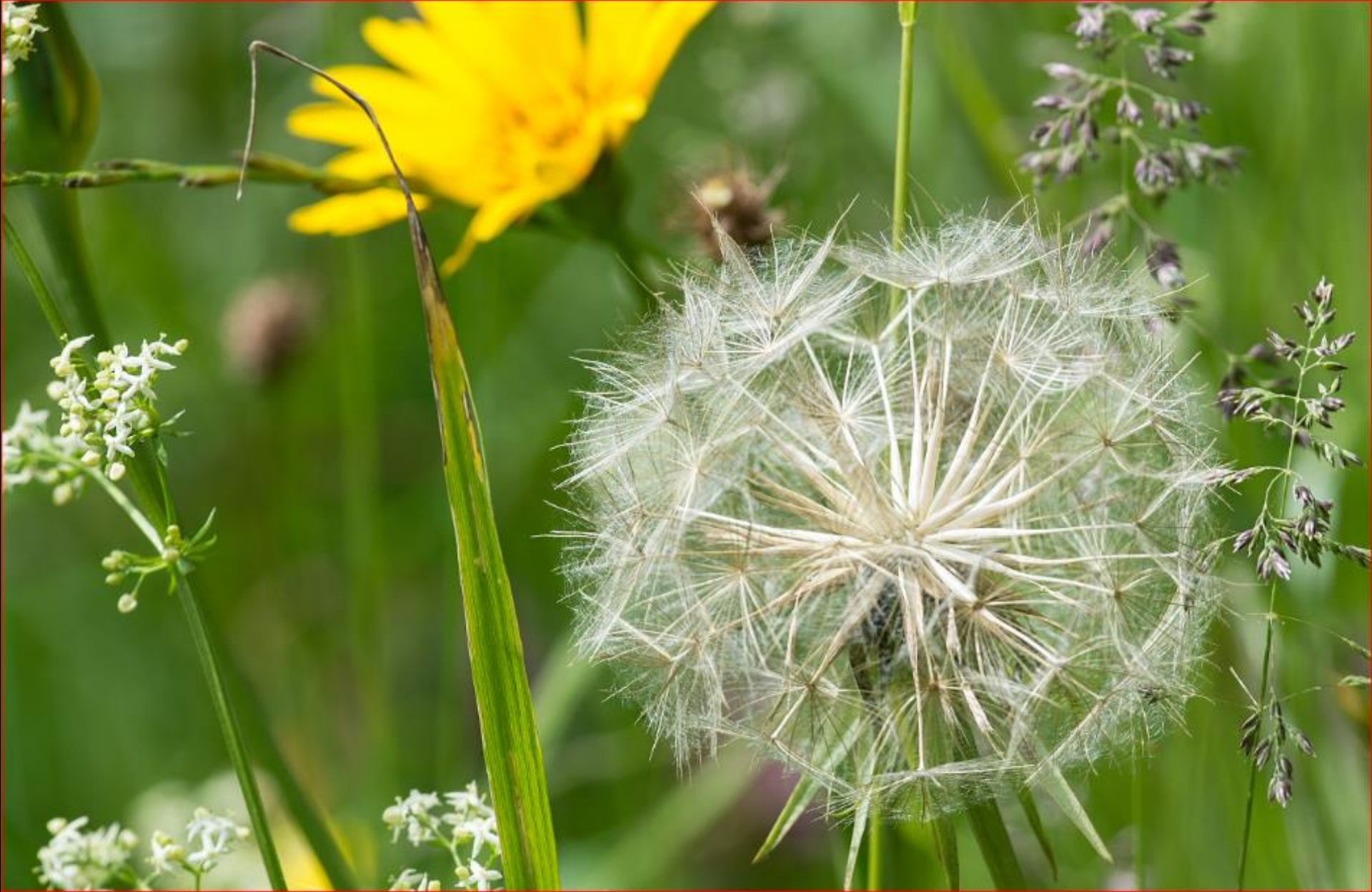
Wiesen-Bocksbart, -Labkraut, Rispengras, & Co 16. Mai