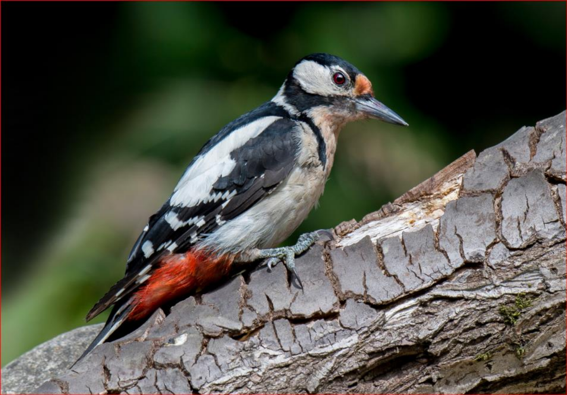
Buntspecht 16. Juni