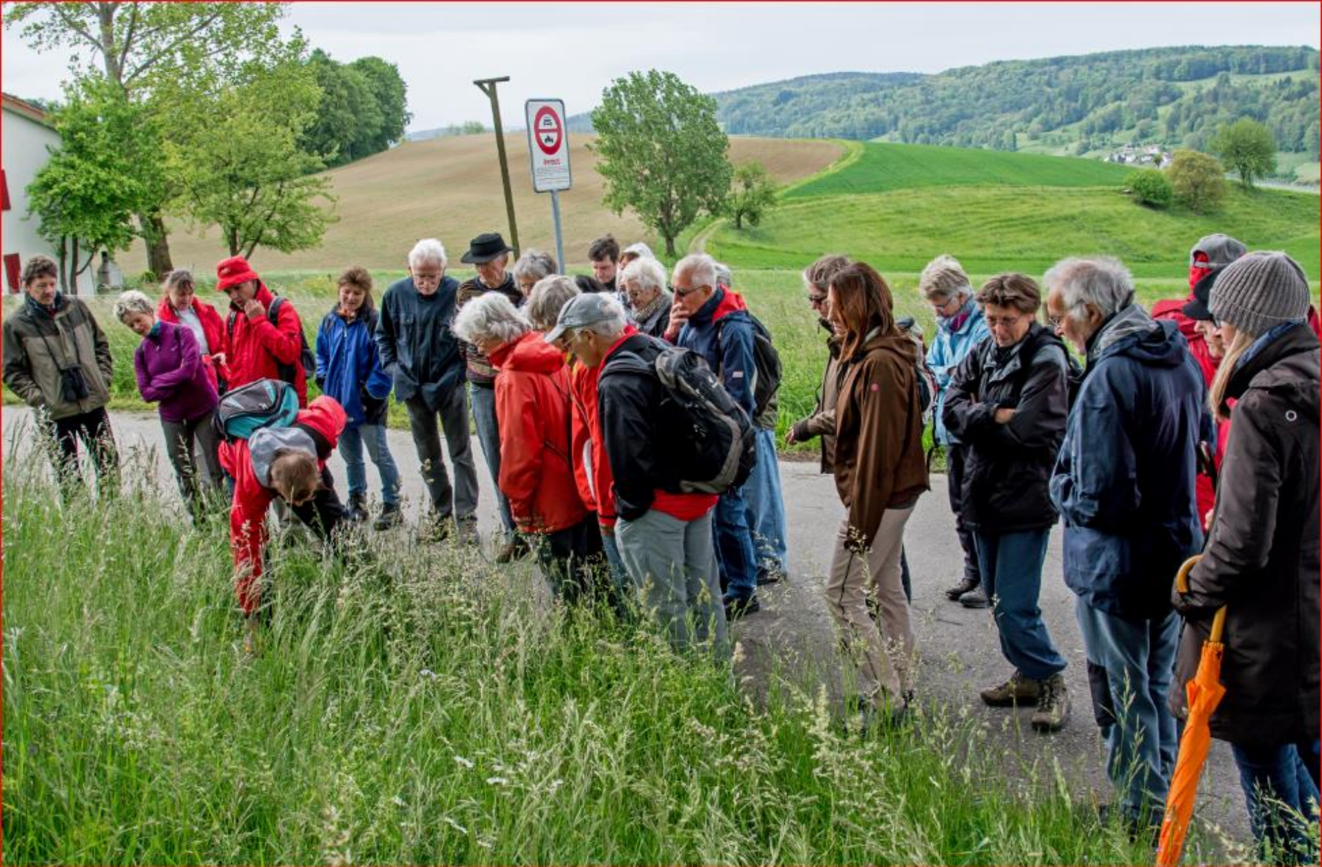
Exkursion Orchideen / Naturwiesen 11. Mai