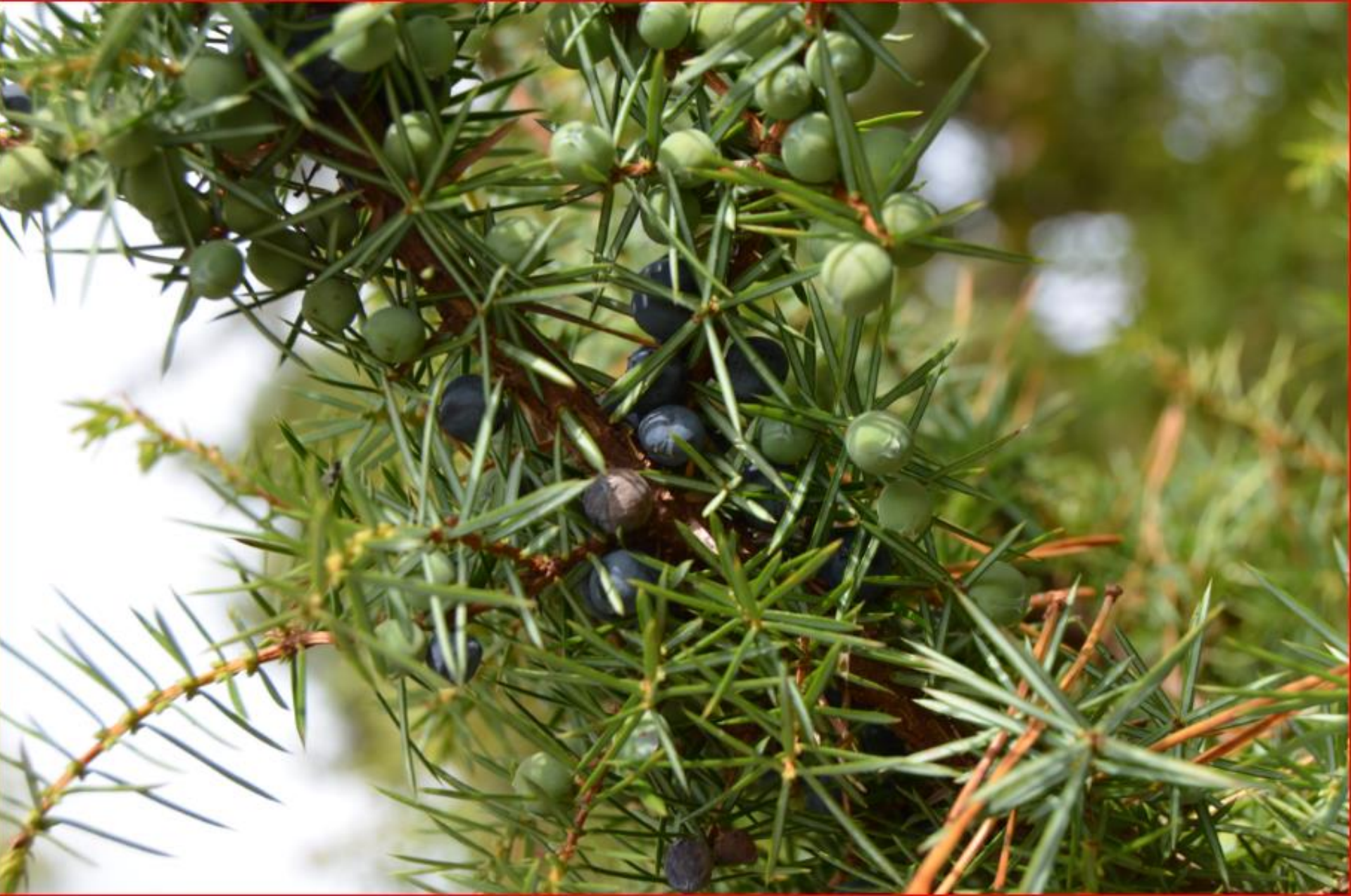
Wacholder 5. Oktober