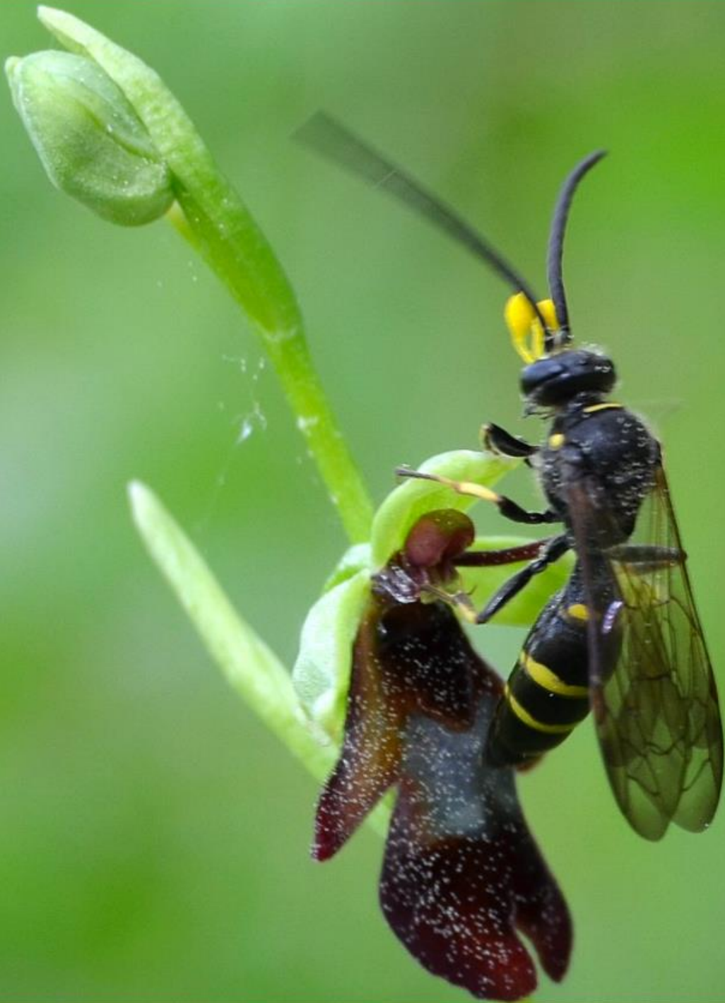
Grabwespe auf Fliegen-Ragwurz 6. Mai