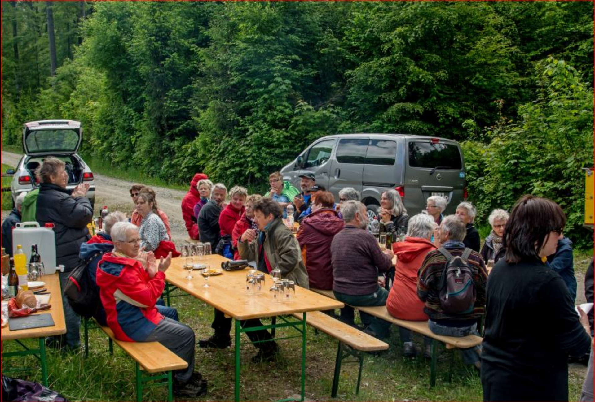
Exkursion Orchideen / Naturwiesen 11. Mai