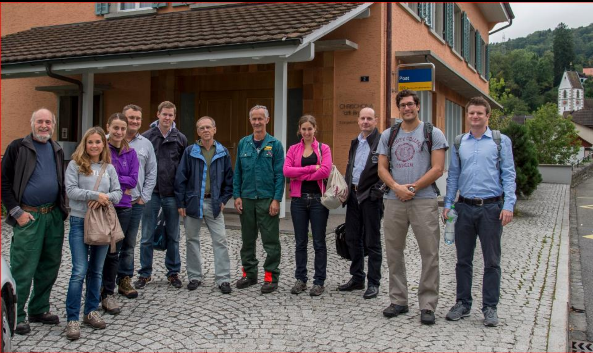
UBS-Team-Einsatz - Auenriet 3. September