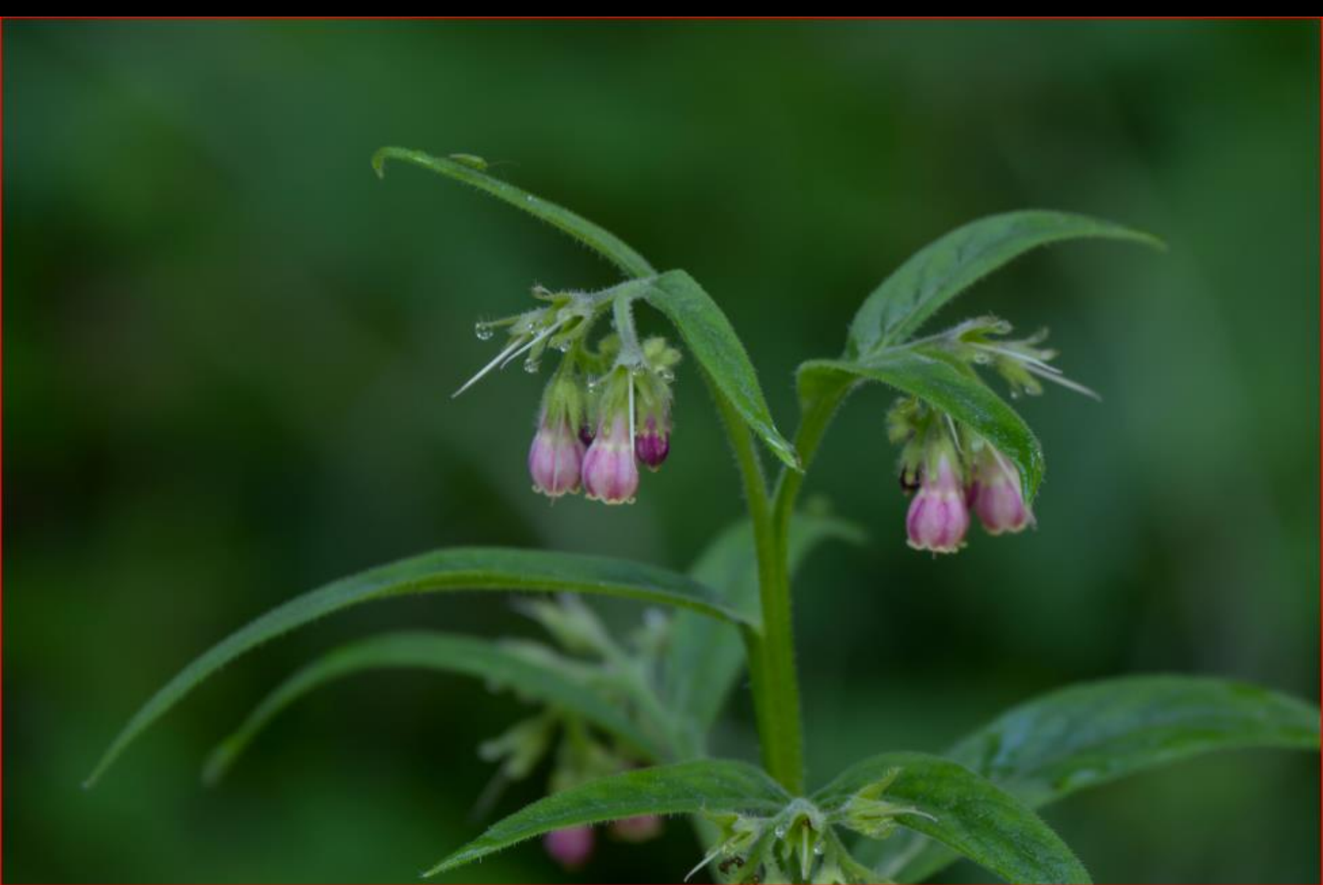
Wallwurz/Beinwell 6. Juli