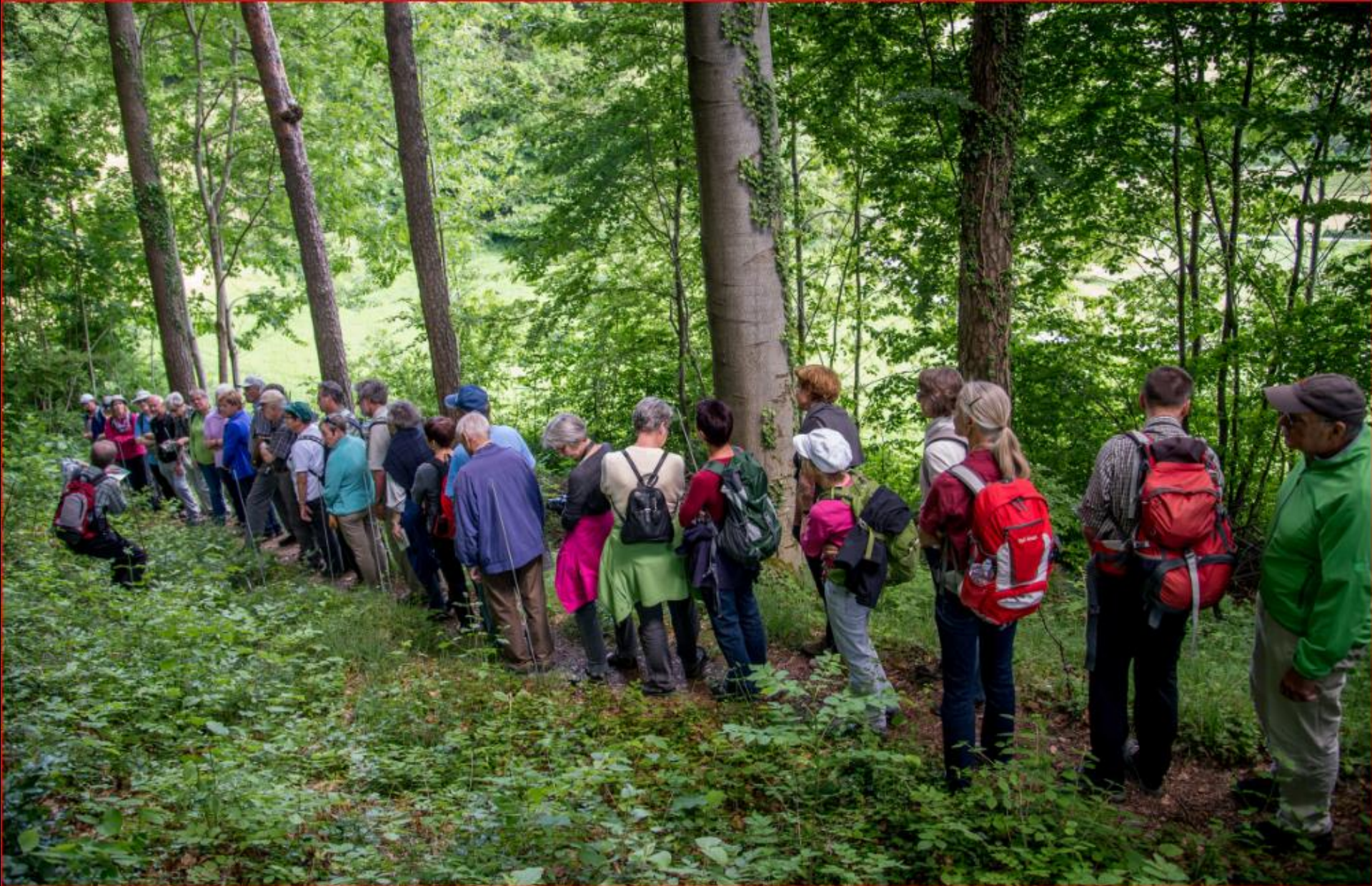
Orchideen-Exkursion mit NVV Bülach 24. Mai