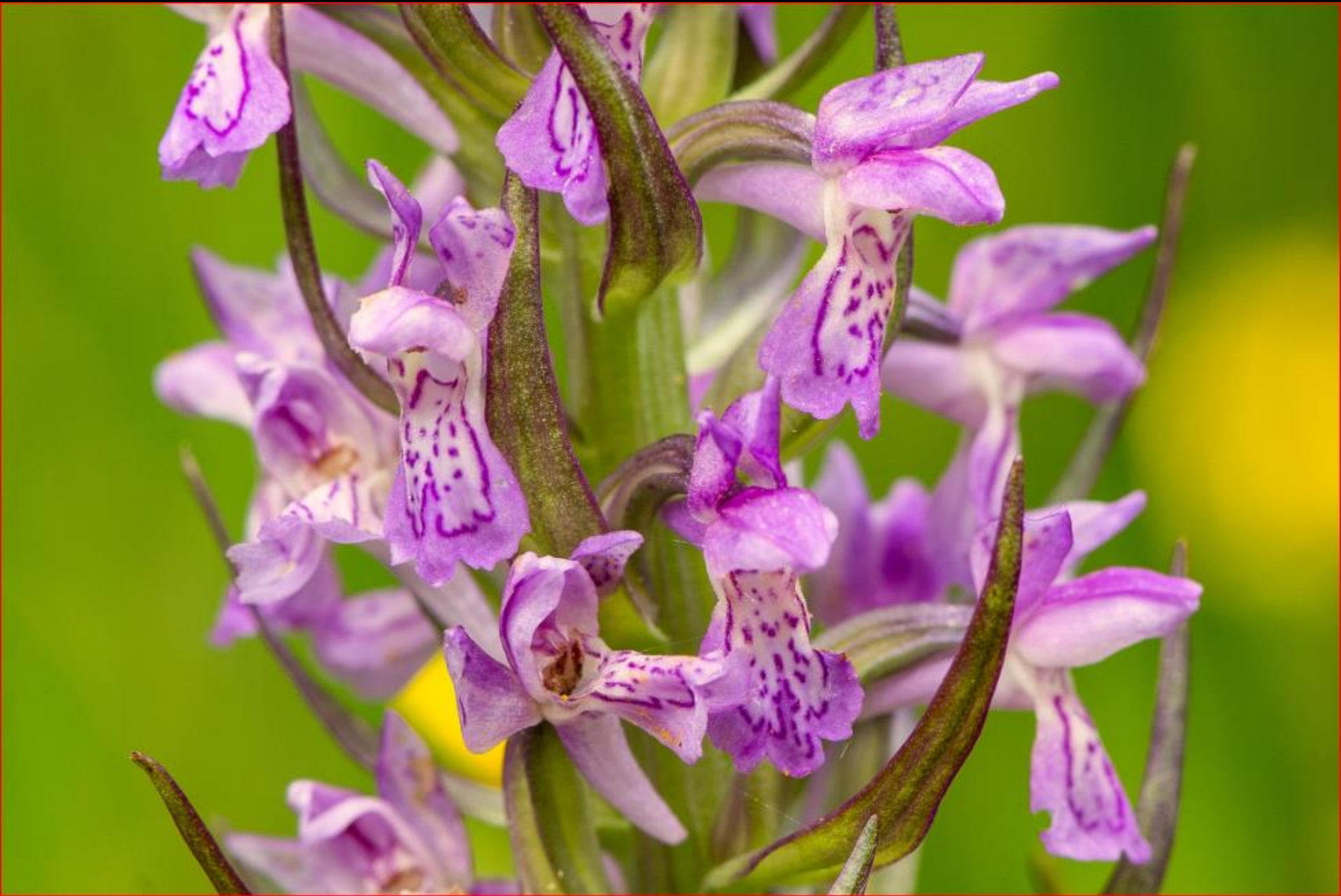
Fleischrotes Knabenkraut 26. Mai