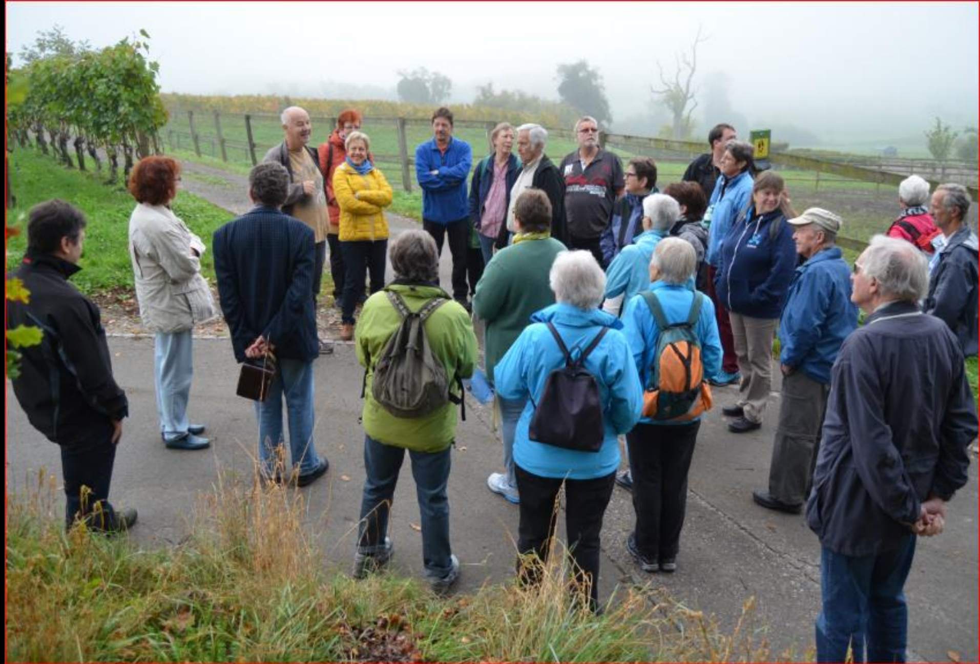
Berg am Irchel - Greifvogelstation 19. Oktober