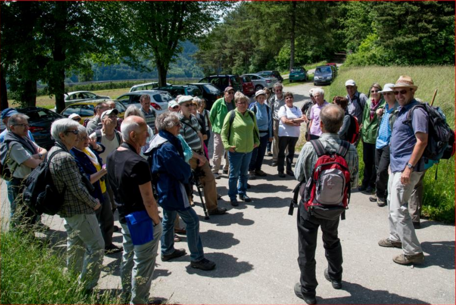
Orchideen-Exkursion mit NVV Bülach 24. Mai