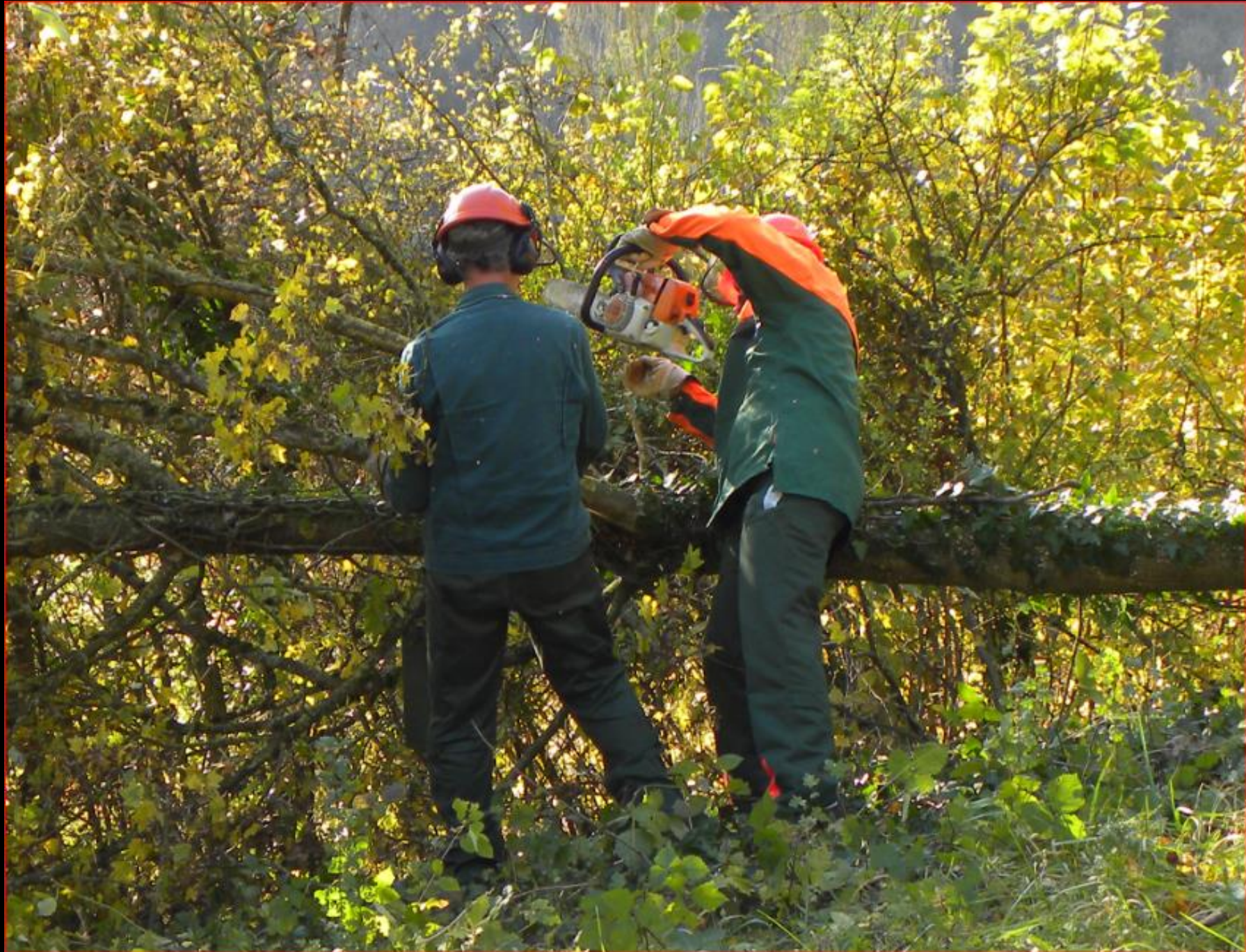
Tannholz 8. November