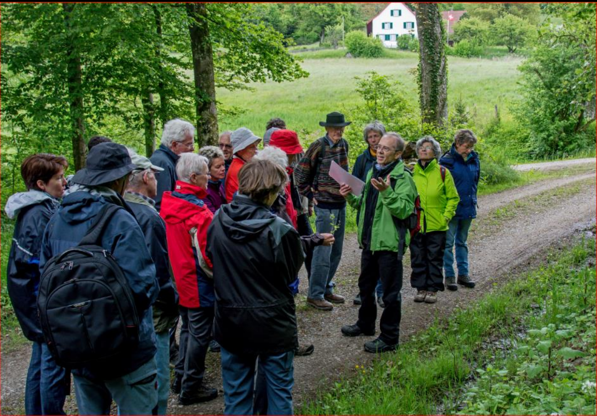
Exkursion Orchideen / Naturwiesen 11. Mai