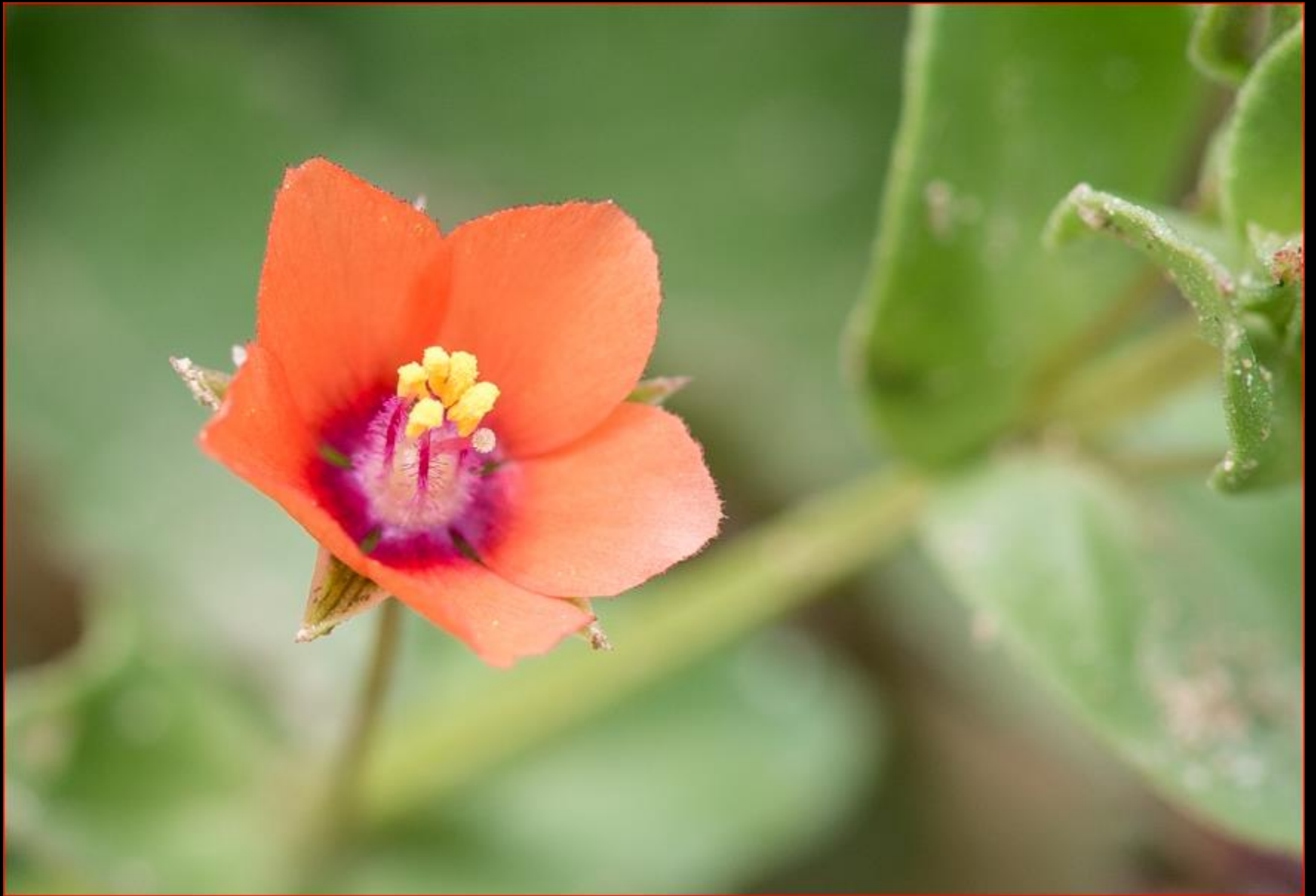
Ackergauchheil 26. Mai