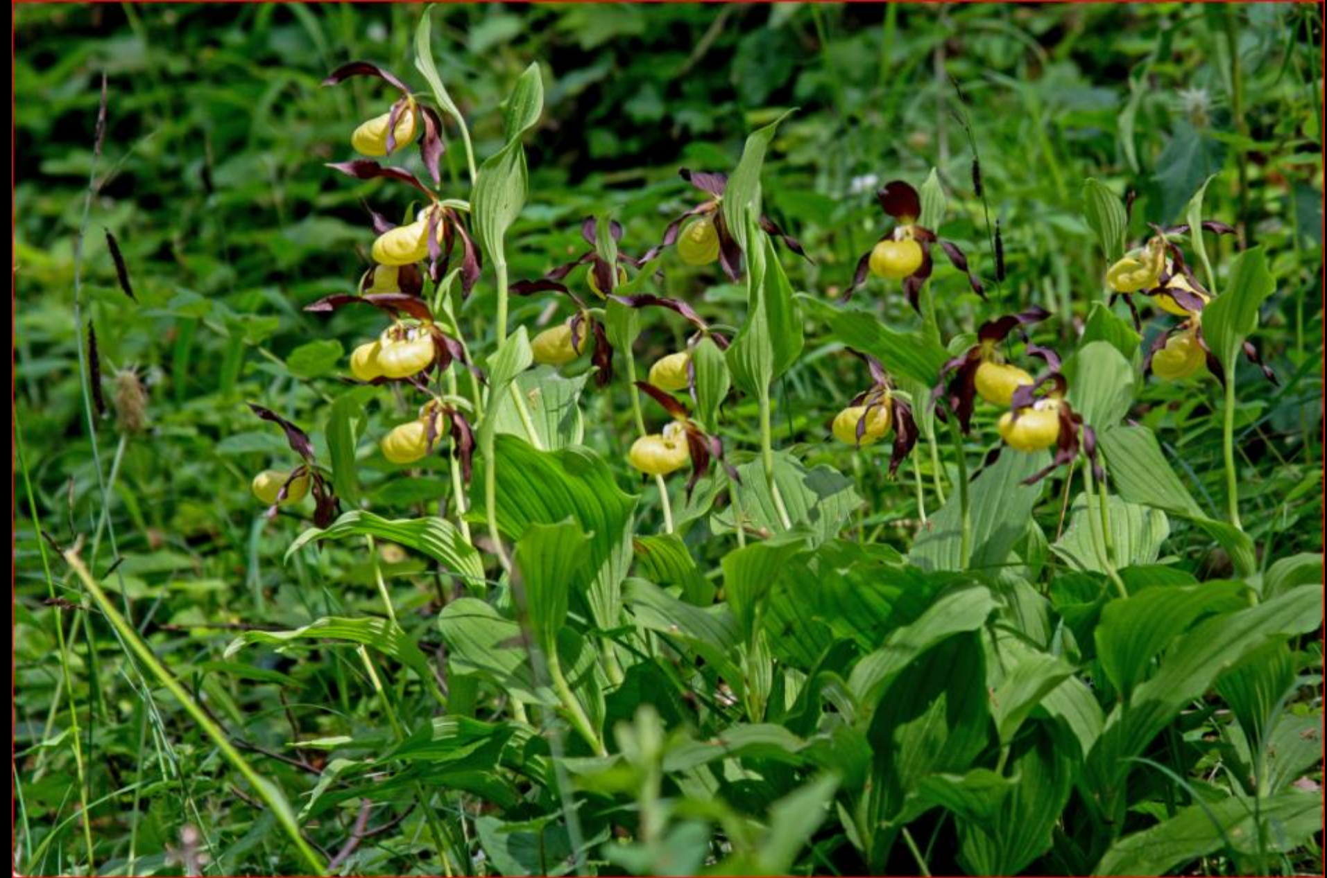
Exkursion Orchideen / Naturwiesen 11. Mai