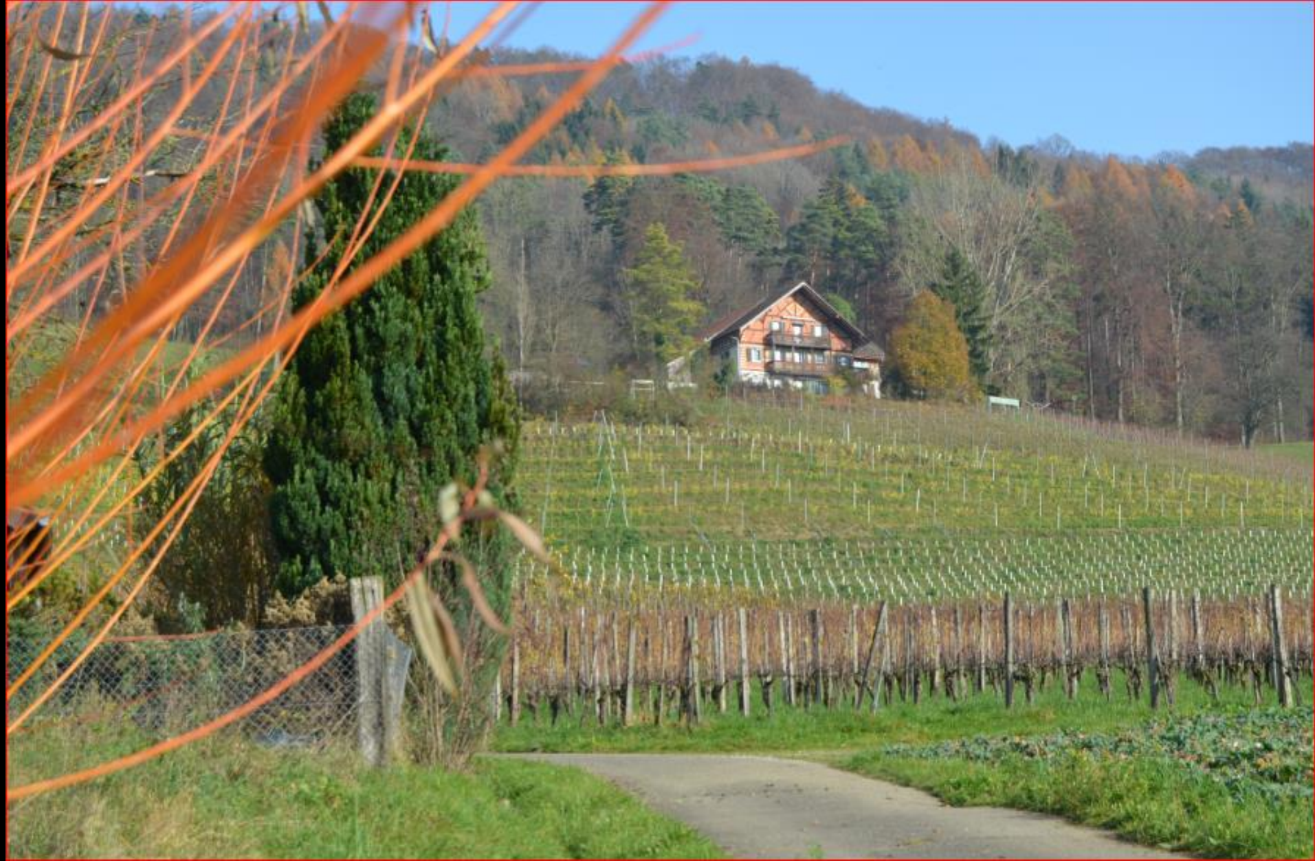
Berghof 24. November