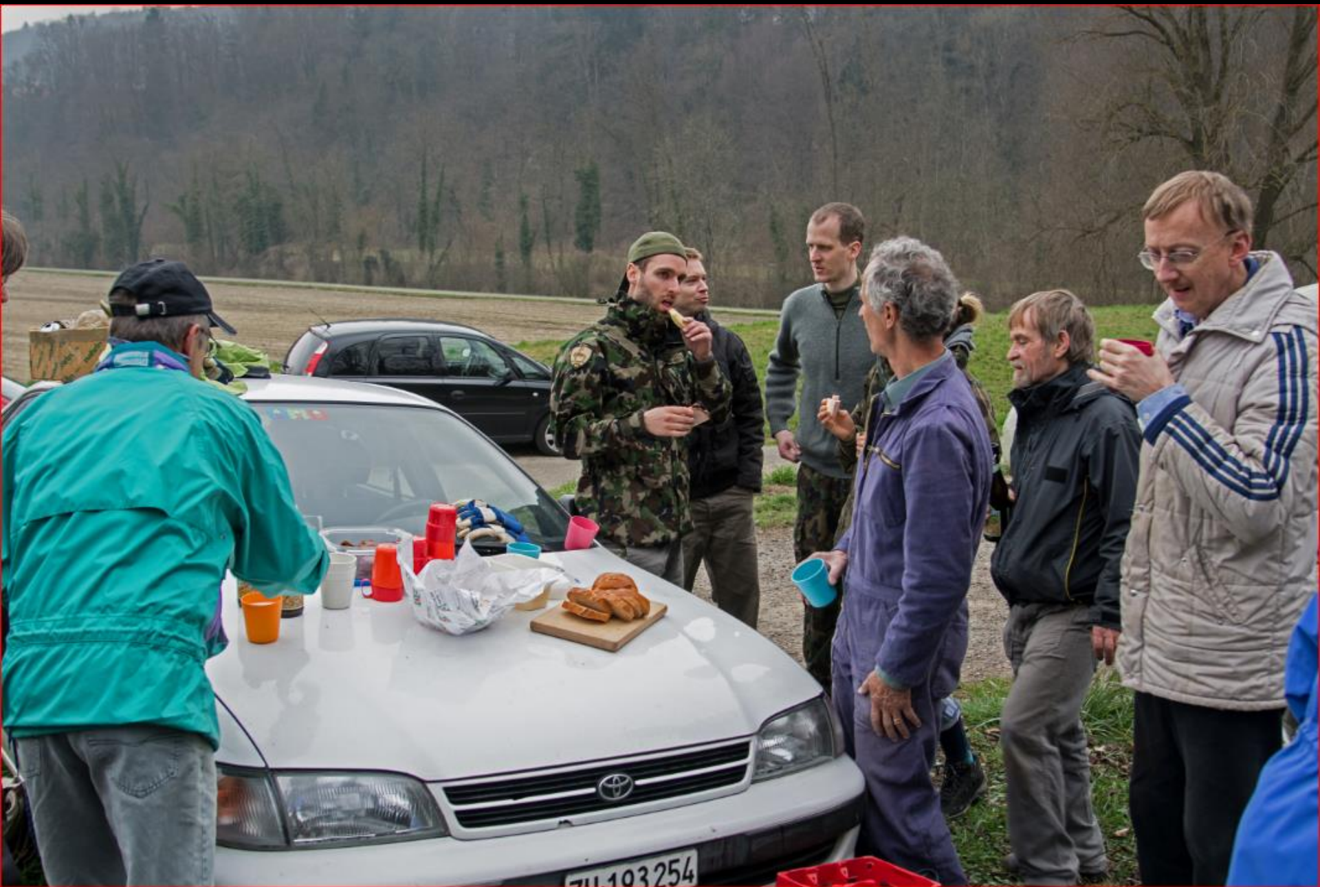
Tannholz 15. März