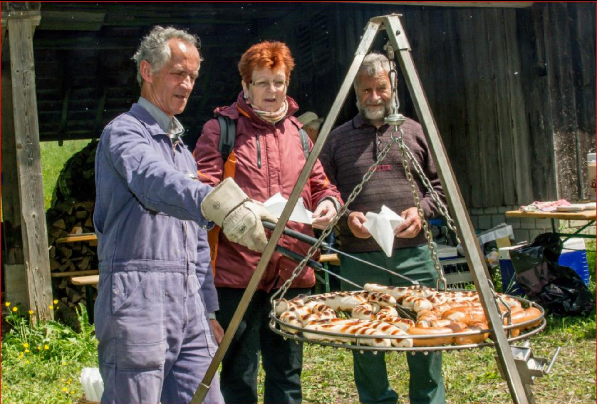
Exkursion Orchideen / Naturwiesen 11. Mai