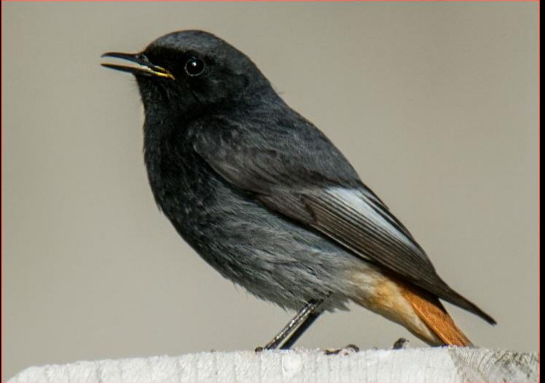
Hausrotschwanz 29. April