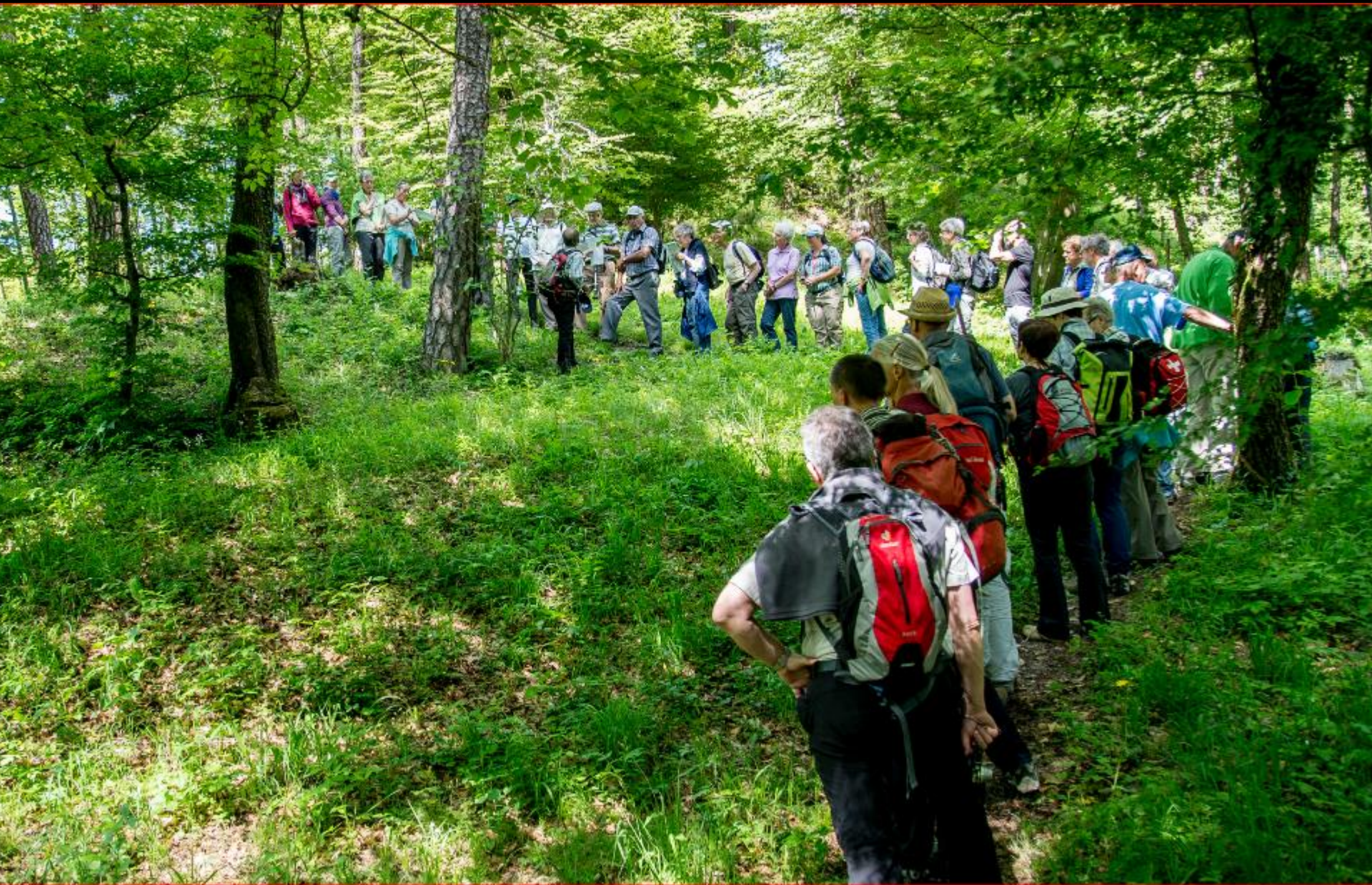
Orchideen-Exkursion mit NVV Bülach 24. Mai