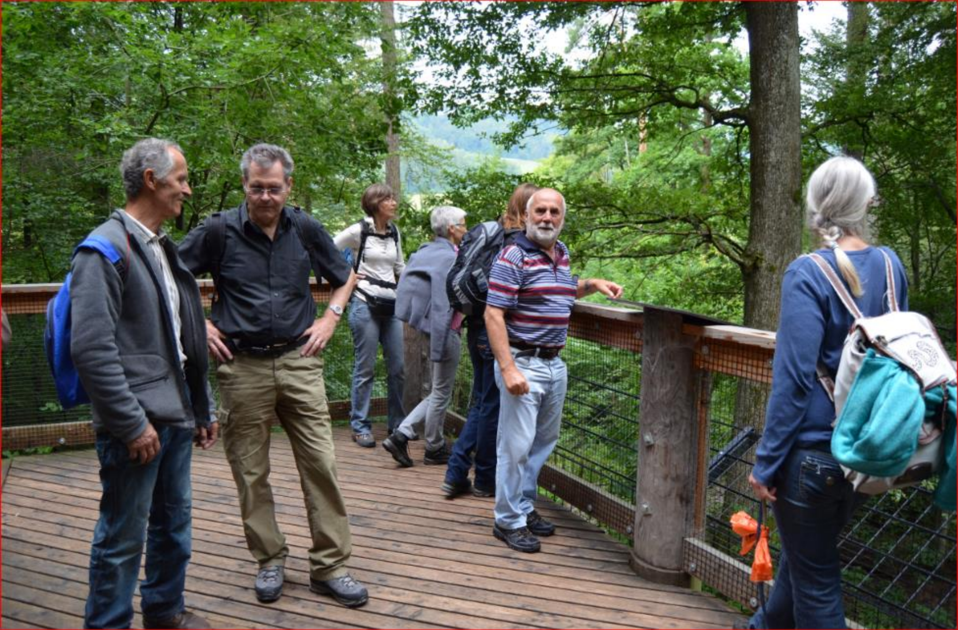
Ausflug Gruppe Naturschutz – im Sihlwald 12. Juli