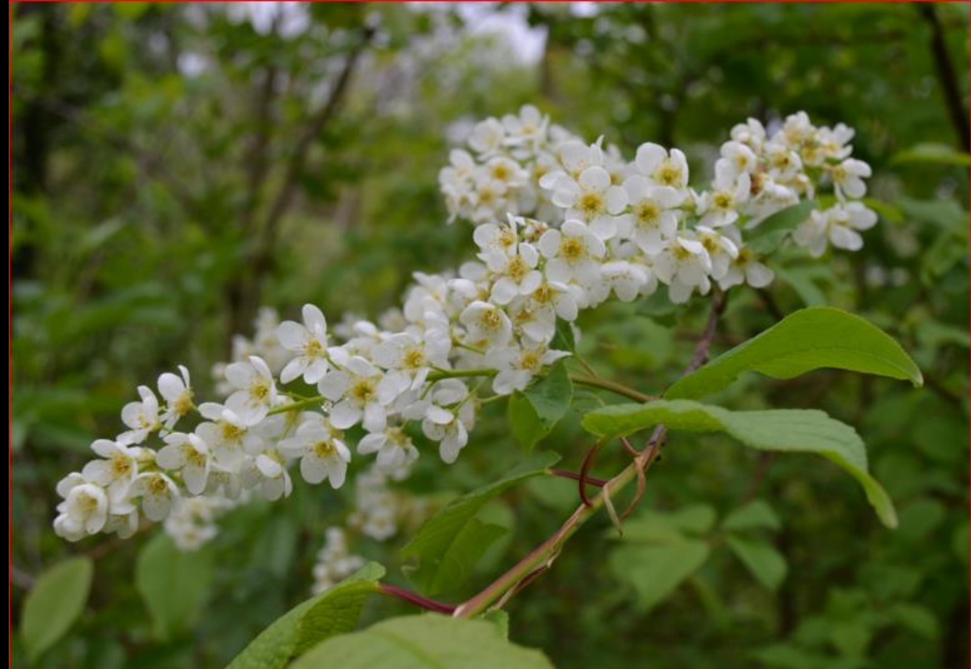
Traubenkirschblüte 19. April