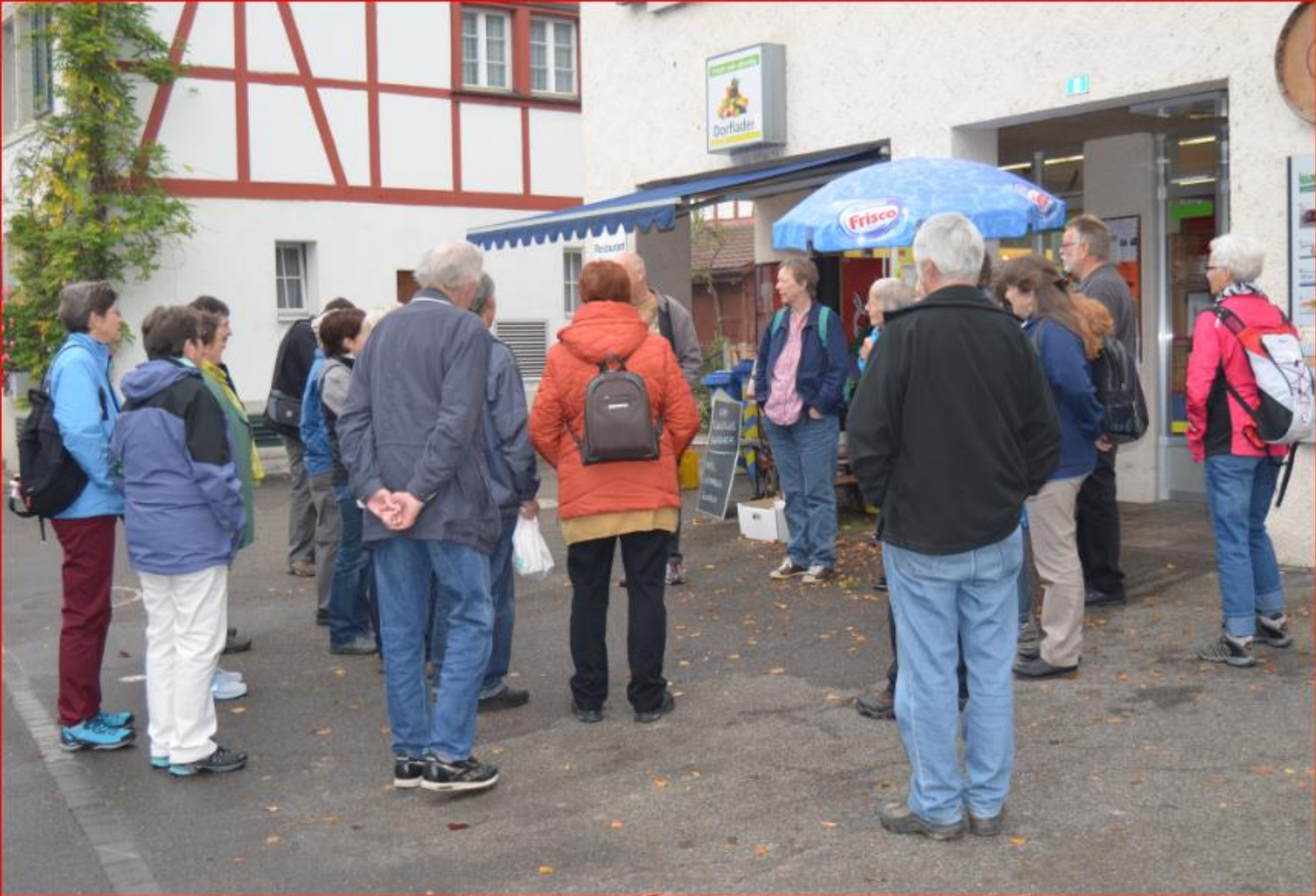
Berg am Irchel - Greifvogelstation 19. Oktober