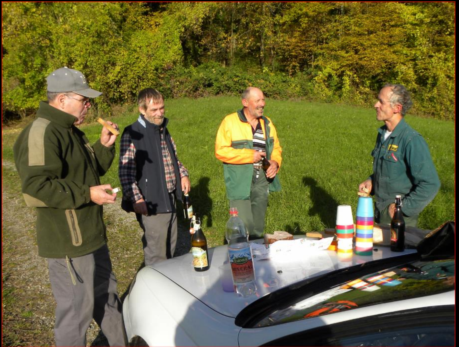
Tannholz 8. November