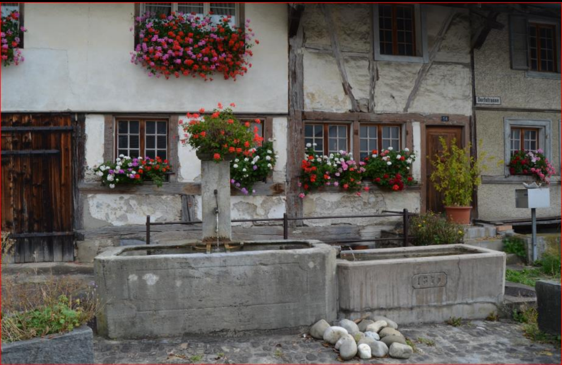
Dorfstrasse 5. Oktober