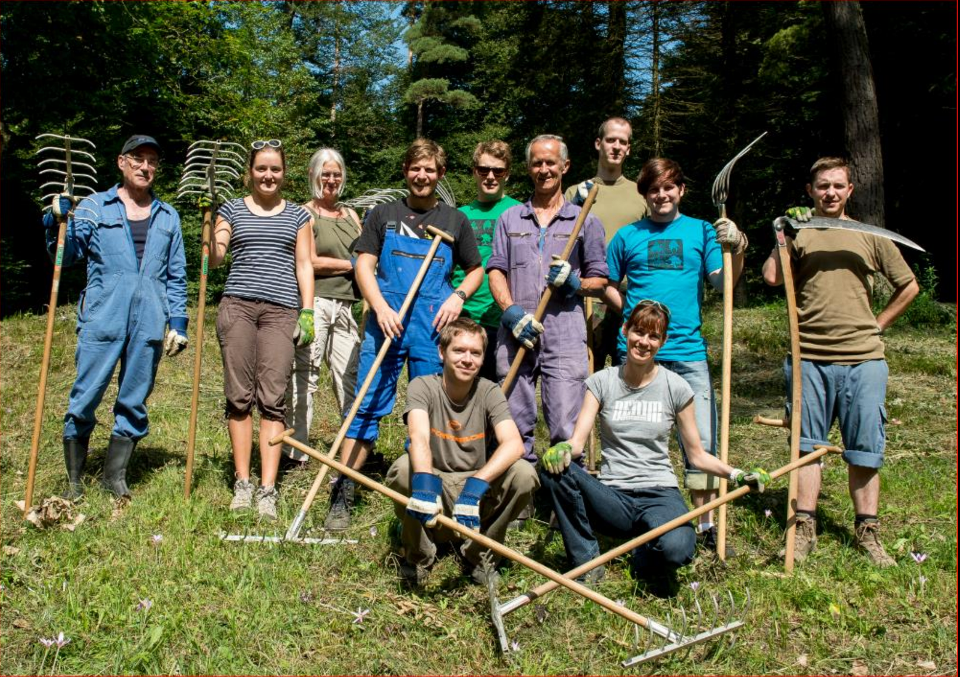
Jungschar mit NVVRF-Verstärkung 6. September