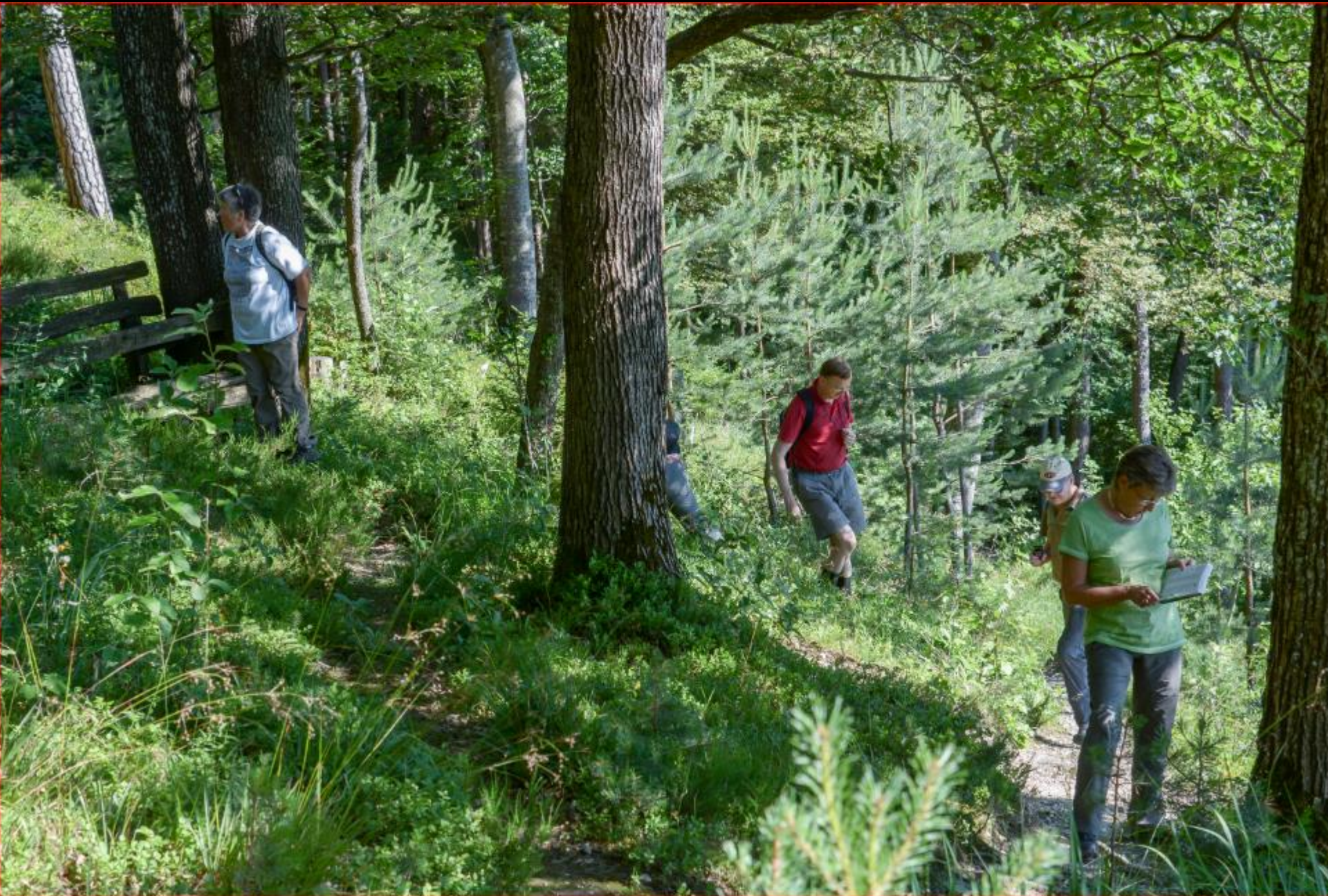
Gruppe Orchideenschutz 21. Juni