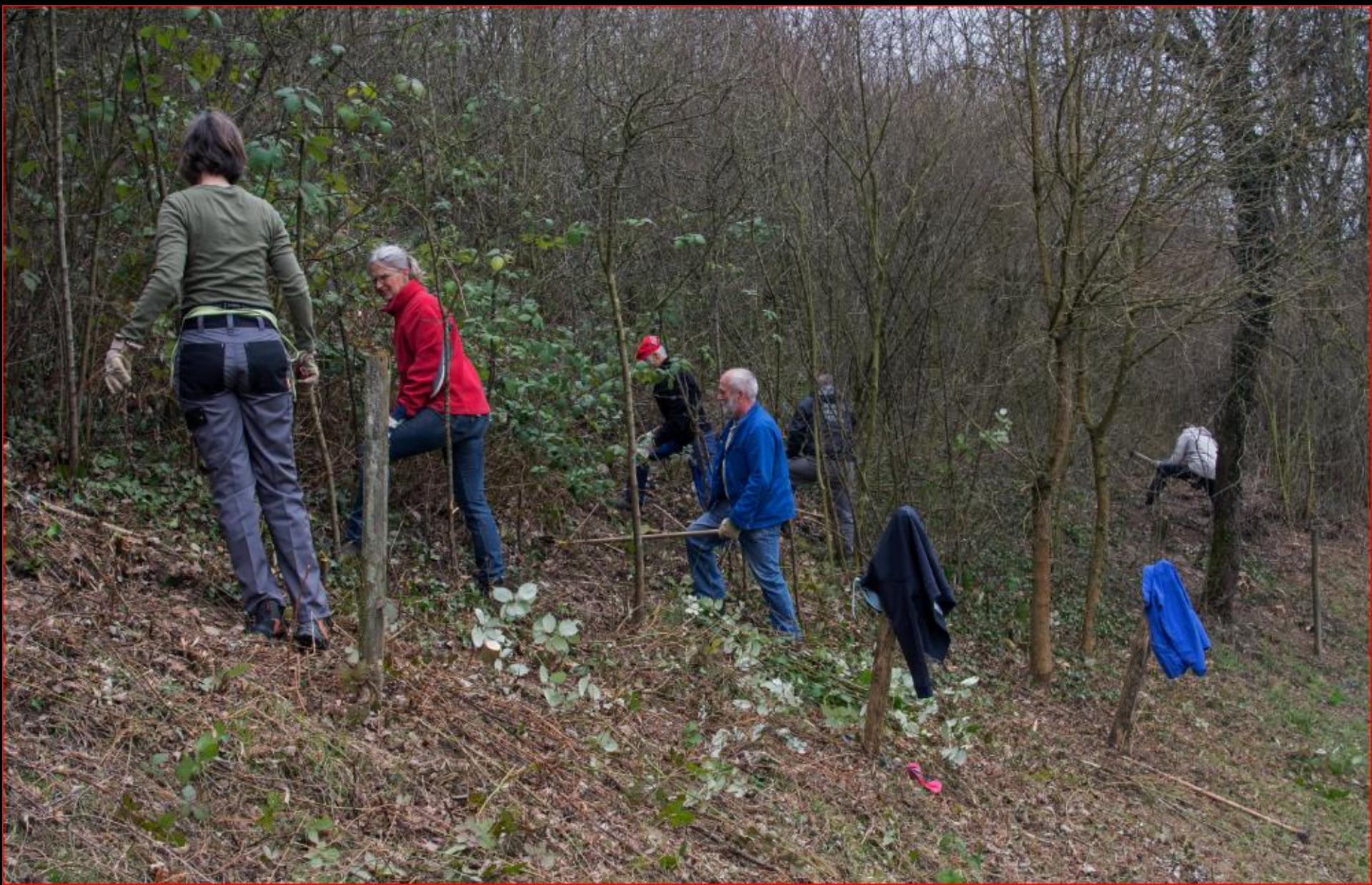
Tannholz 15. März