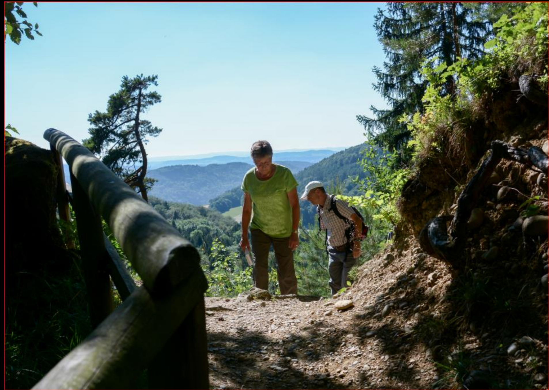
Gruppe Orchideenschutz 21. Juni