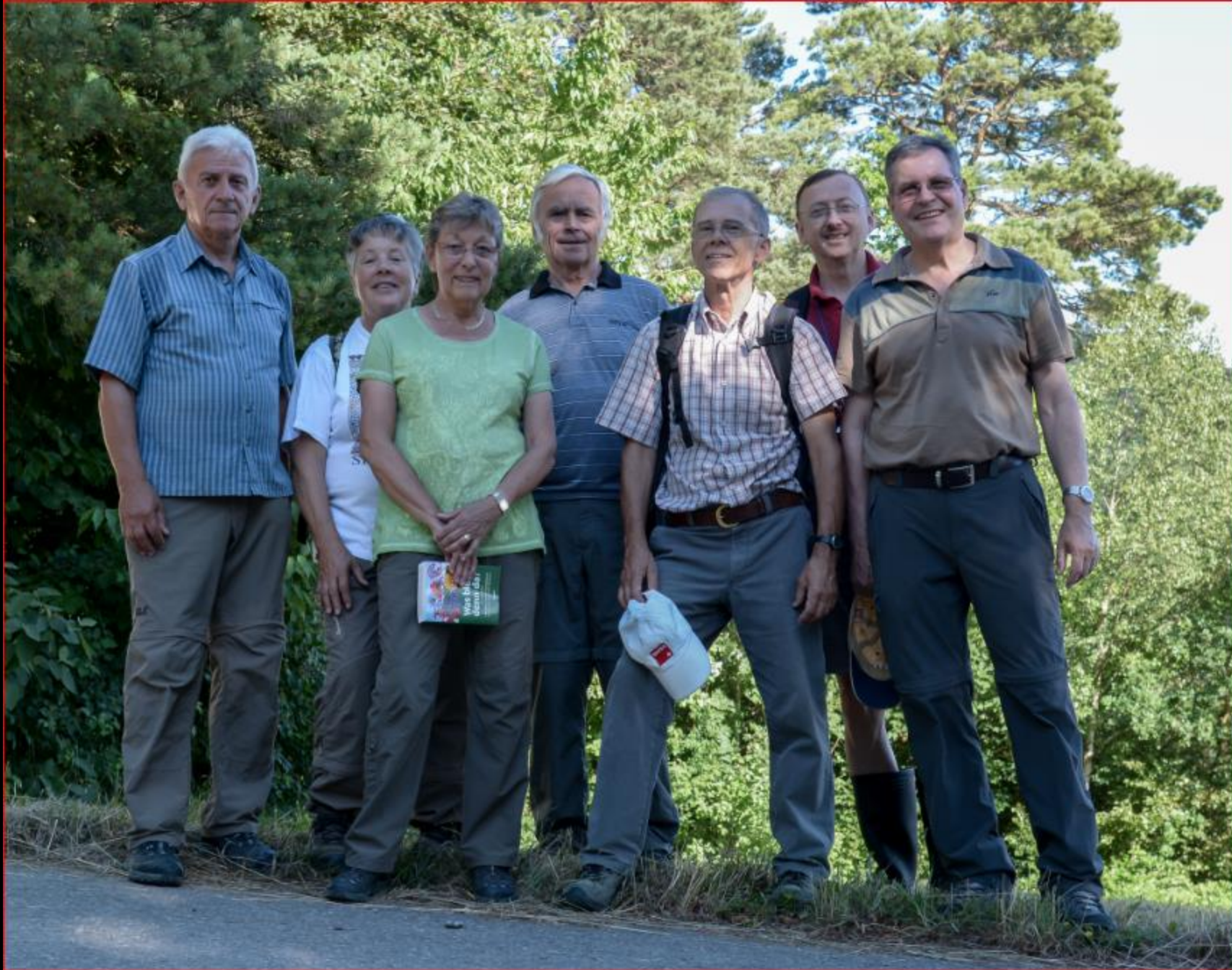
Gruppe Orchideenschutz 21. Juni