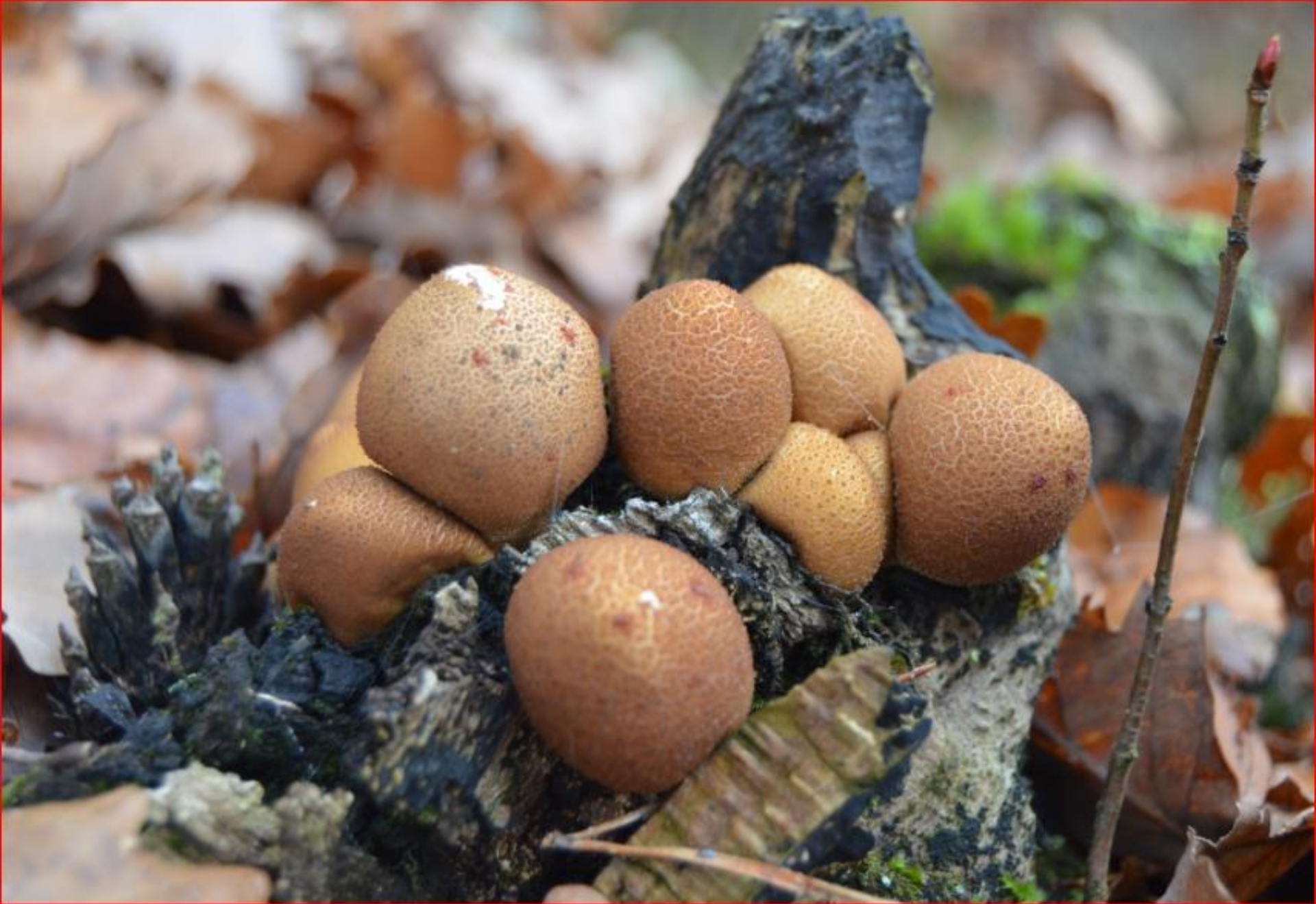
Bovist 23. November