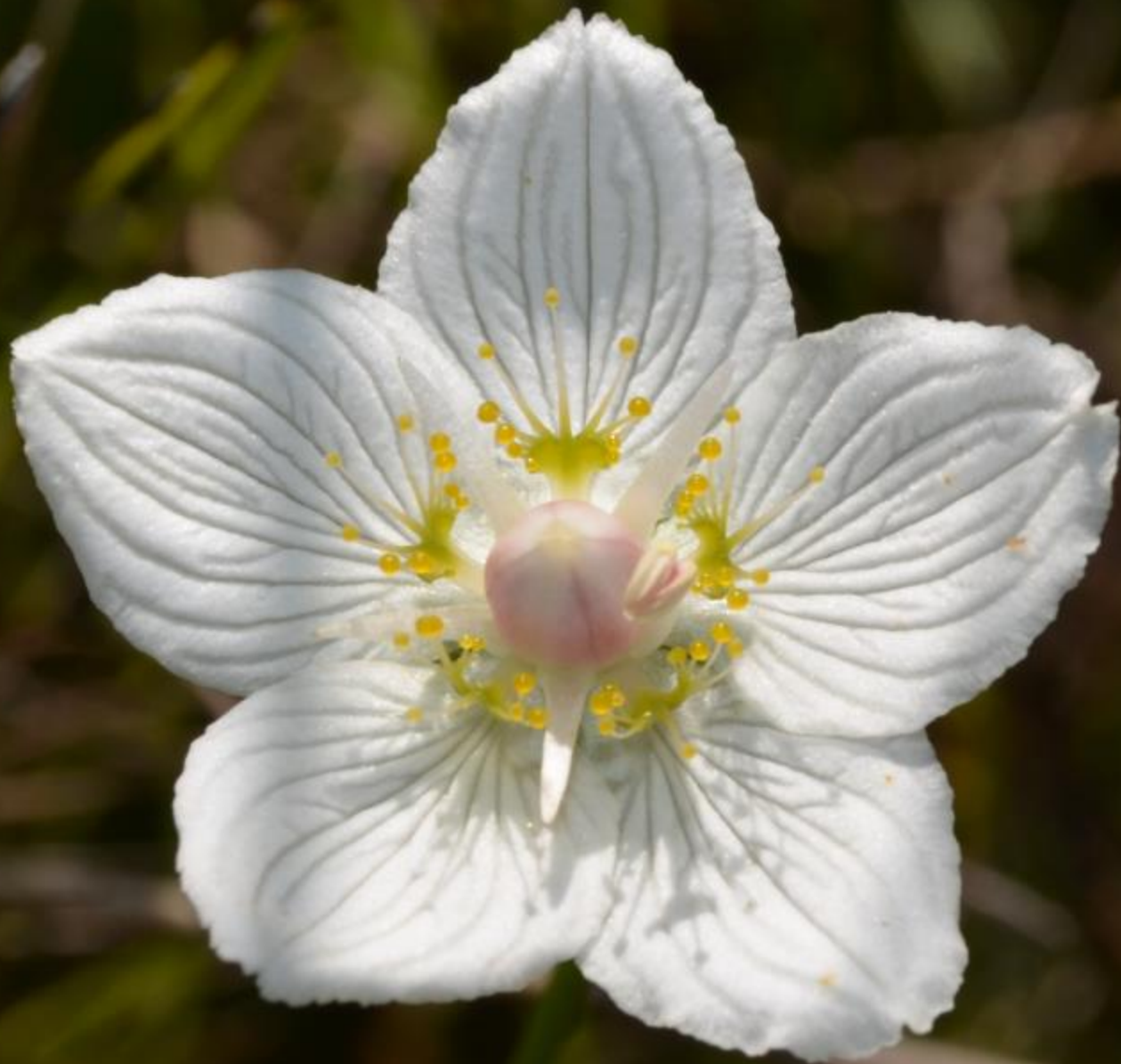
Studentenröschen 23. September