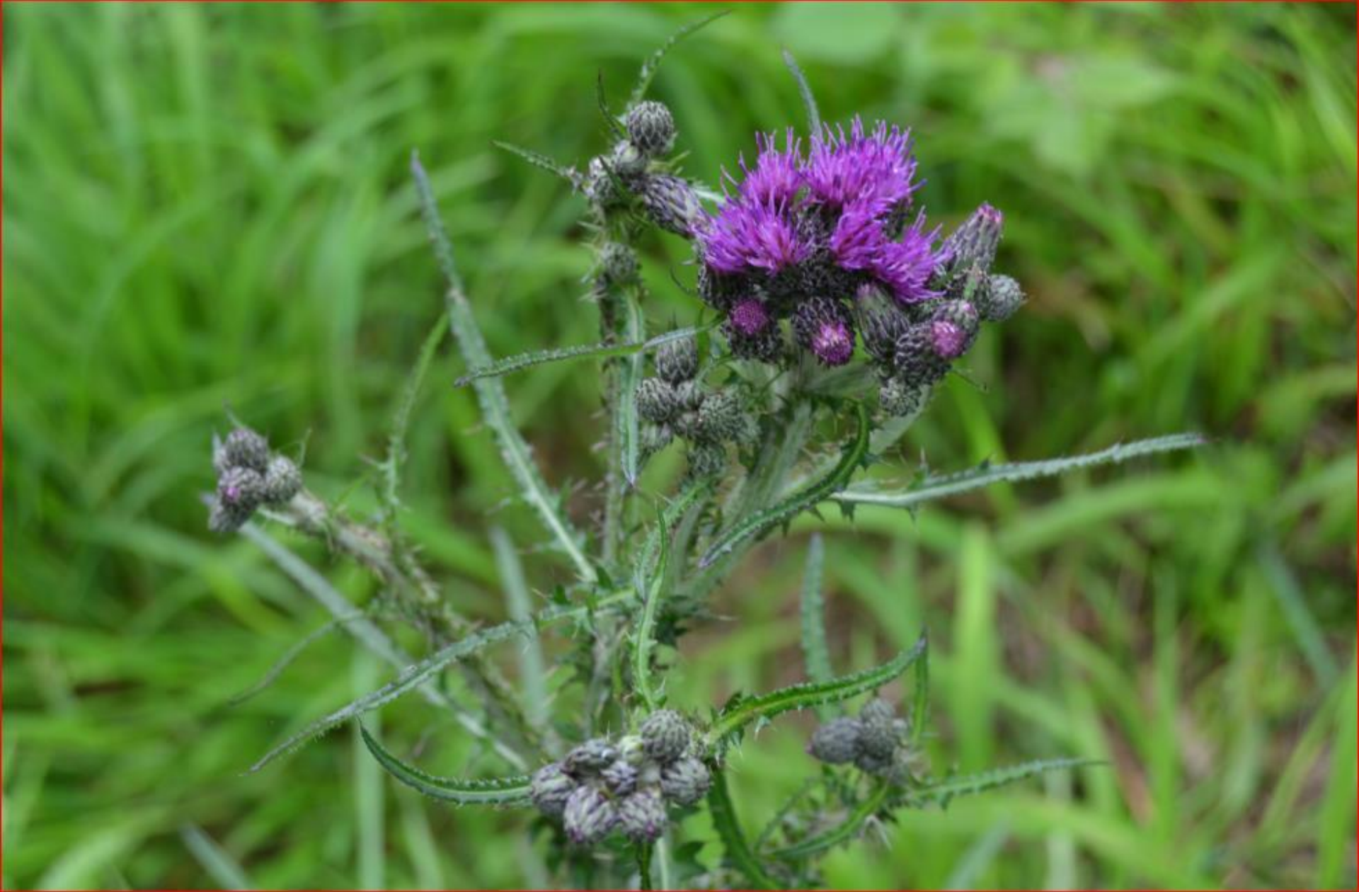
Sumpf-Kratzdistel 22. Mai