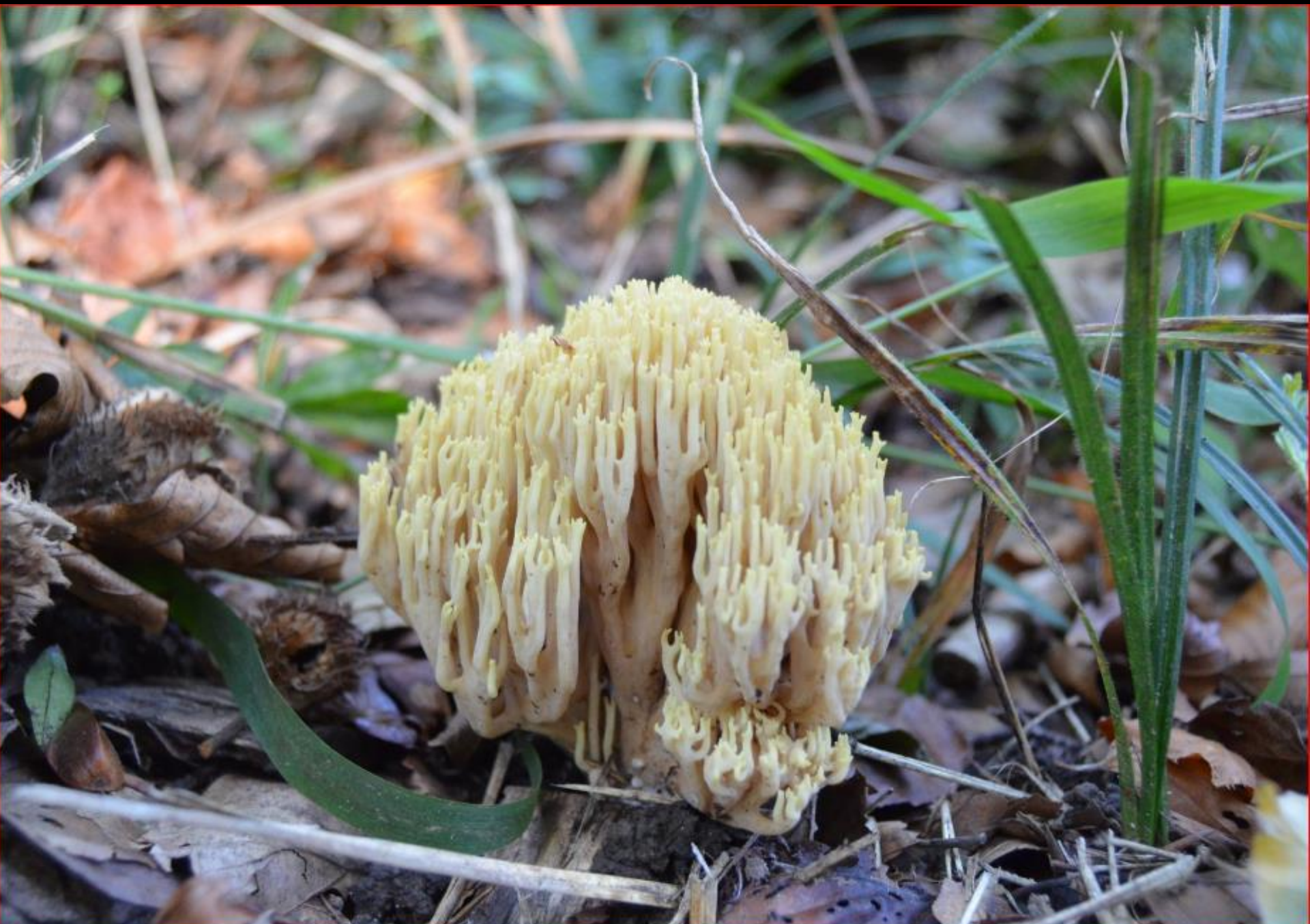
Geissbart – kleiner Korallenbusch 23. September