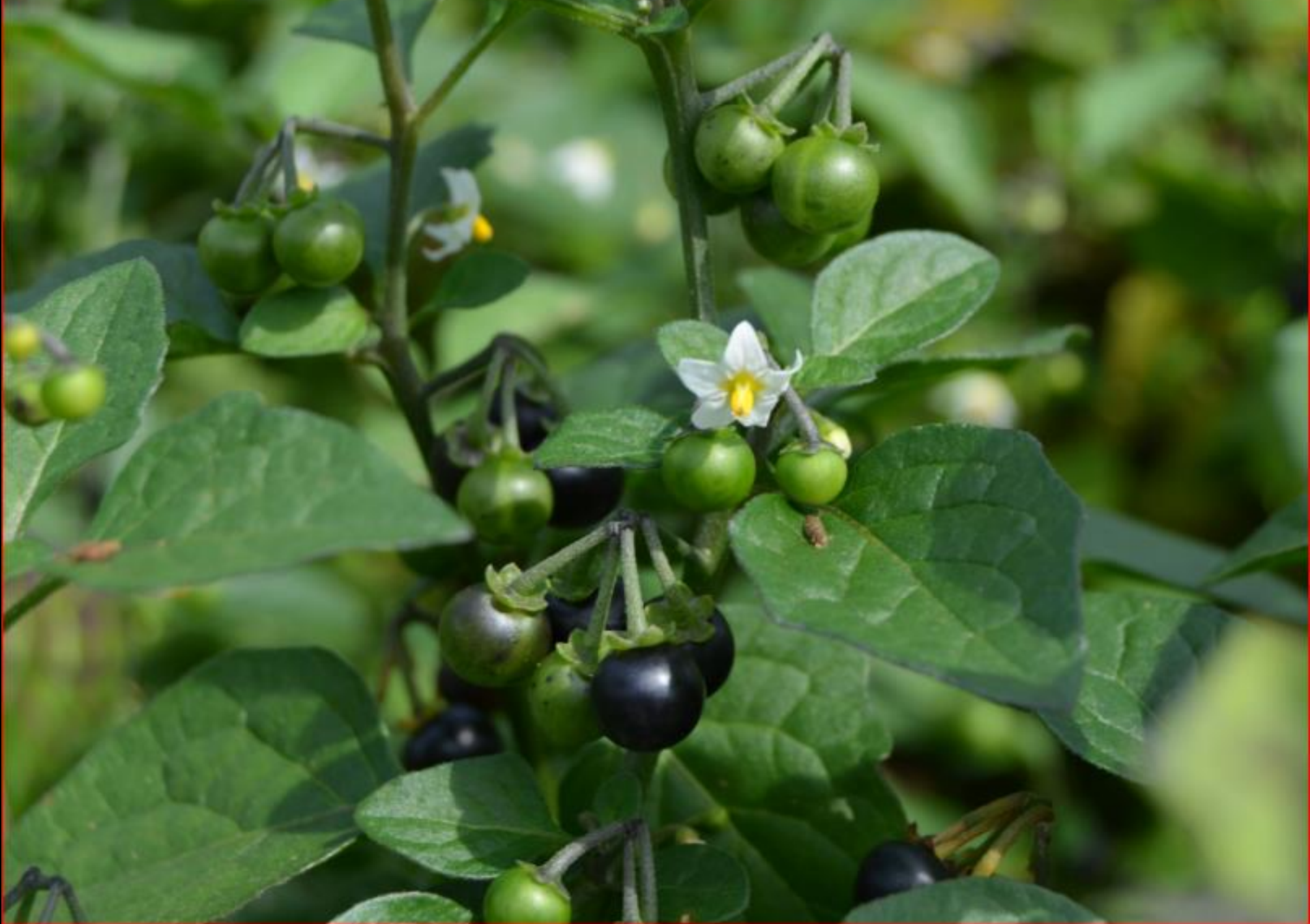
Schwarzer Nachtschatten 5. Oktober