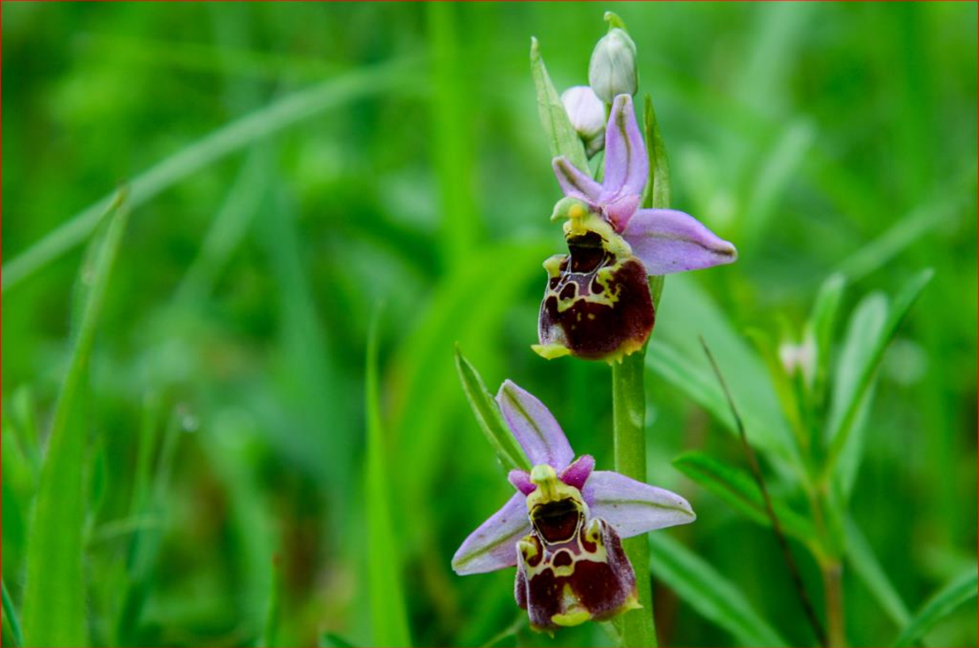
Hummel-Ragwurz 3. Mai