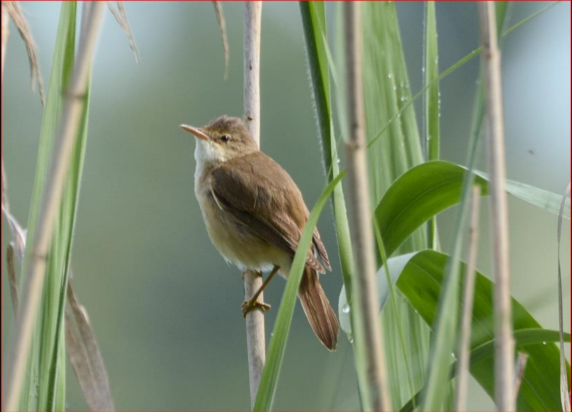
Sumpfrohrsänger 6. Juli