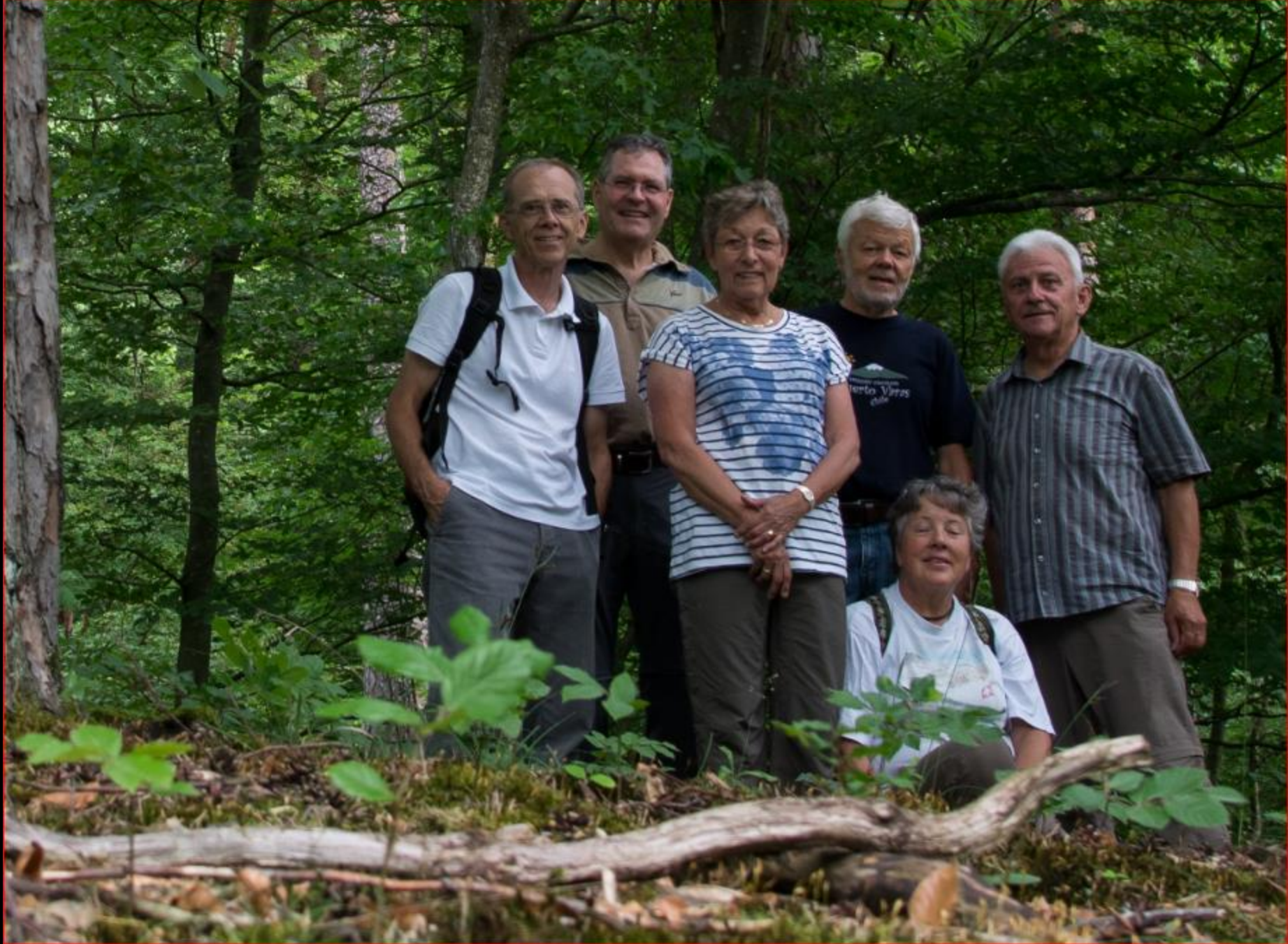
Gruppe Orchideenschutz 14. Juni