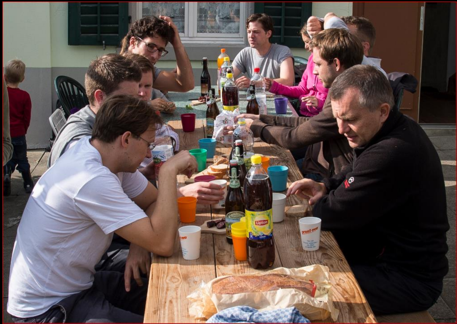
UBS-Team-Einsatz - Auenriet 3. September