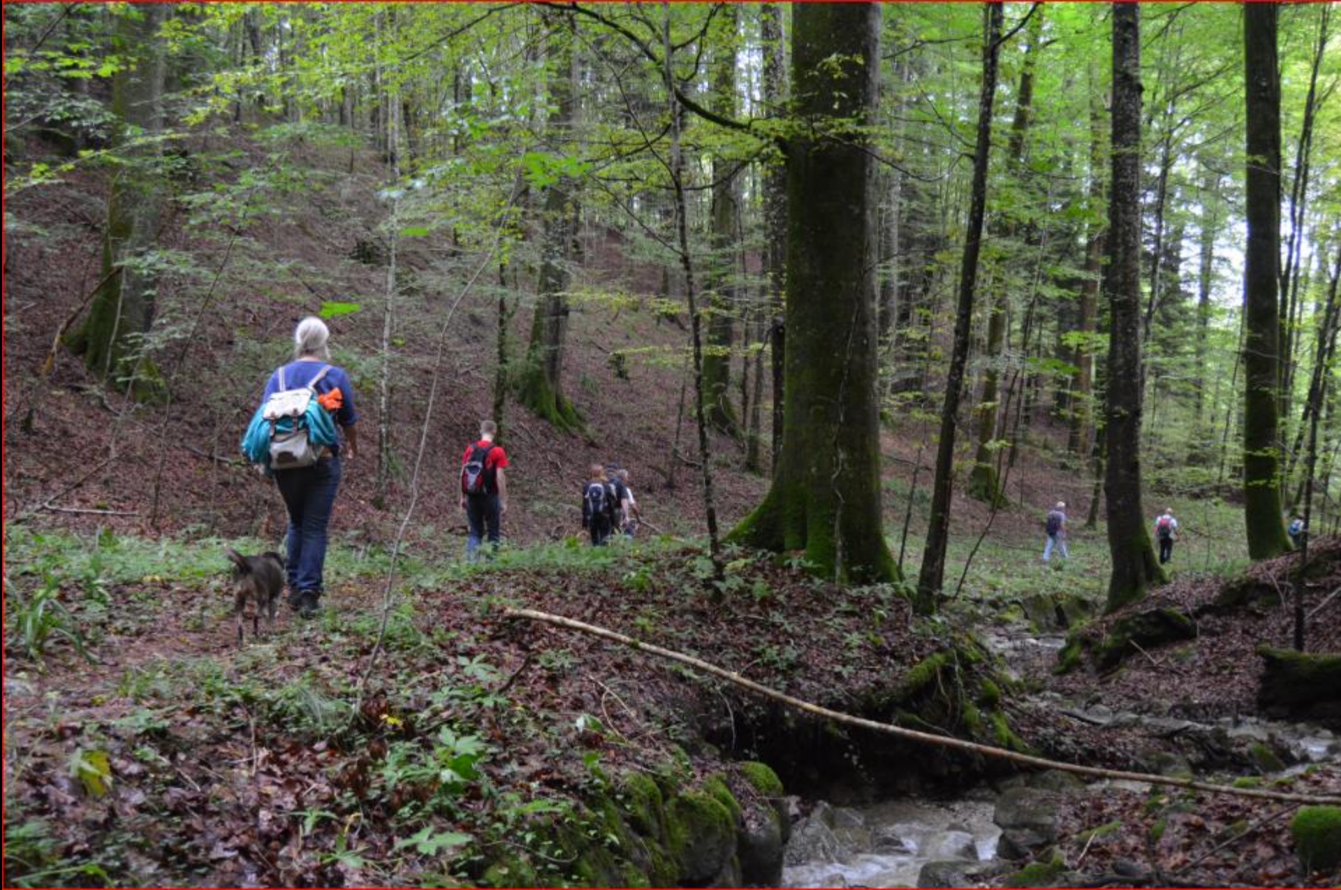
Ausflug Gruppe Naturschutz – im Sihlwald 12. Juli