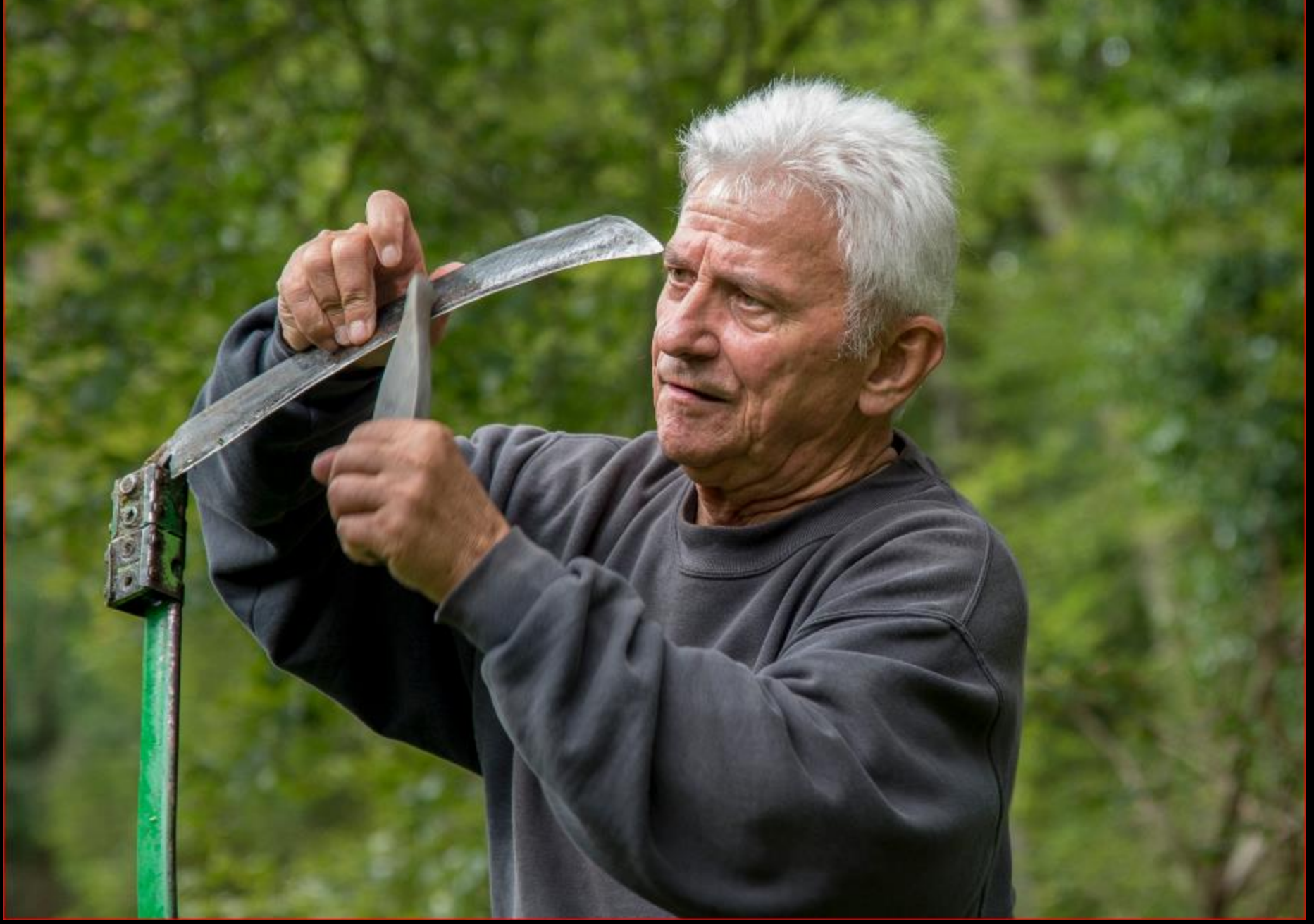
UBS-Team-Einsatz - Auenriet 3. September