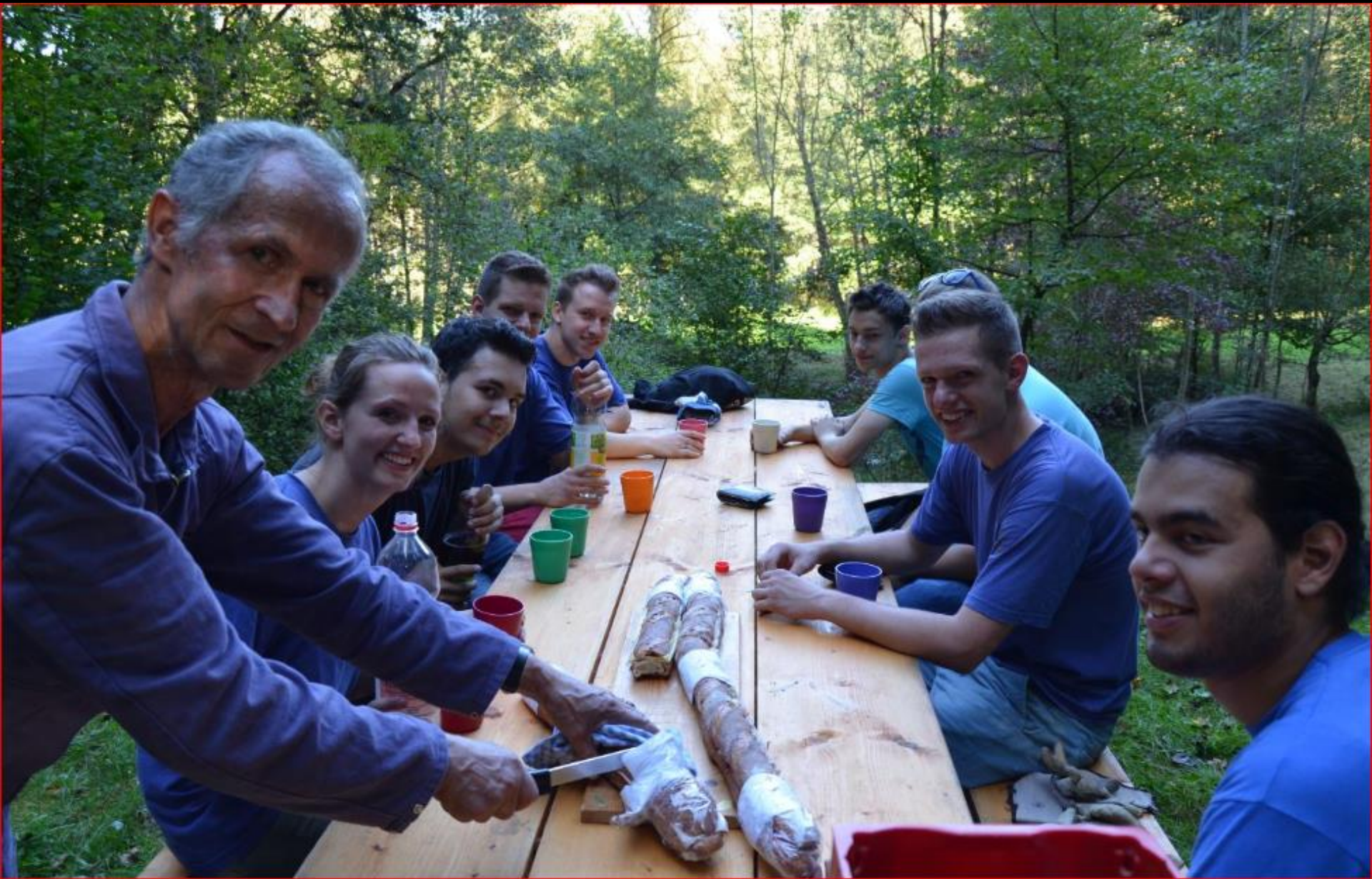
JUBLA im Auenriet 27. September