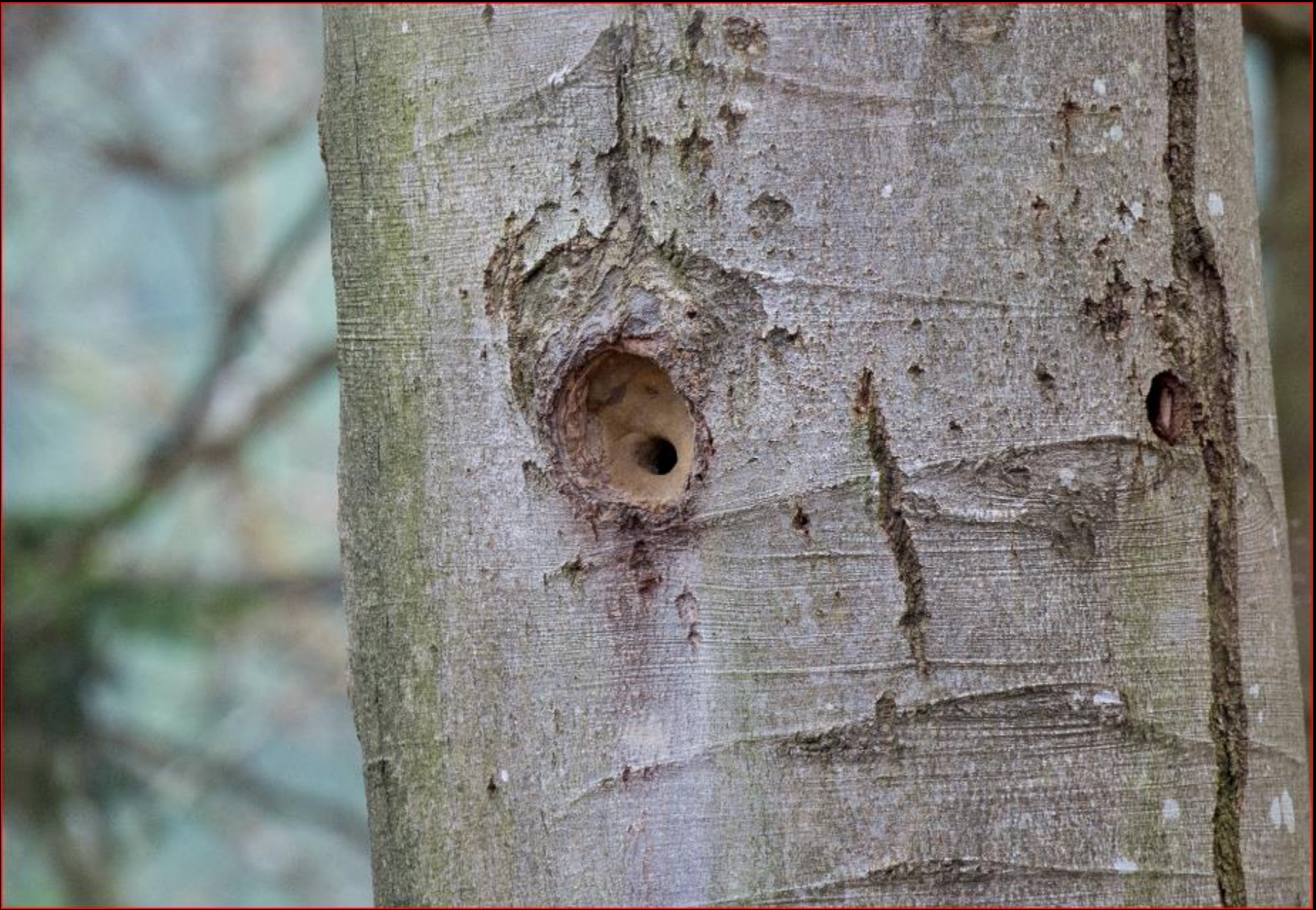
Kleiber in Spechthöhle, 26. März