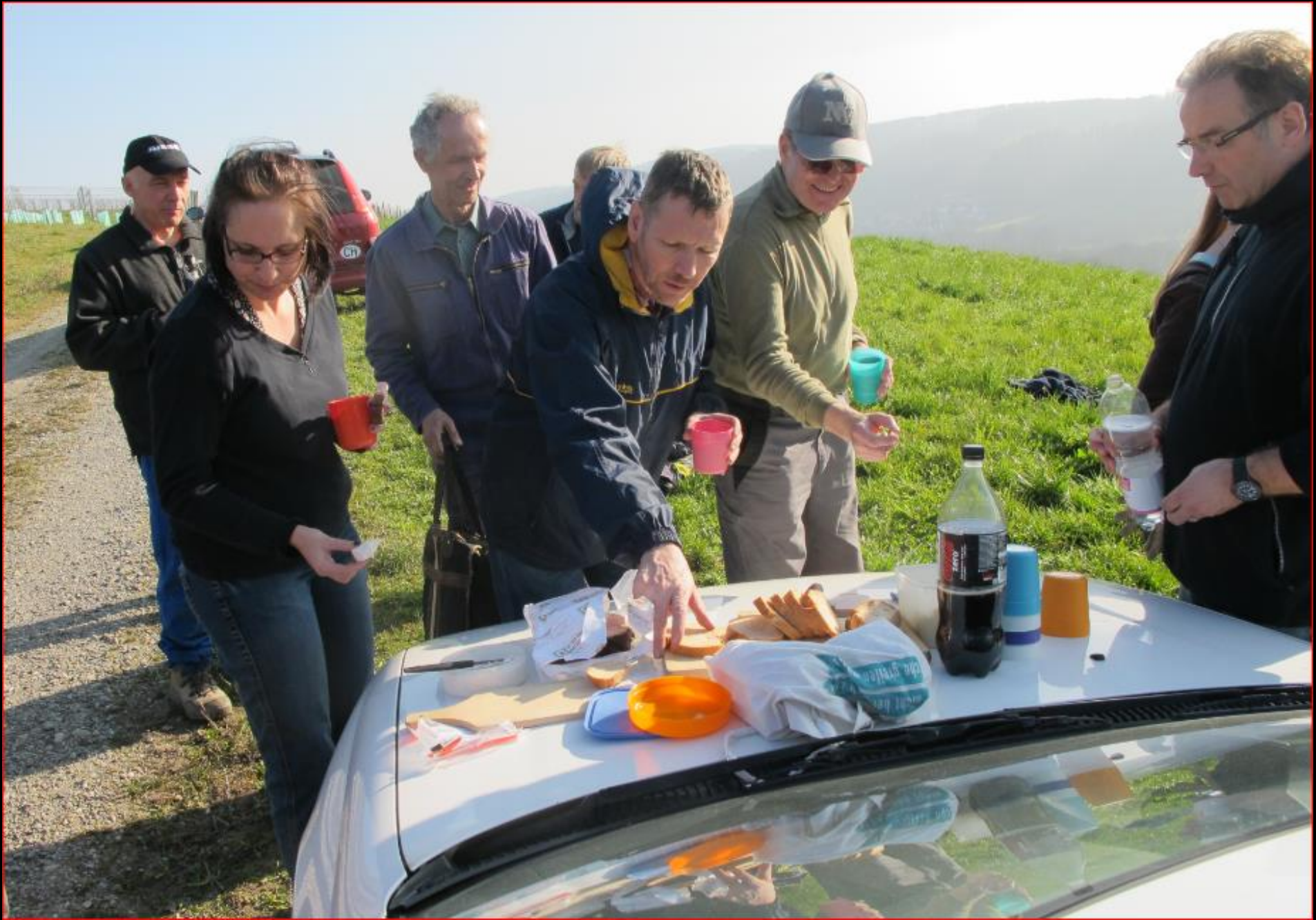
Teufen 8. März