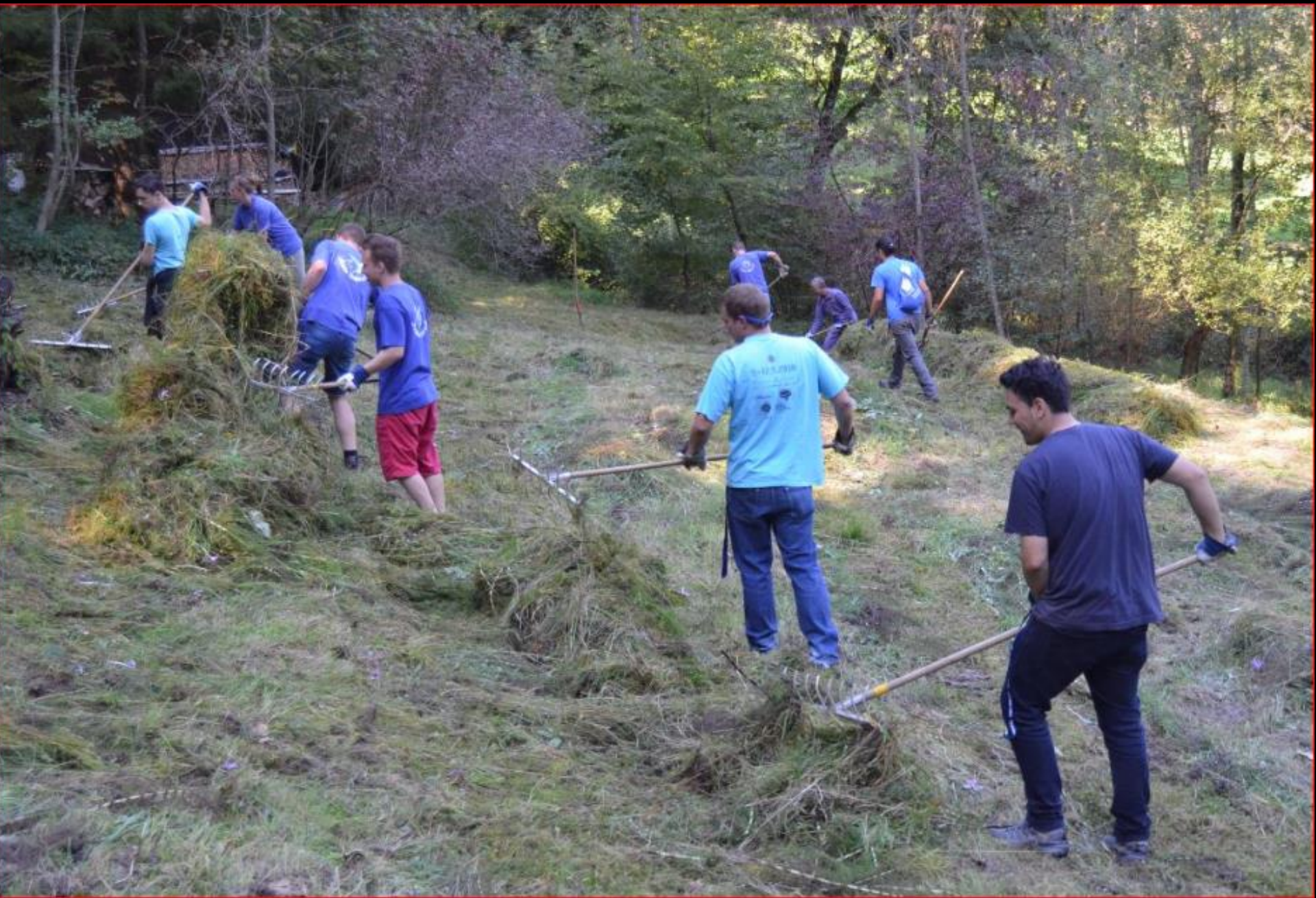
JUBLA im Auenriet 27. September