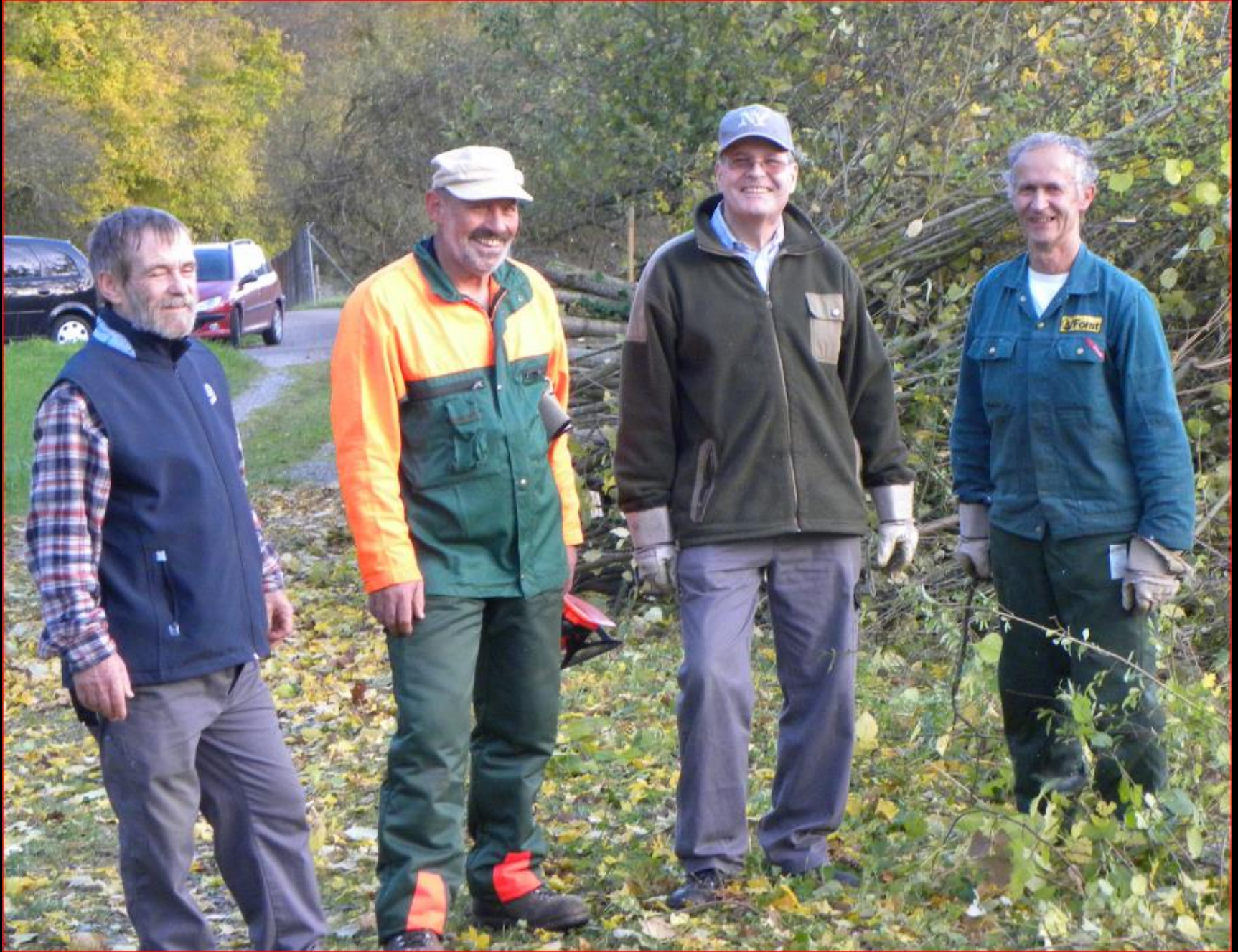
Tannholz 8. November