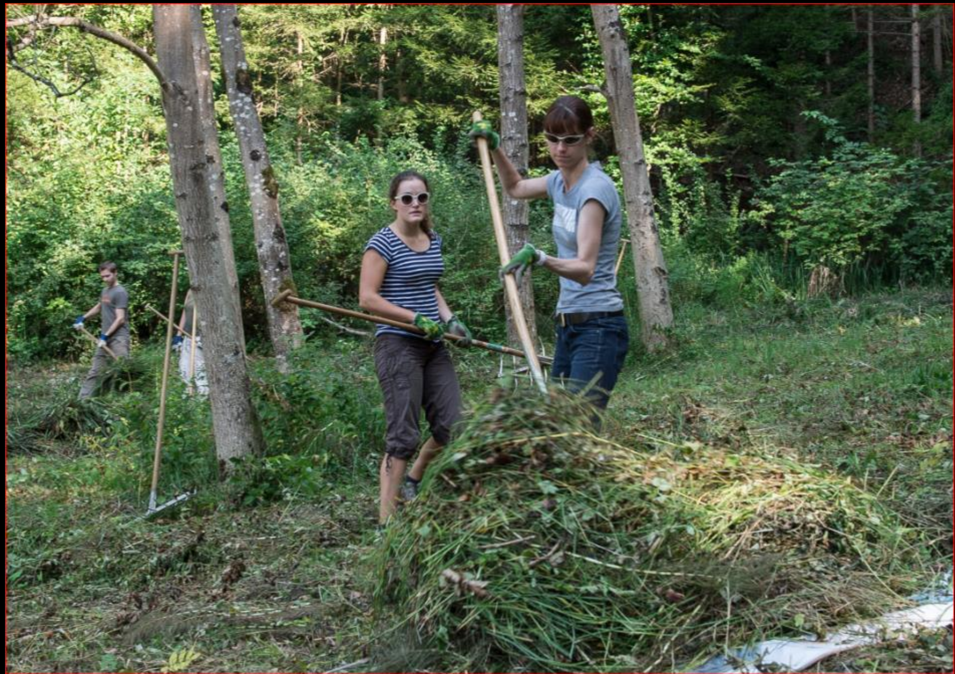
Jungschar mit NVVRFT-Verstärkung 6. September