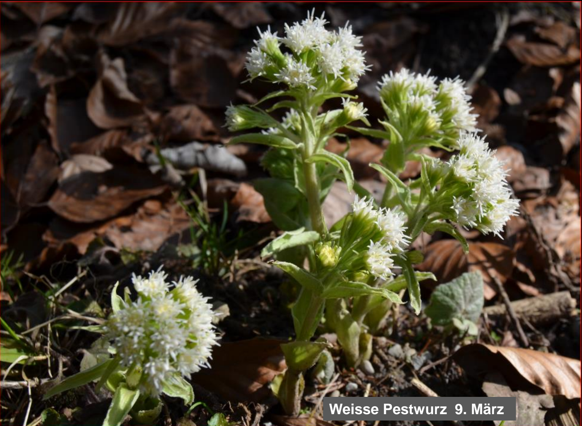
Weisse Pestwurz 9. März