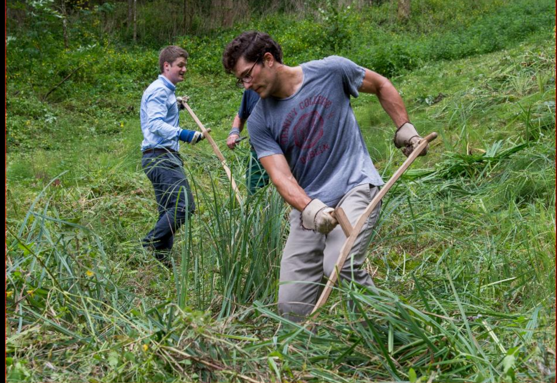
UBS-Team-Einsatz - Auenriet 3. September