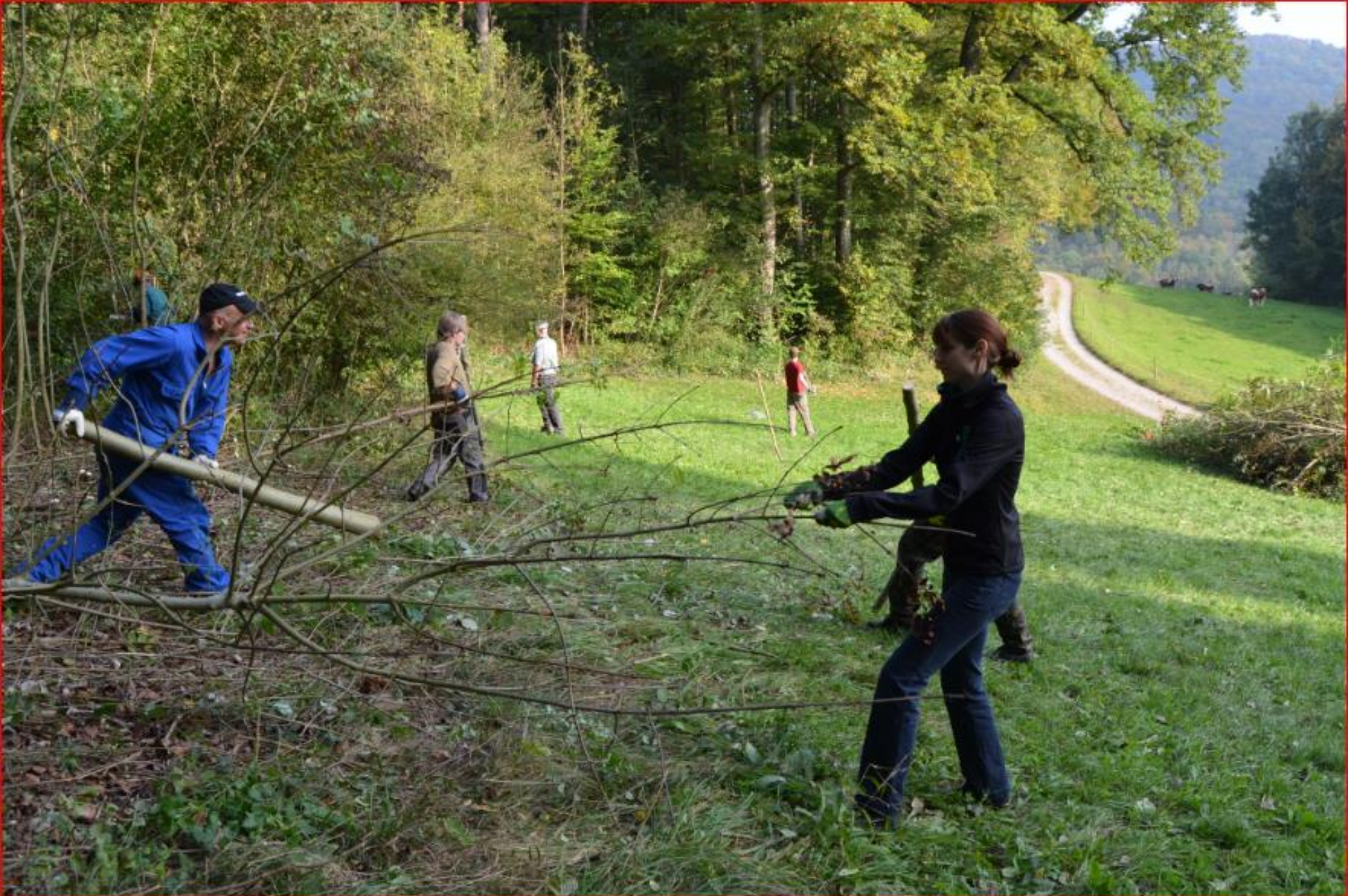
Oberteufen 4. Oktober