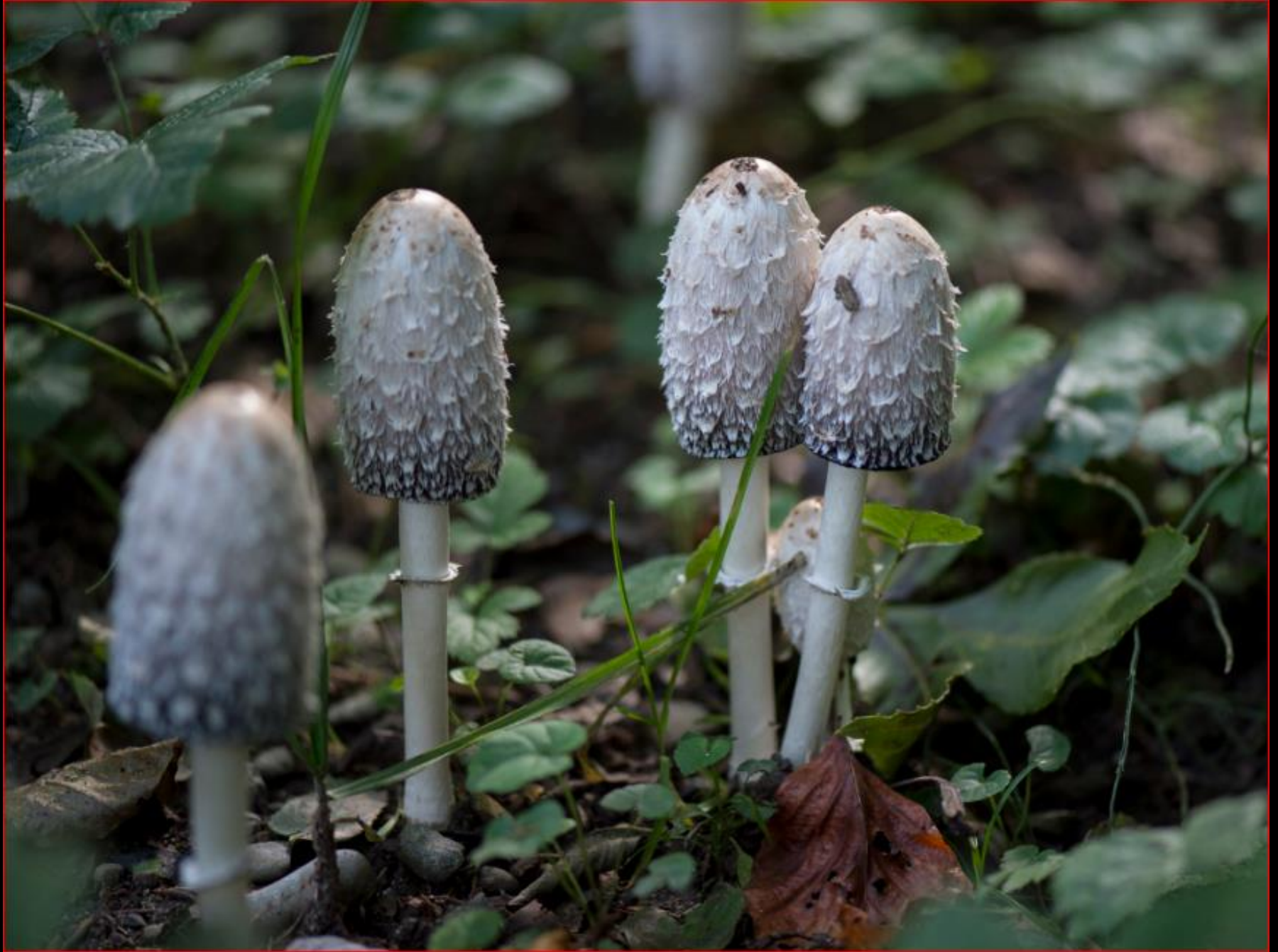
Schopftintling 7. September