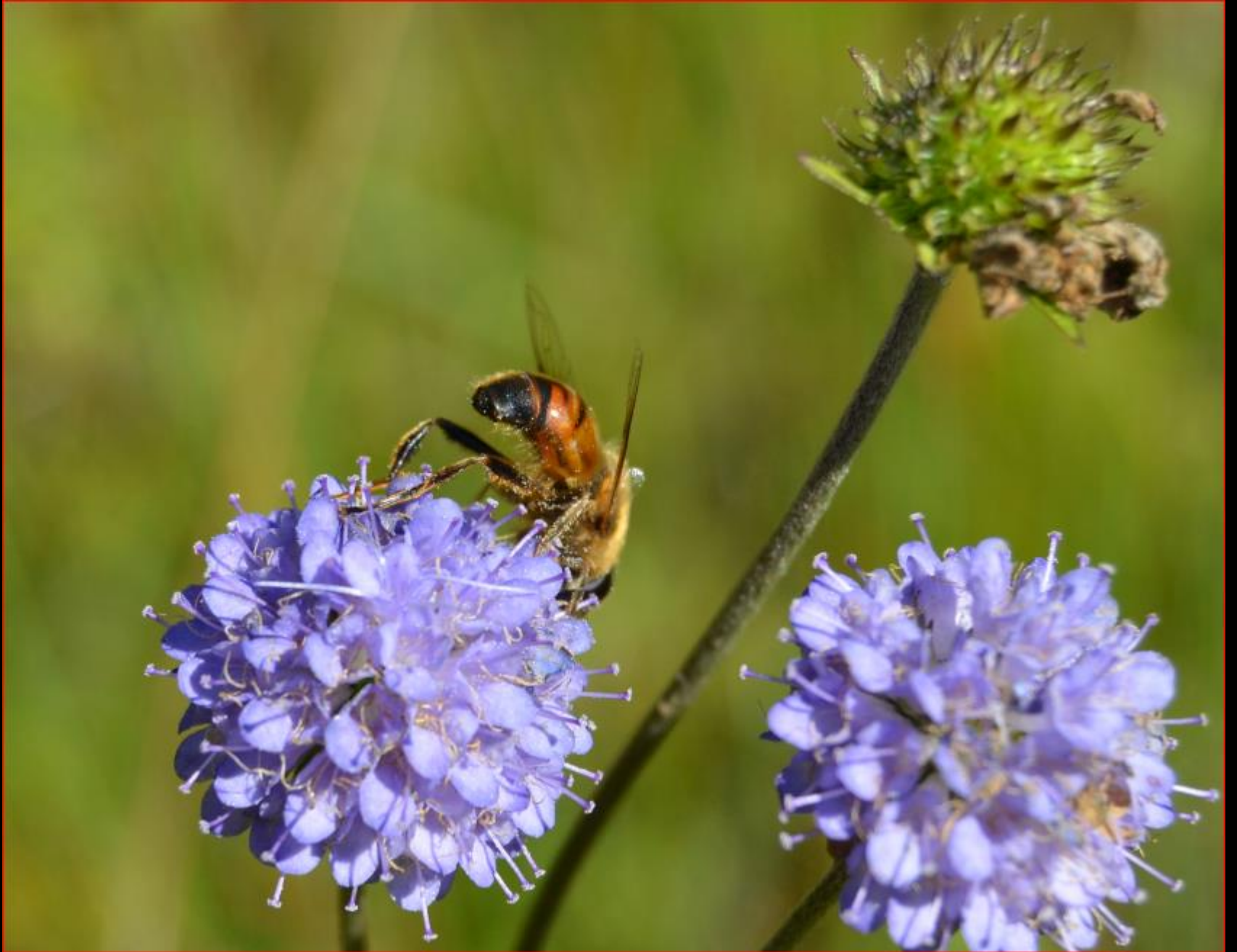
Abbisskraut 23. September