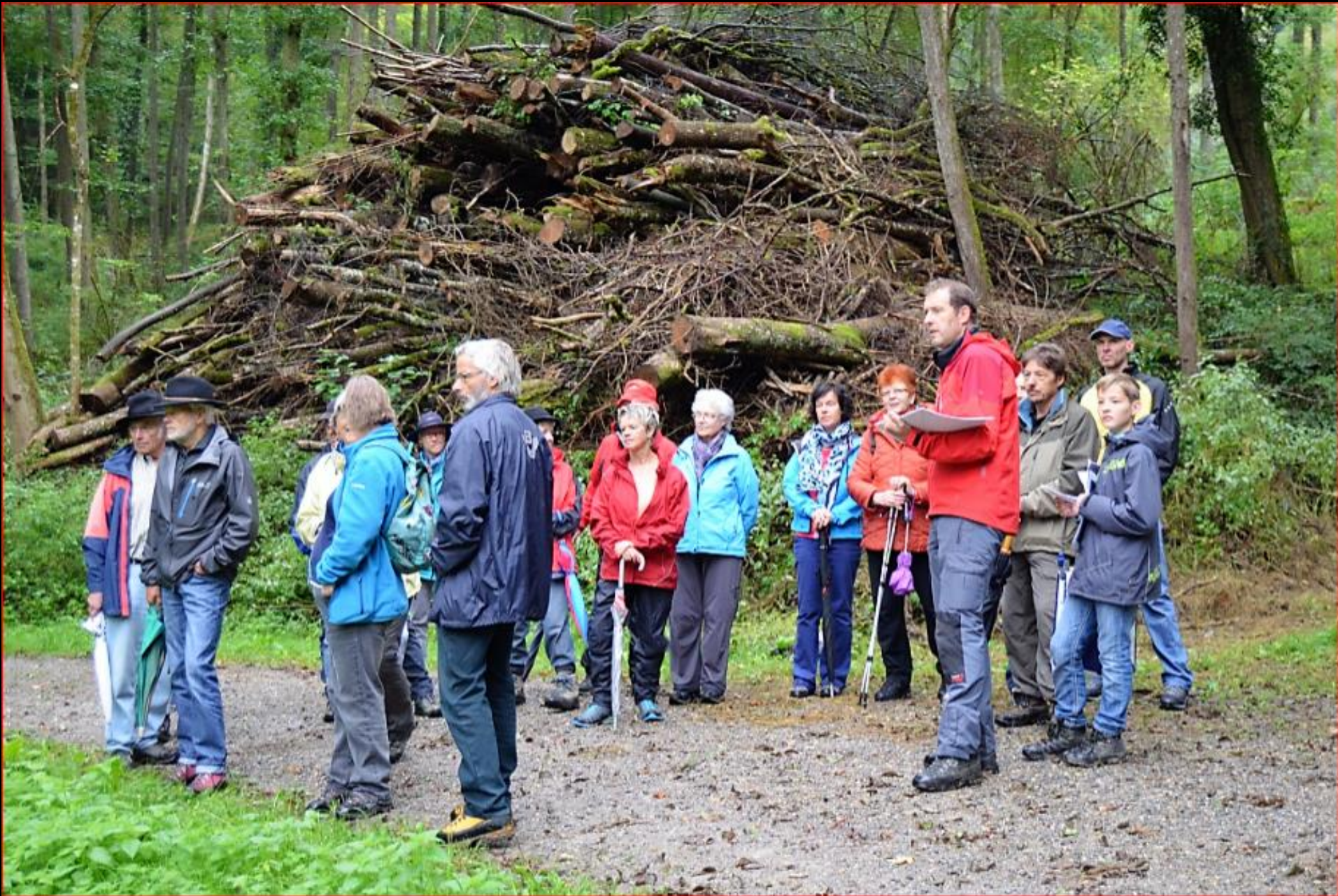
Exkursion Kaiserbuck 18. September