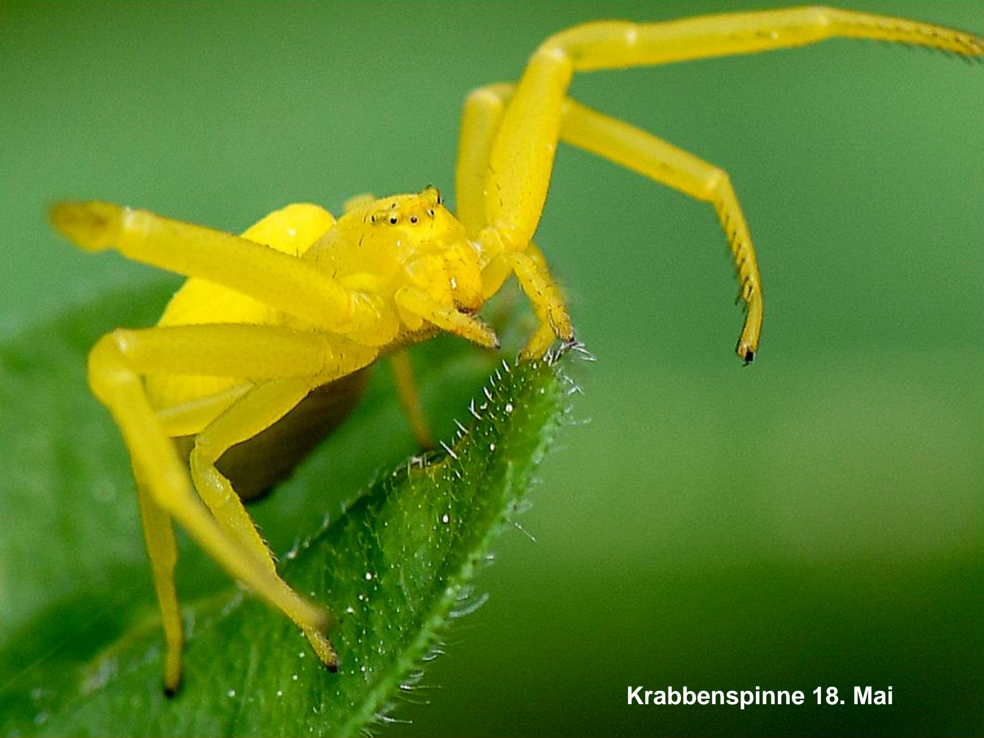
Krabbspinne 18. Mai