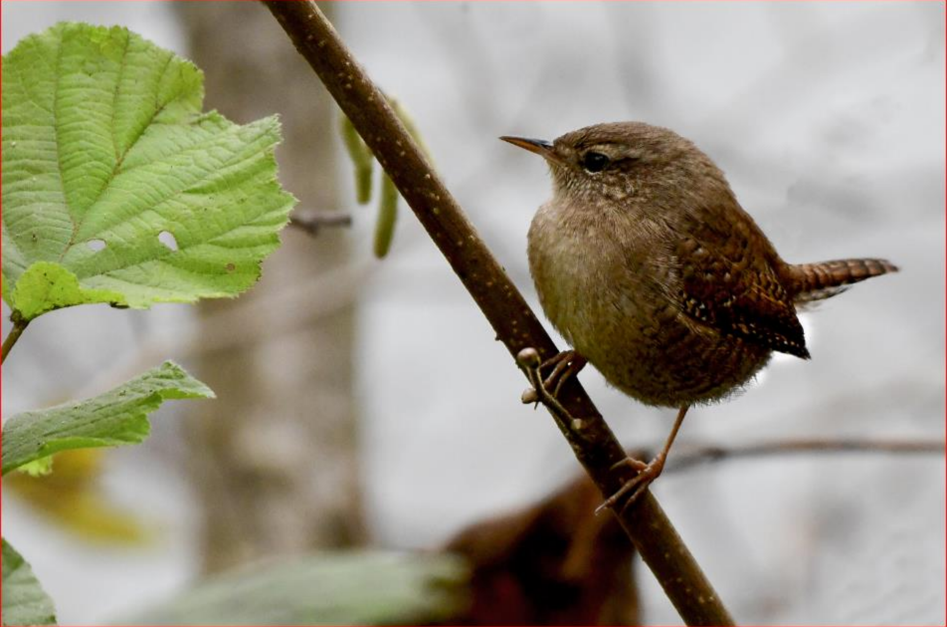
Zaunkönig 14. November