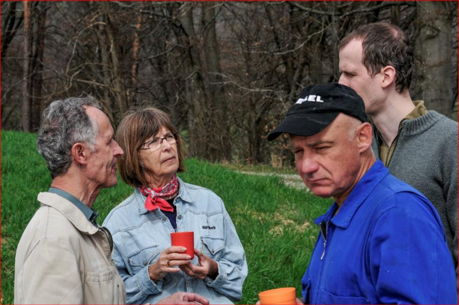
Oberteufen 2. April