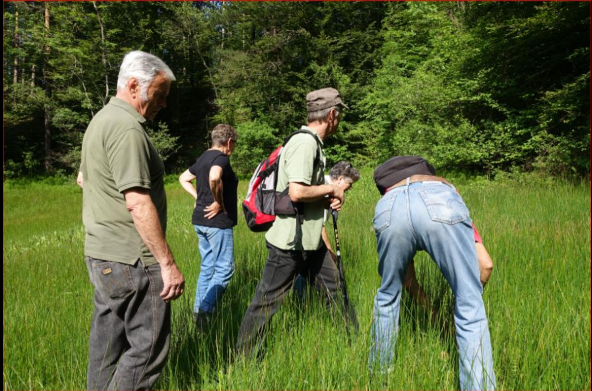
Orchideen-Gruppe Kurz-Exkursion Stockrüti 30. Mai