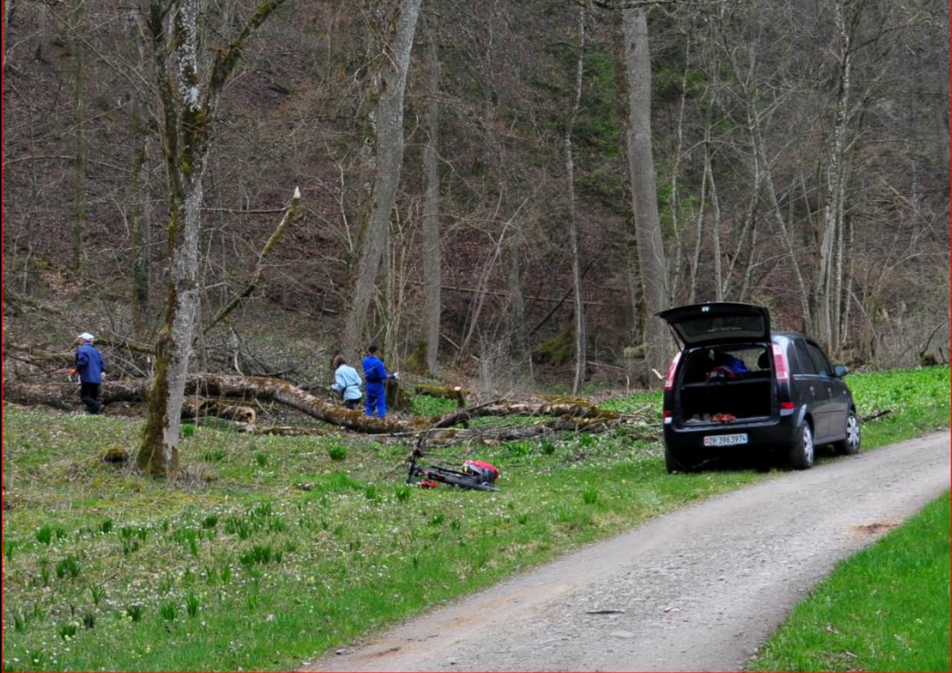
Rorbas Loch 2. April