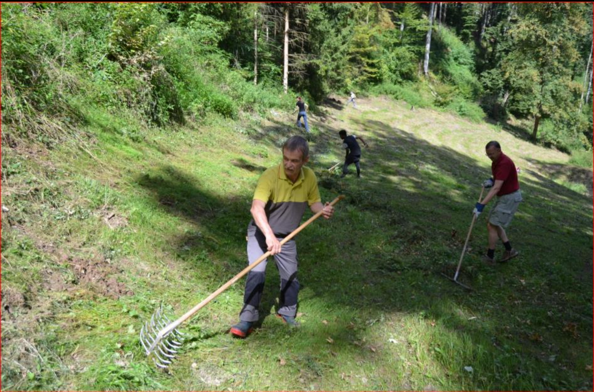
Kaiserbuck 3. September