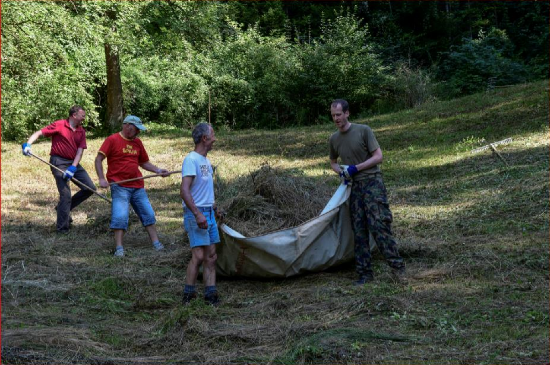
Usser Tobel / Buechen 10. September