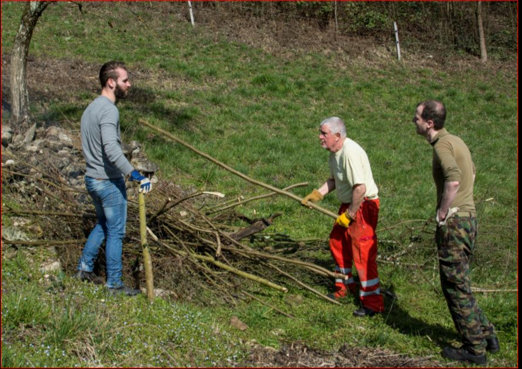
Tannholz 19. März