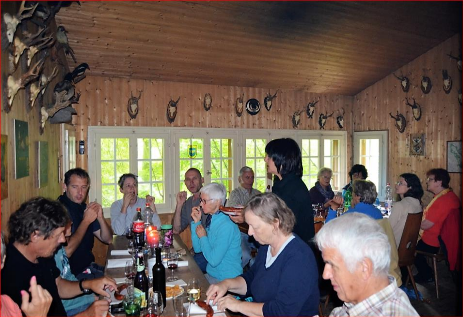
Exkursion Kaiserbuck / Auenriet 18. September