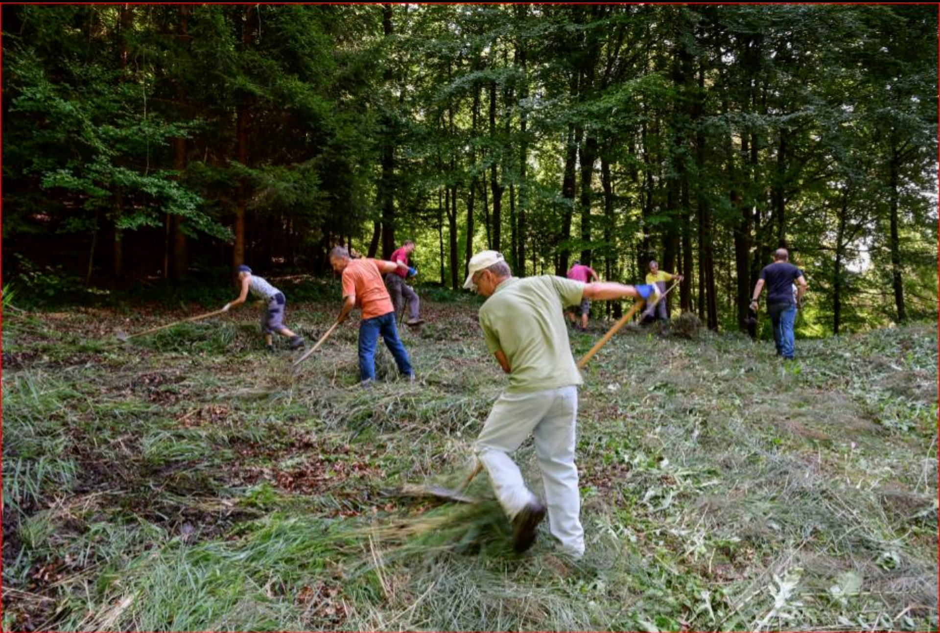
Sibilenrain 10. September