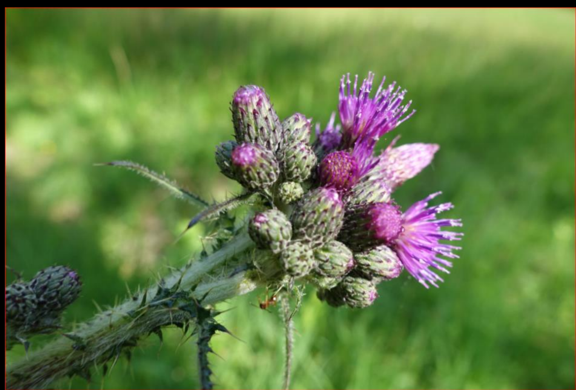
Sumpf-Kratzdistel Stockrüti 30. Mai