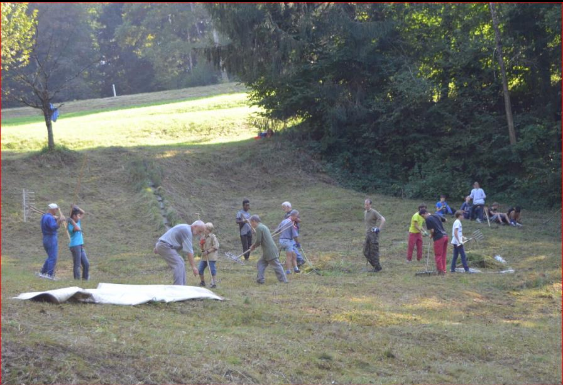
Chli Rüteli mit Pfadi 24. September