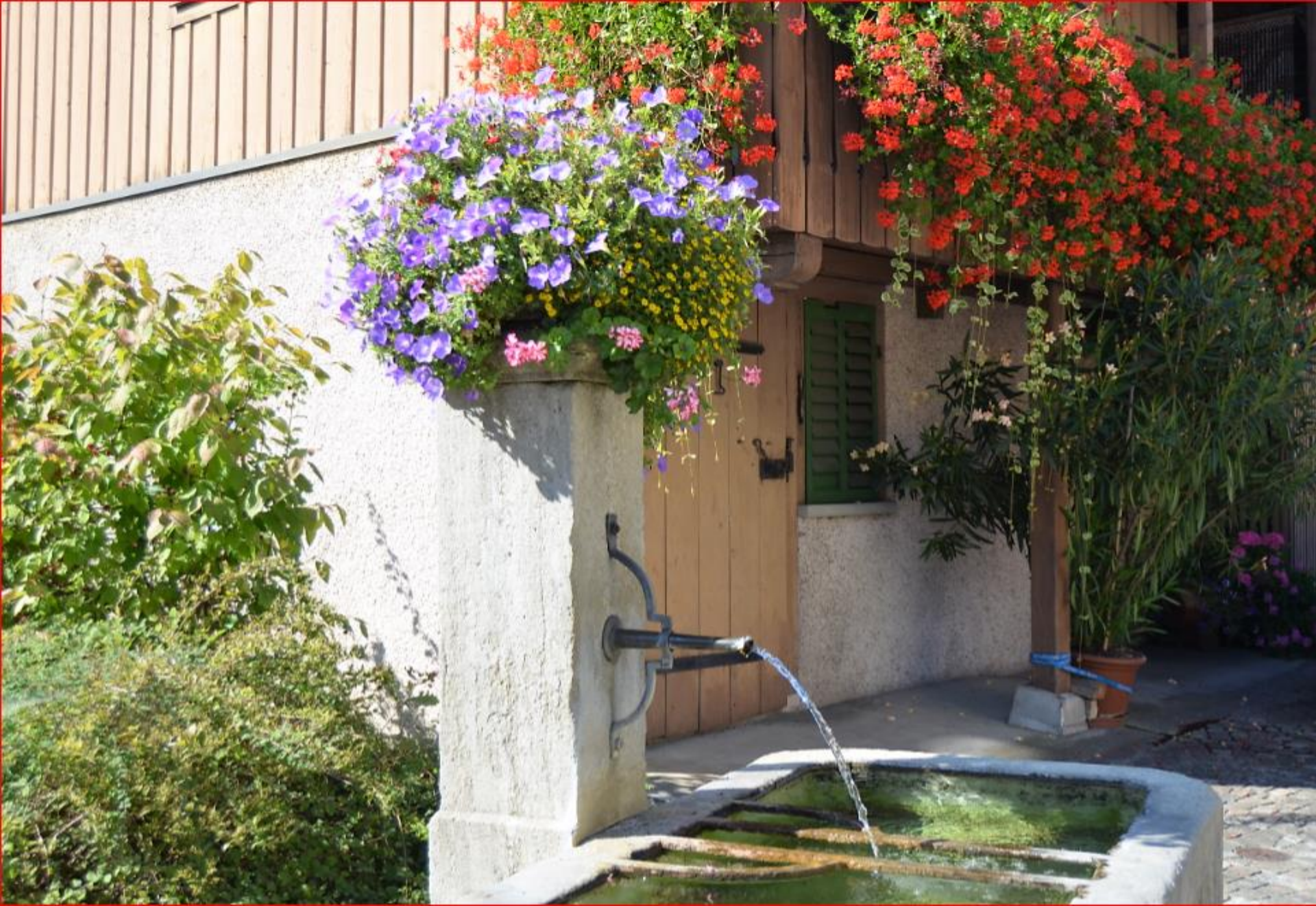
Gupfe 25. September