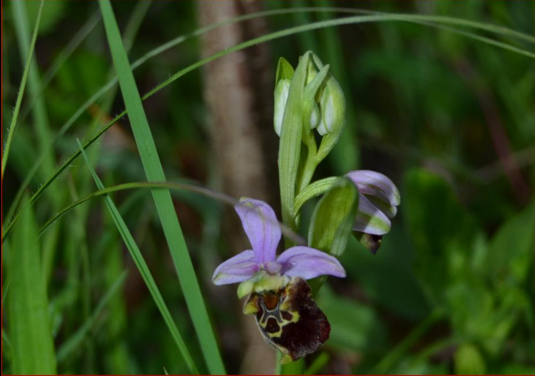
Hummel-Ragwurz 3. Mai