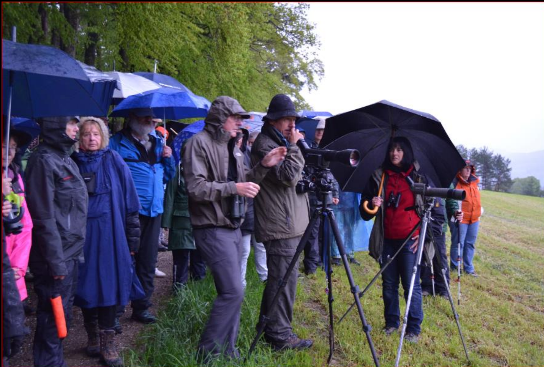
Waldkauz-Exkursion mit BirdLife ZH, 23. April