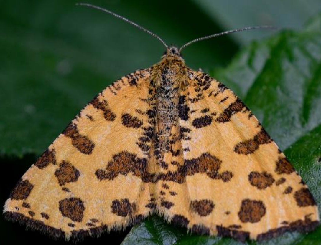
Falter 16. Mai