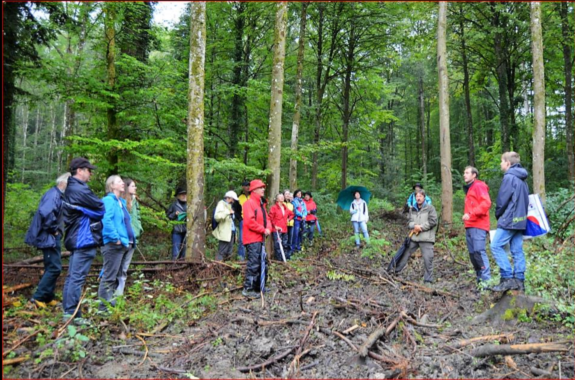
Exkursion Kaiserbuck / Auenriet 18. September