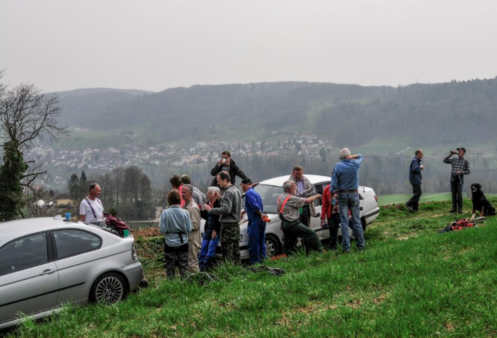
Oberteufen 2. April