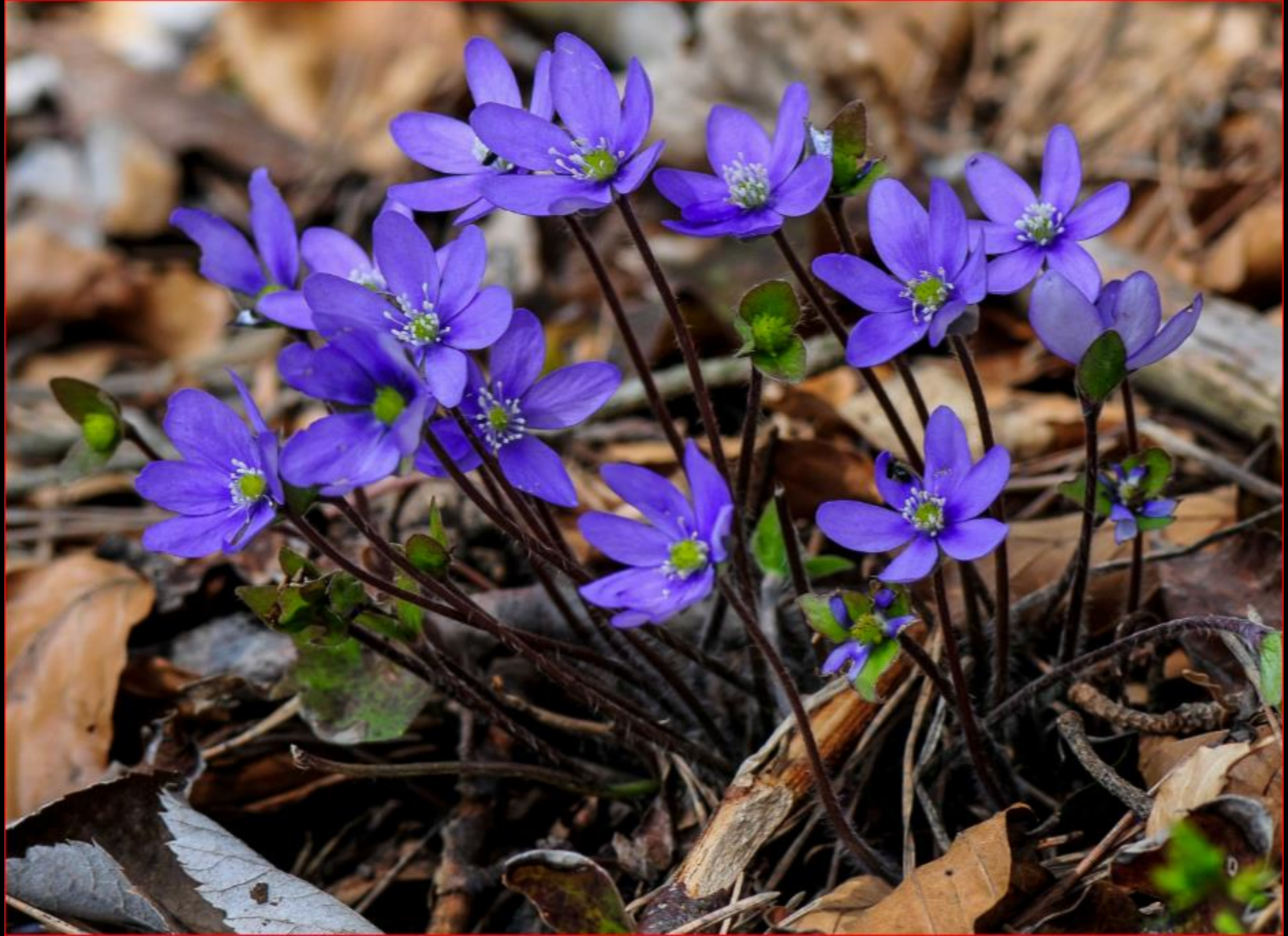
Leberblümchen 30. März