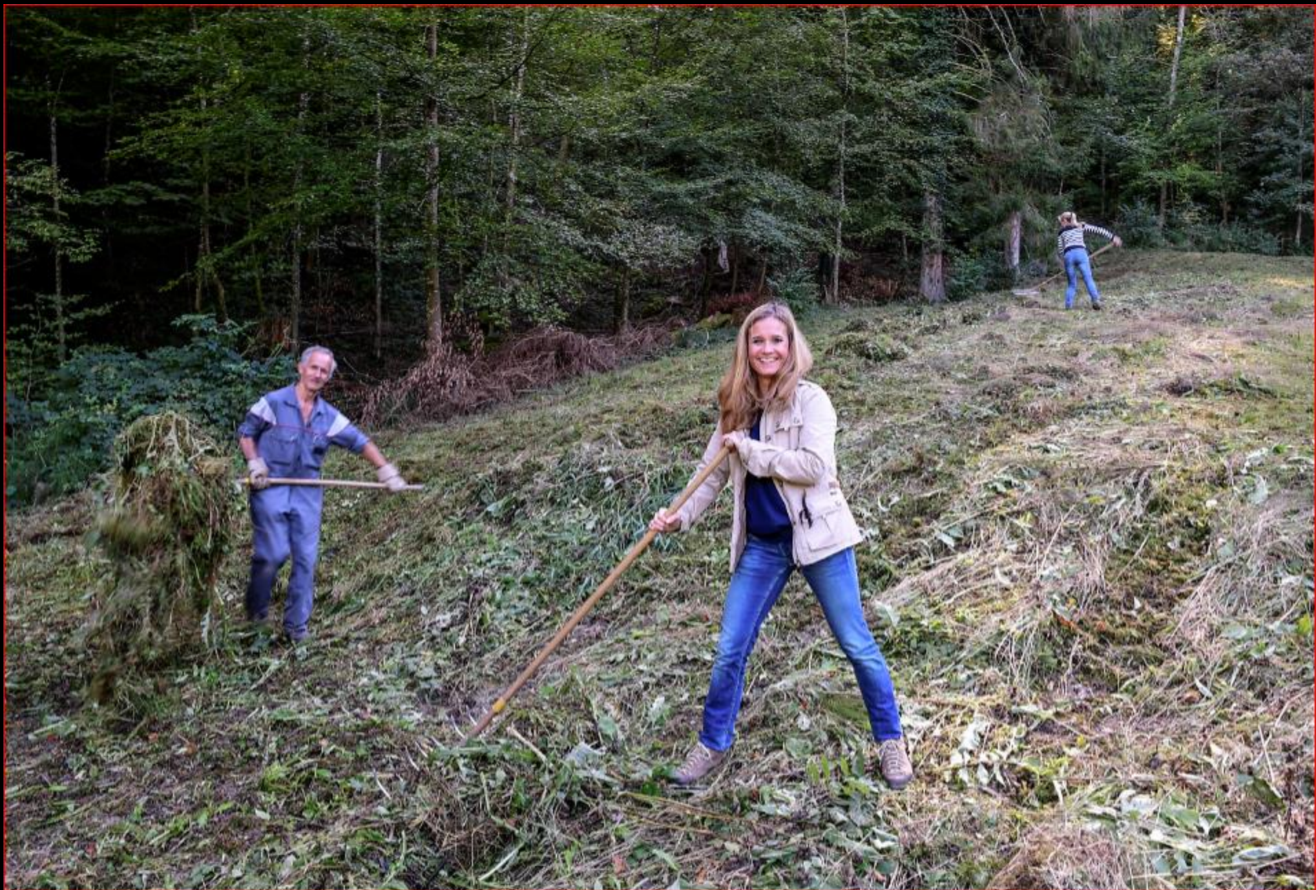
UBS-Team-Einsatz 4. Oktober