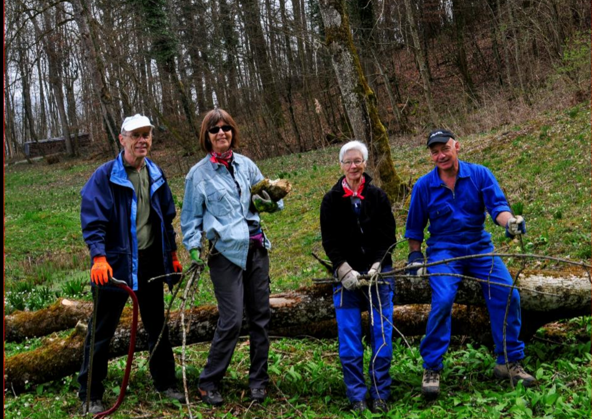
Rorbas Loch 2. April