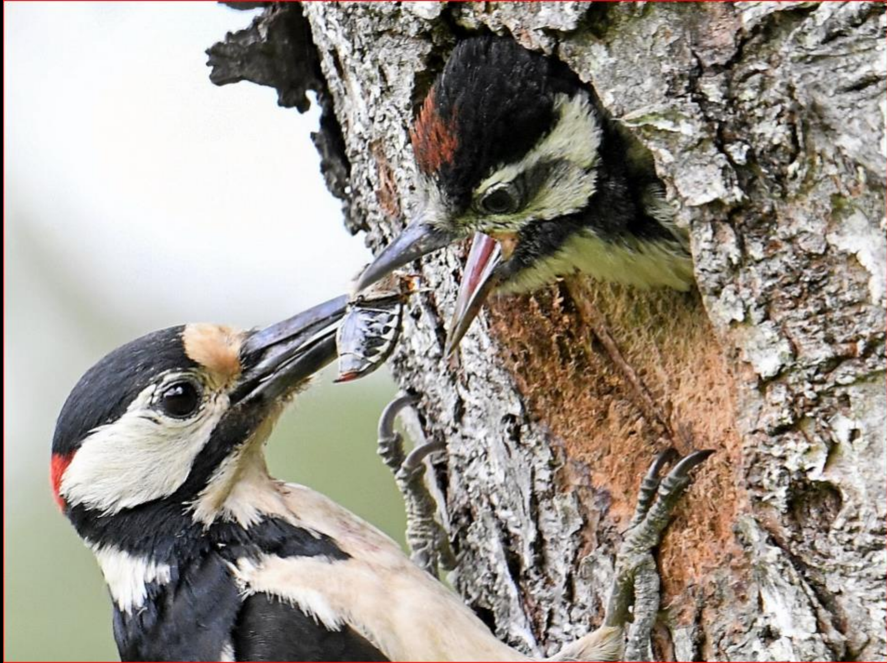
Forenbüekli 5. Juni