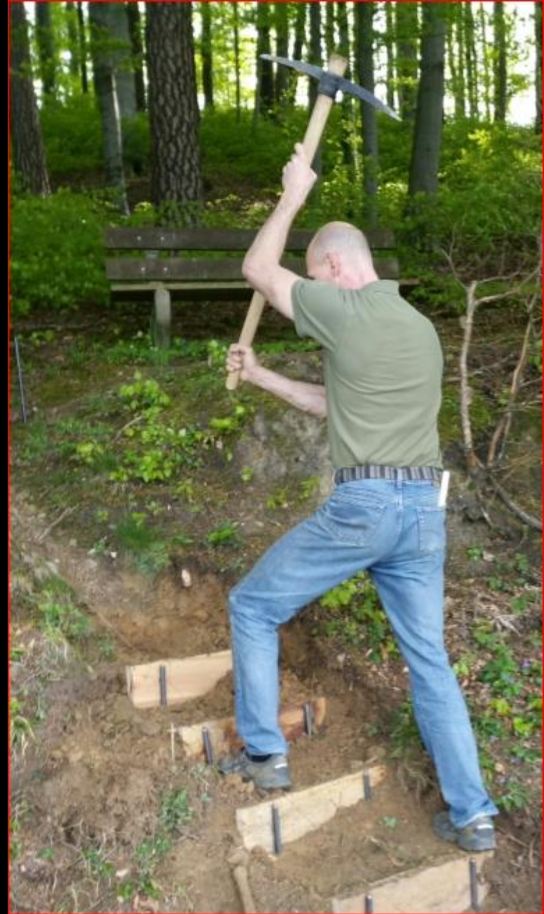
Oberteufen 23. April