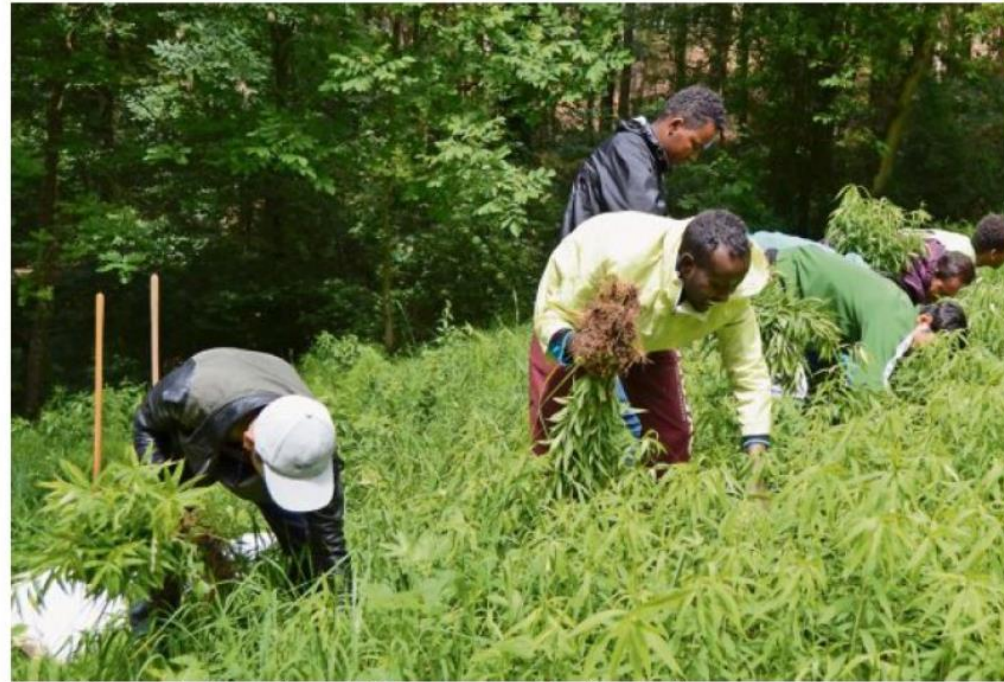
Einsatz für die Natur. Asylsuchende aus Oberembrach befreien eine Wiese am Irchel-Nordhang von Goldruten.

Die Flüchtlinge aus Afghanistan, Somalia, dem Irak und Tibet wohnen aktuell im Durchgangszentrum Sonnenbühl in Oberembrach. Obwohl sie Ramadan feiern und somit von Sonnenauf- bis Sonnenuntergang auf Getränke und Essen verzichten, waren alle mit grossem Eifer bei der Arbeit. Die Erwartung der Einsatzleitung wurde deutlich übertroffen und die Flüchtlinge haben signalisiert, dass sie gerne an weiteren (freiwilligen) Arbeitseinsätzen teilnehmen werden.