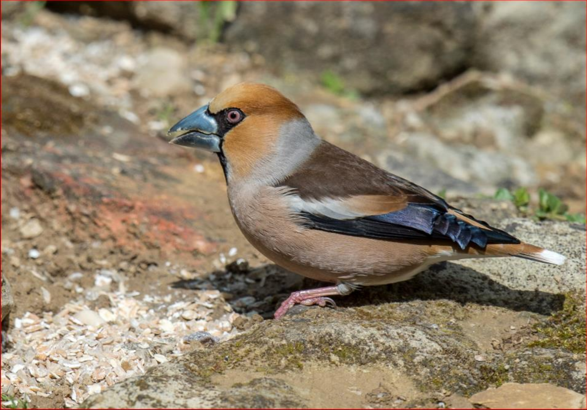
Kernbeisser 14. April