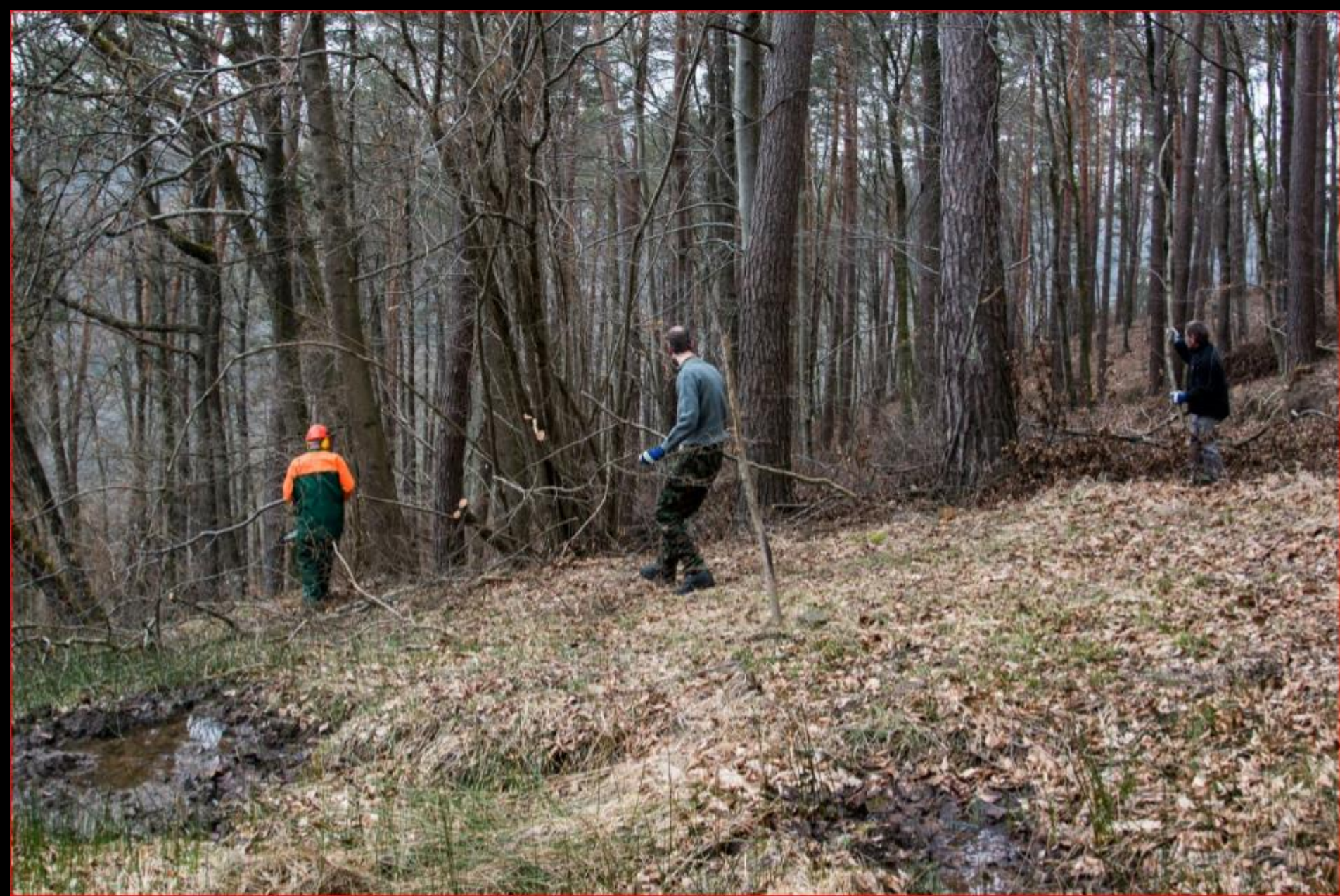
Stockrüti 12. März