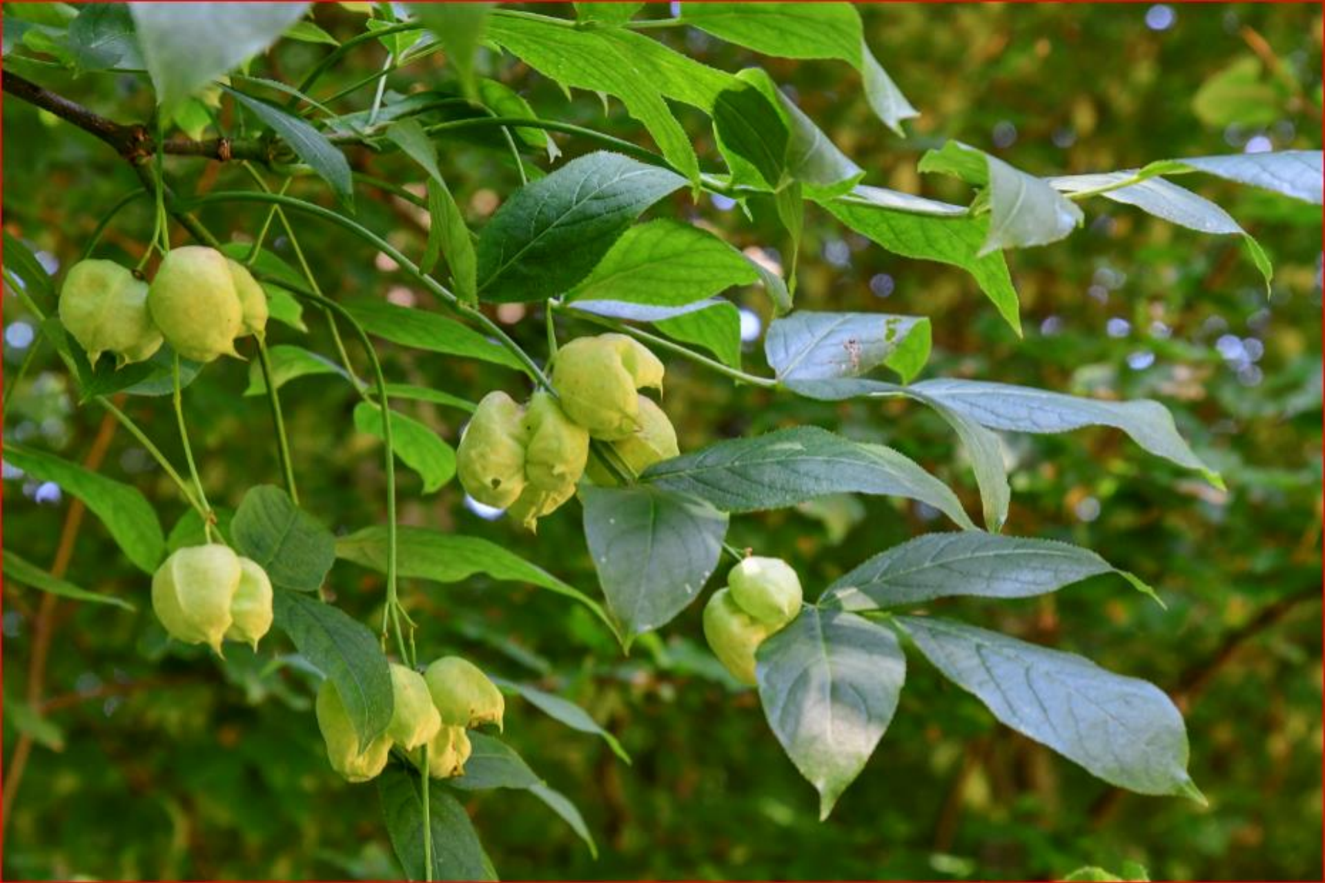
Pimpernuss Siblenrain 10. September