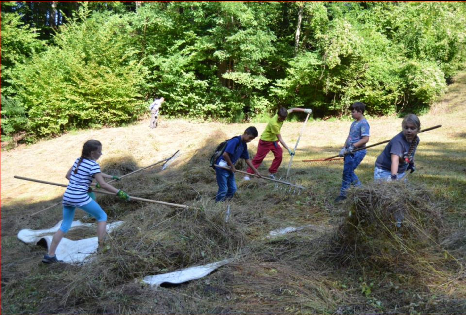
Chli Rüteli mit Pfadi 24. September