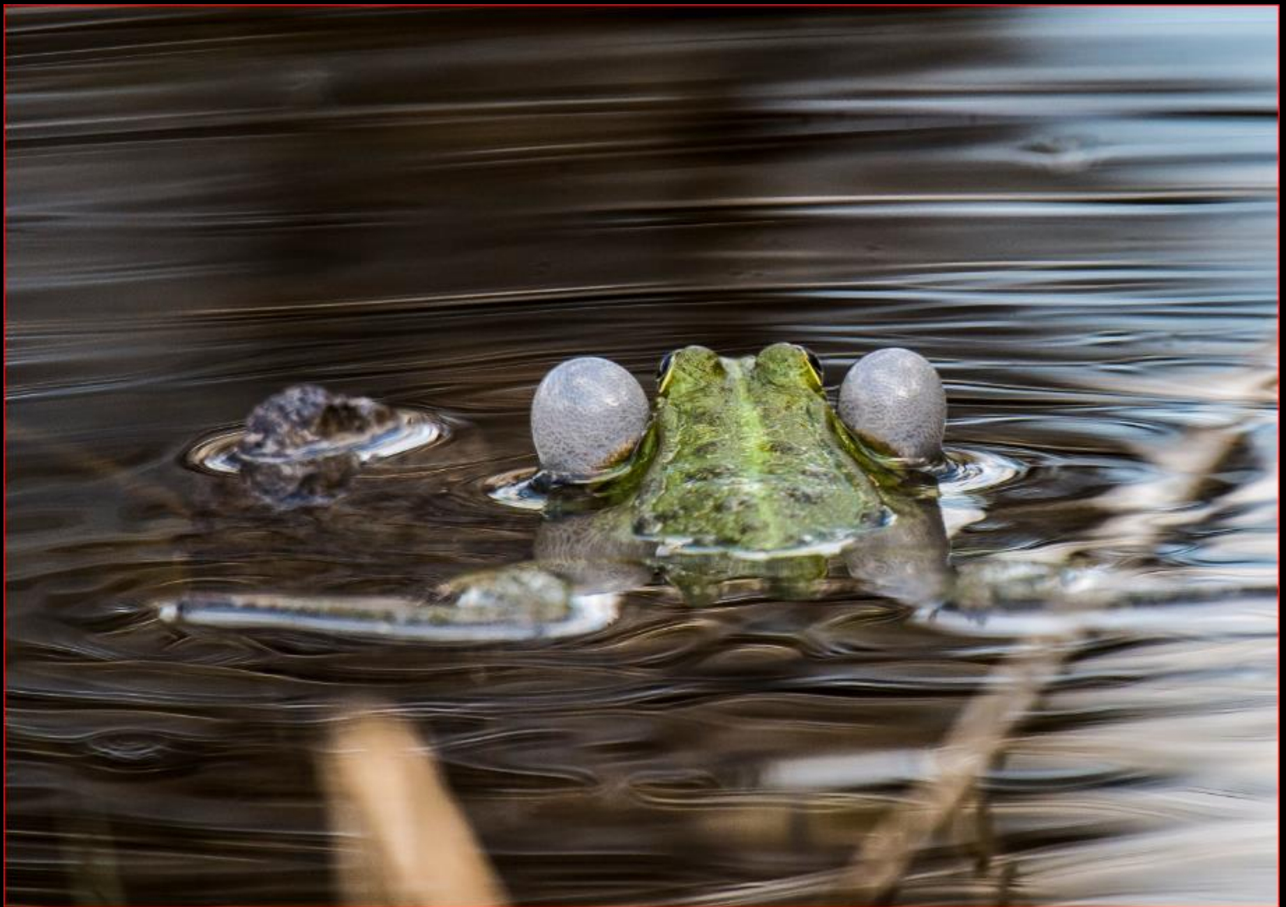
Wasserfrosch 6. April