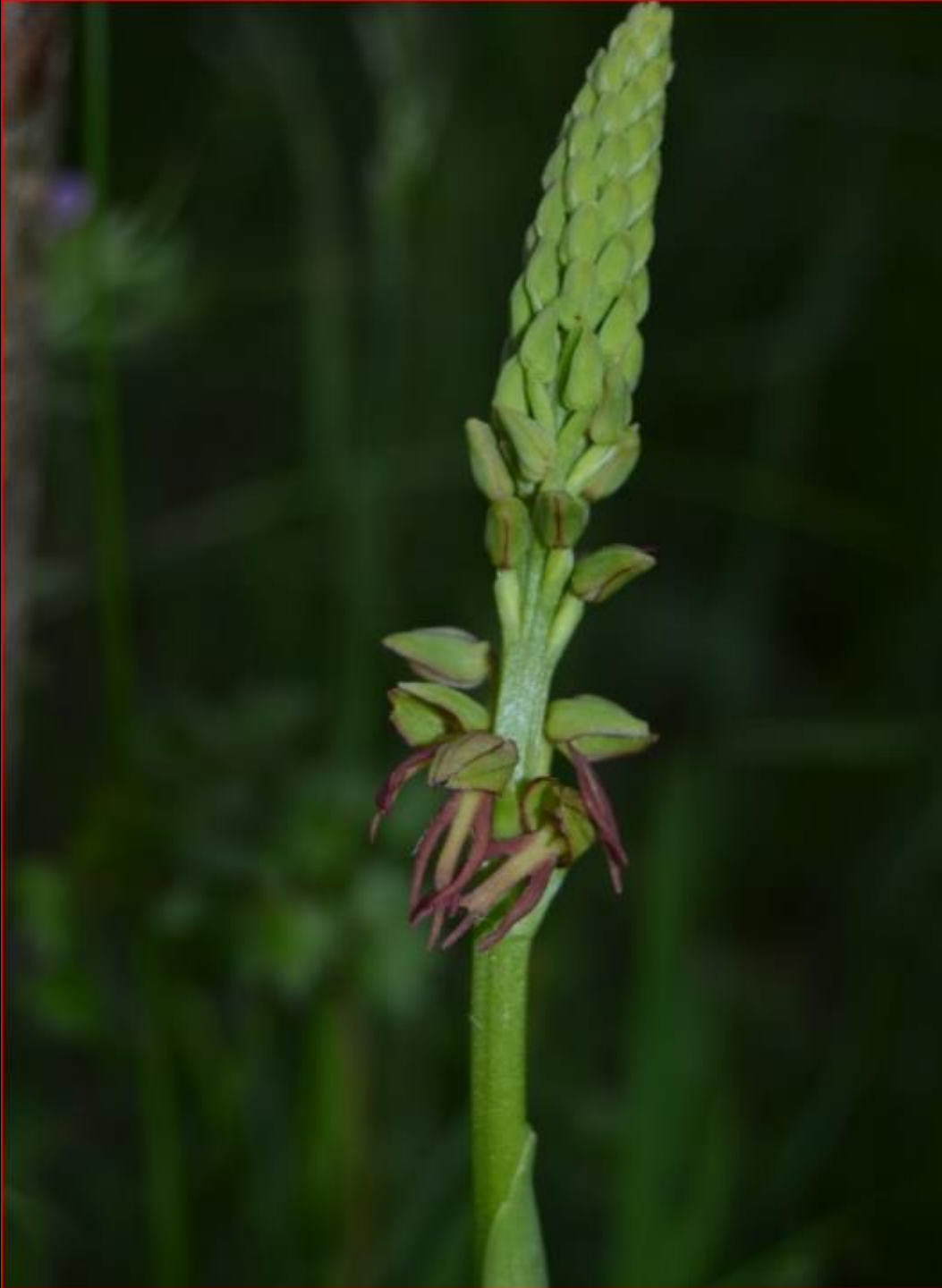
Ohnsporn 3. Mai