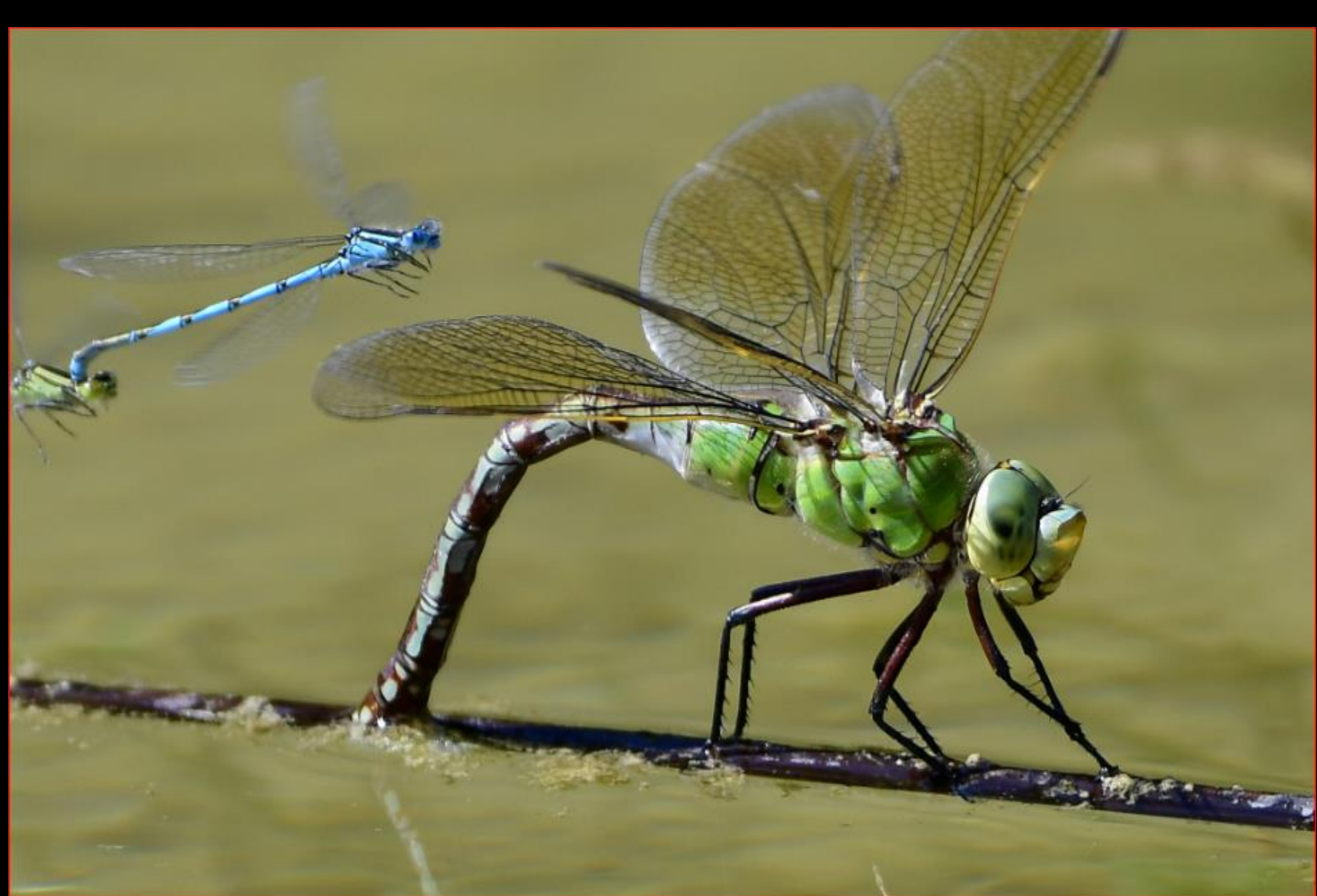
Libelle 17. Juli