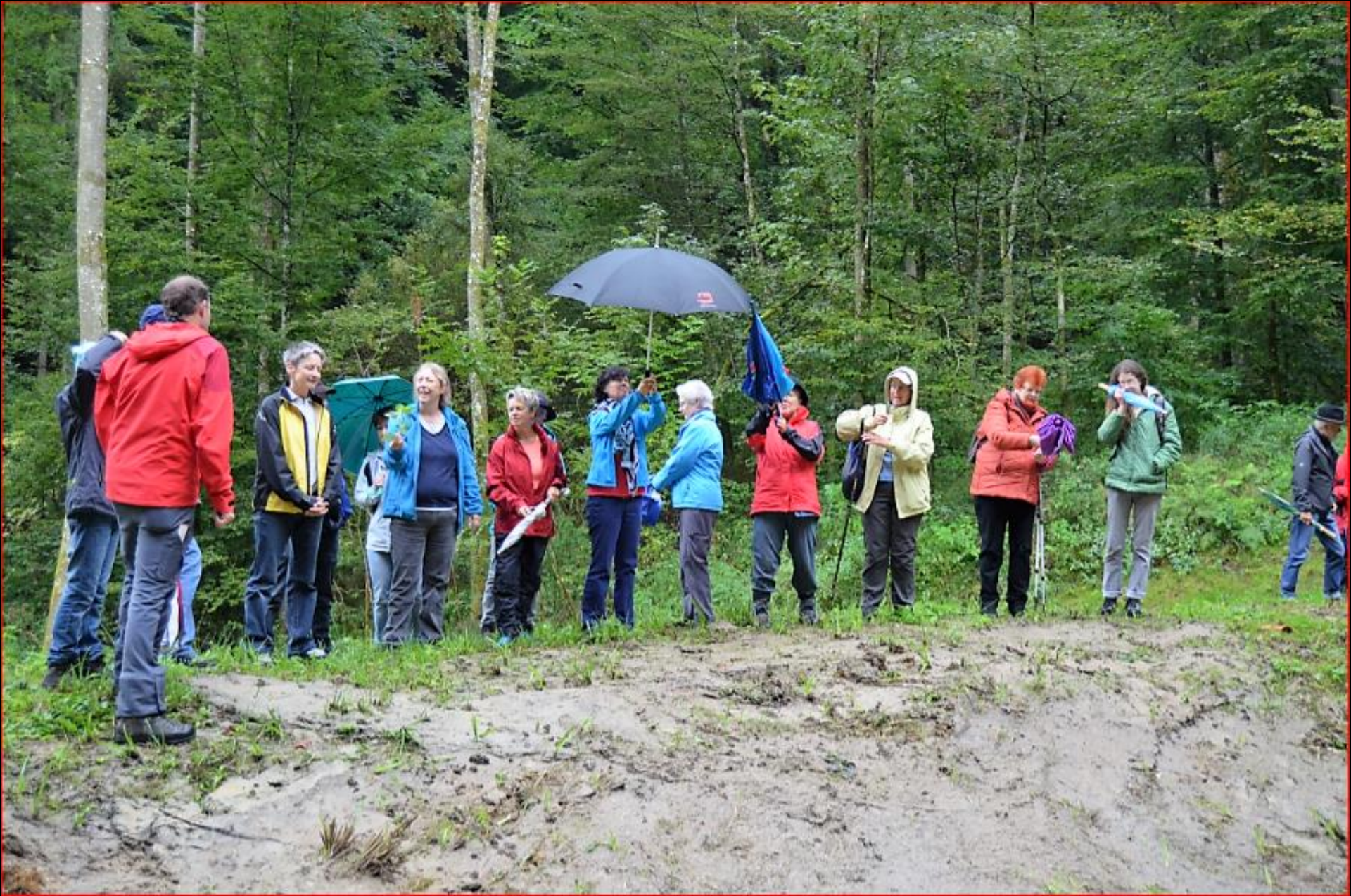
Exkursion Kaiserbuck 18. September