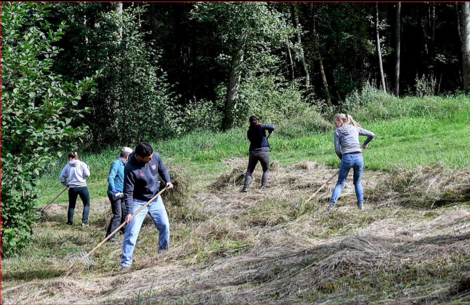
UBS-Team-Einsatz 4. Oktober