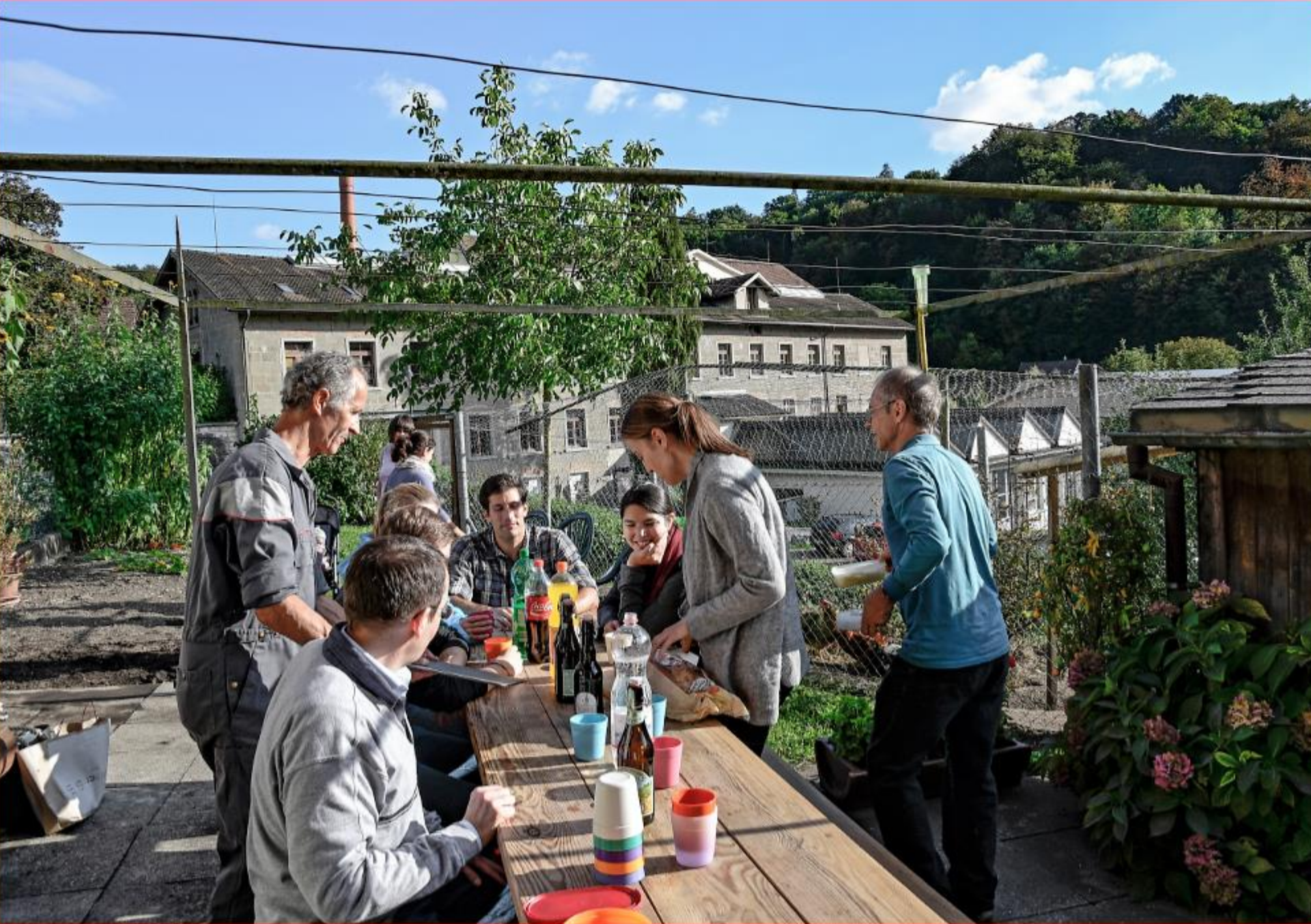
UBS-Team-Einsatz 4. Oktober