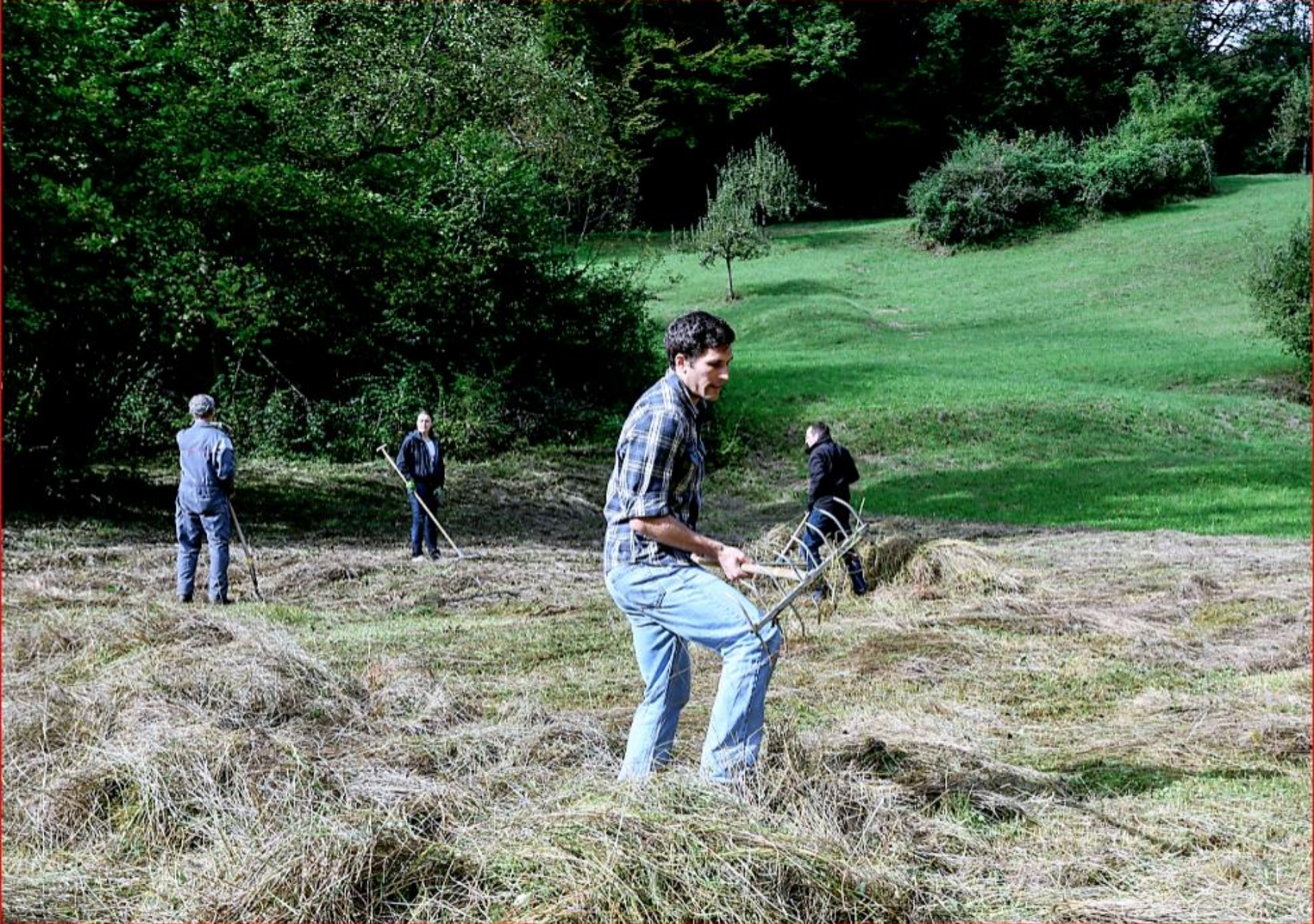
UBS-Team-Einsatz 4. Oktober