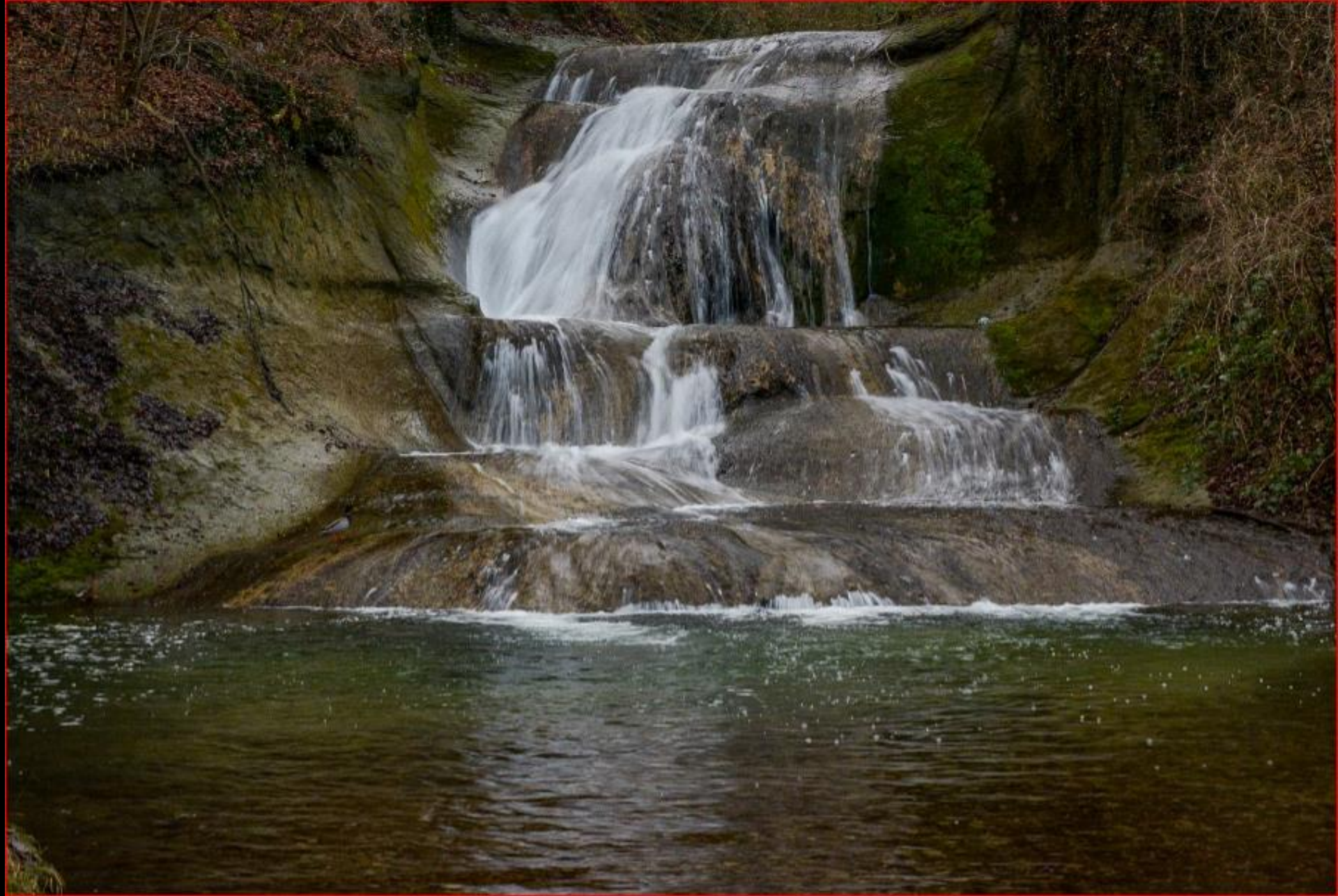
Wildbach bei Lochmühle 31. Januar