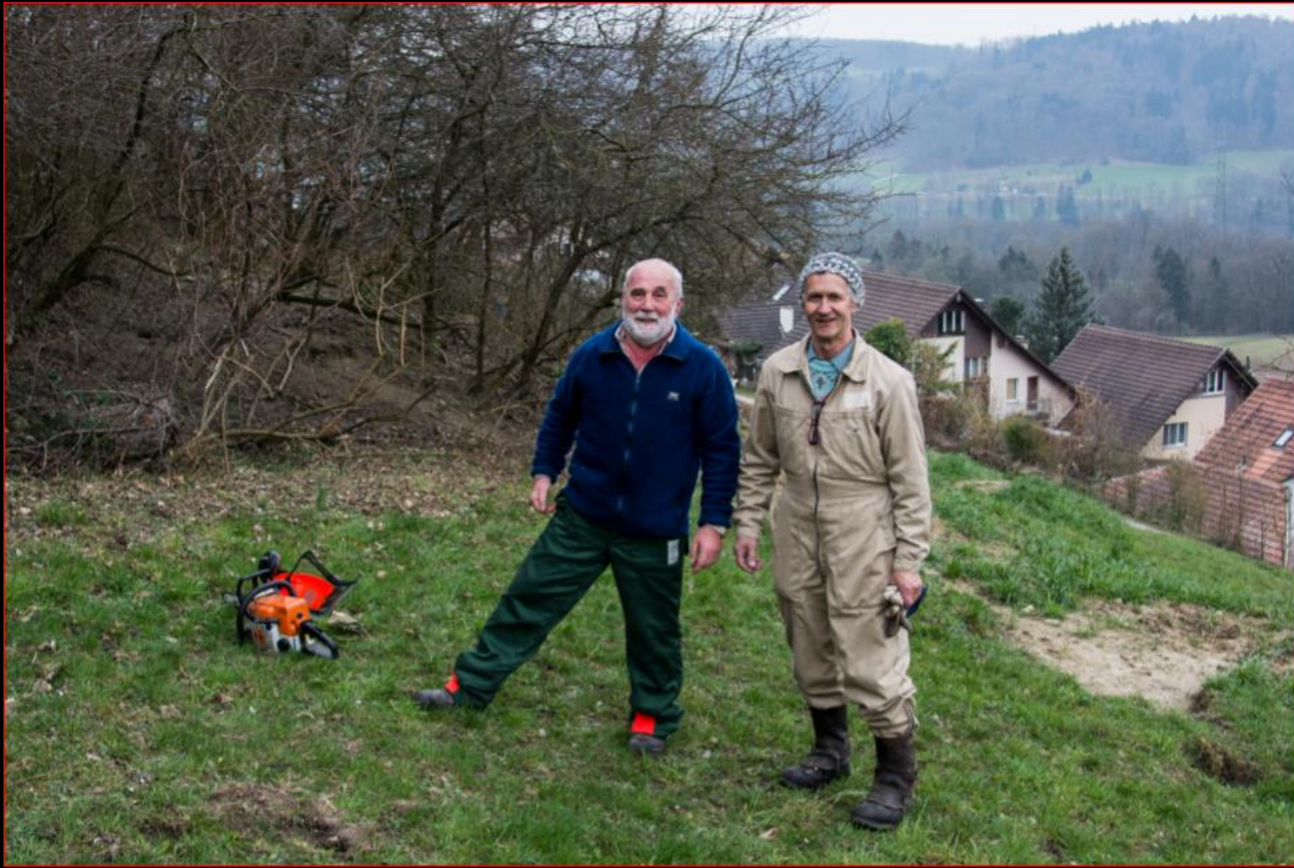
Oberer Buck Teufen 12. März