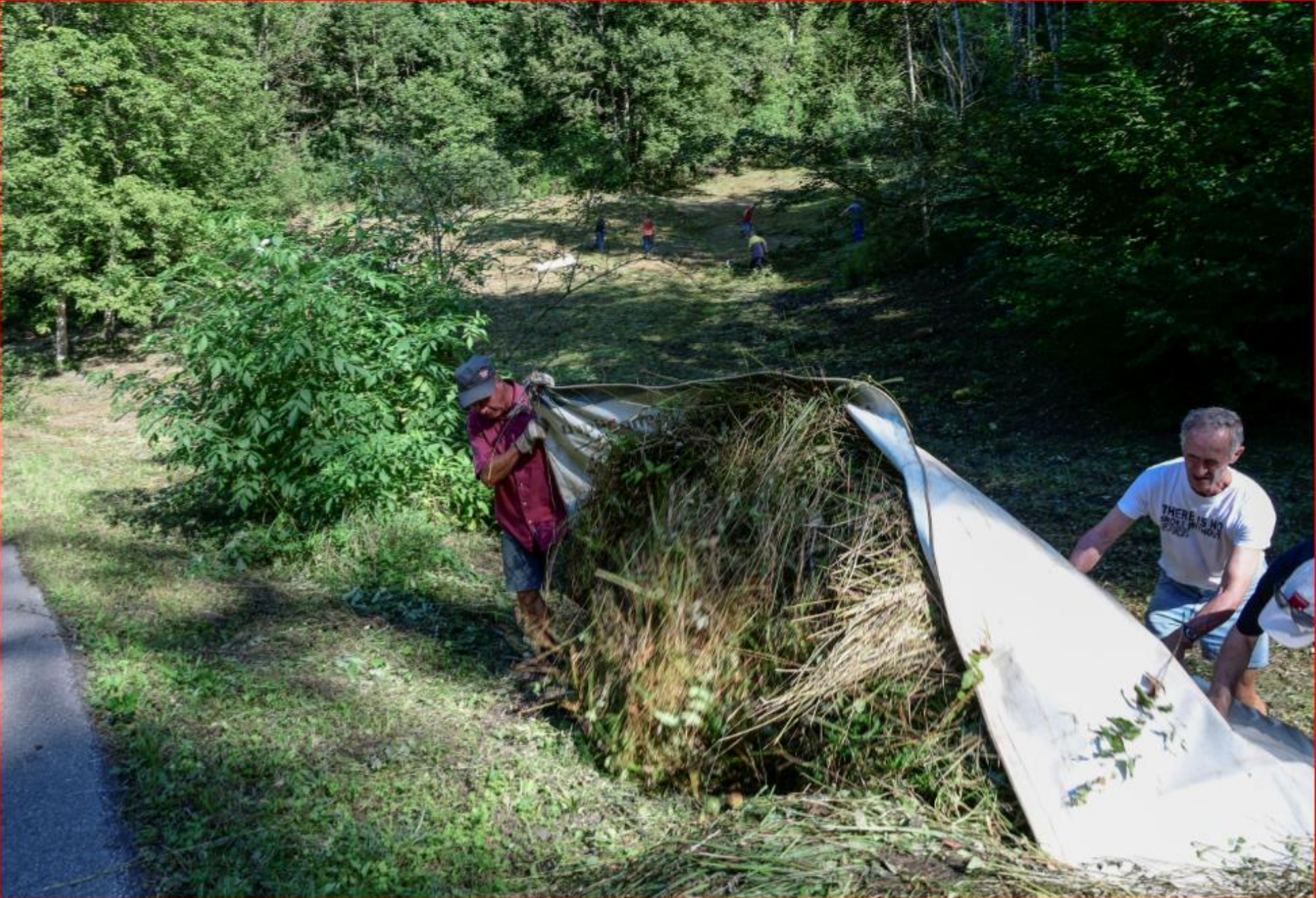
Usser Tobel / Buechen 10. September