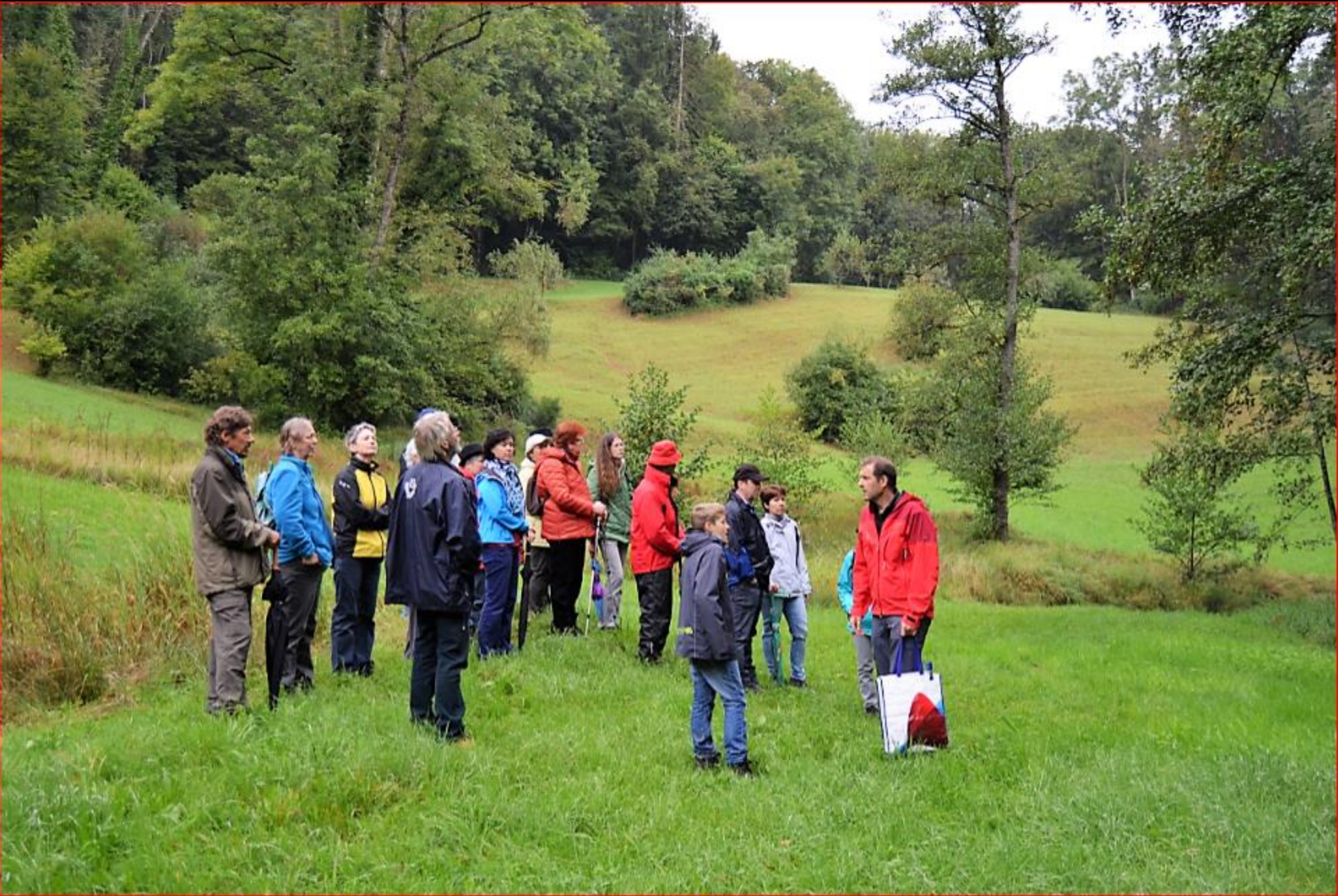
Exkursion Kaiserbuck / Auenriet 18. September