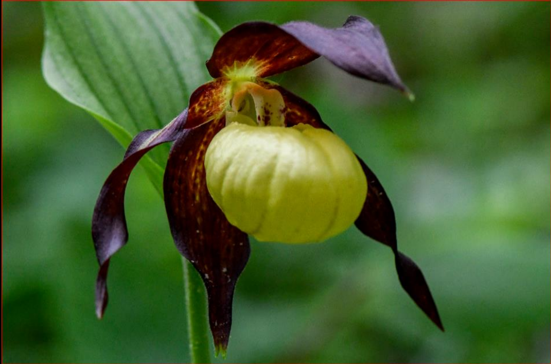
Frauenschuh Guggisbuck 24. Mai