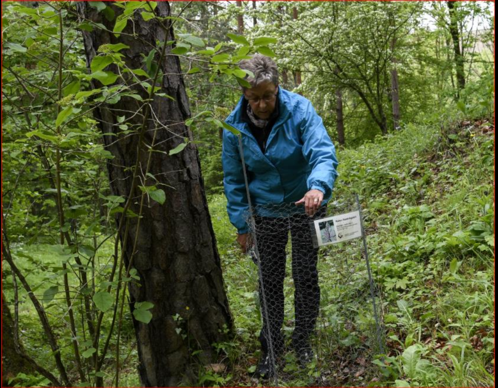
Guggisbuck 19. Mai