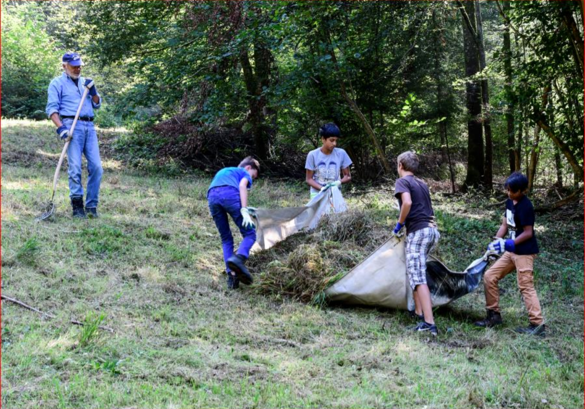
Stockrüti mit Pfadi 24. September