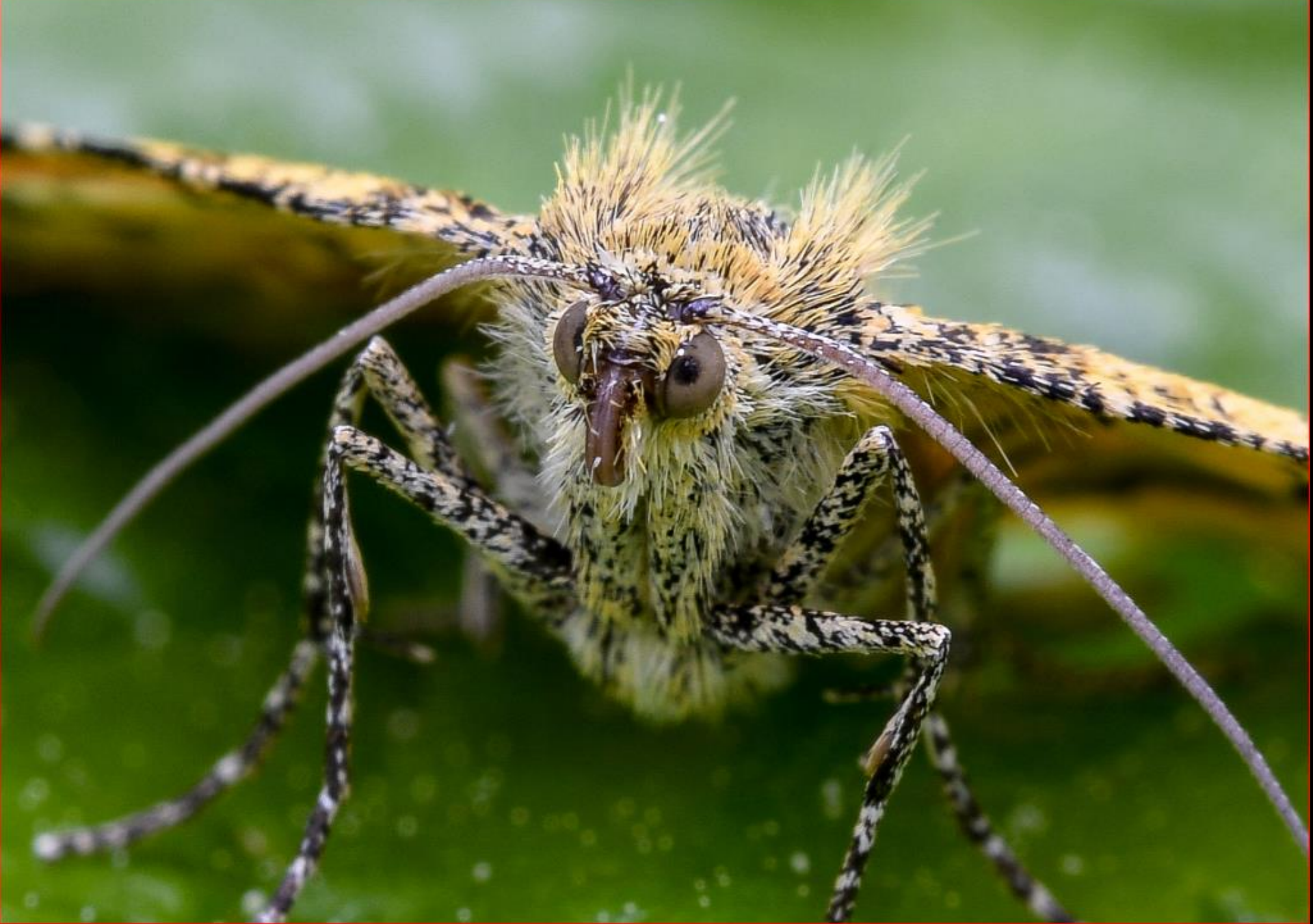
Falter 16. Mai