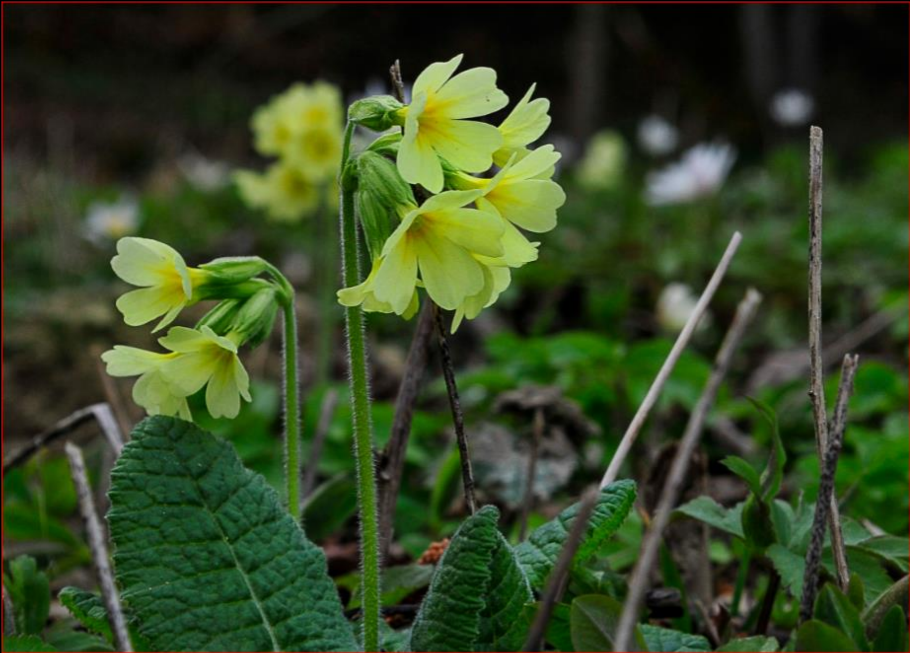
Wald-Schlüsselblume 2. April