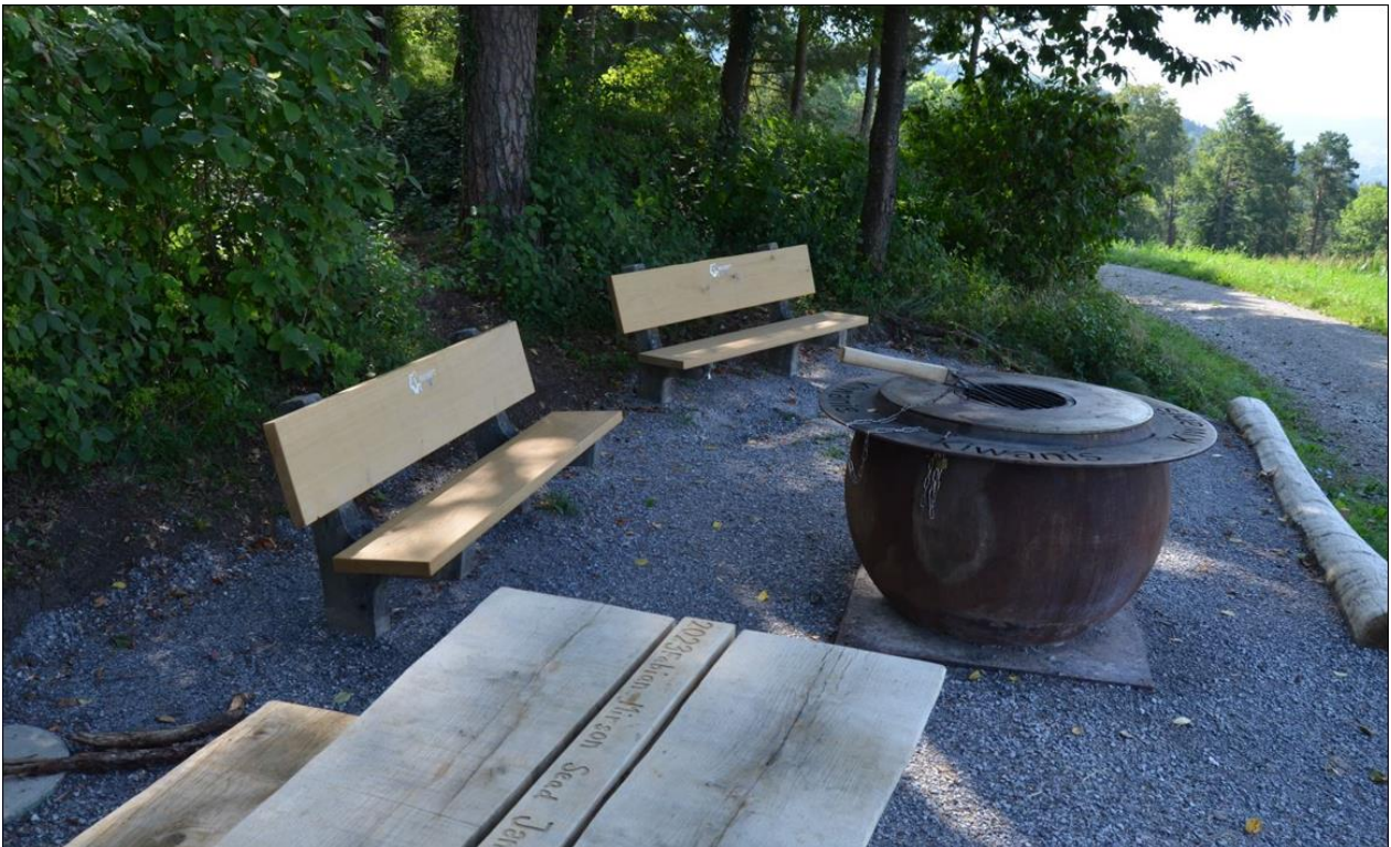
Aktuell setzen wir auf Eichenbretter – z. B. Grillstelle Tüfmatten