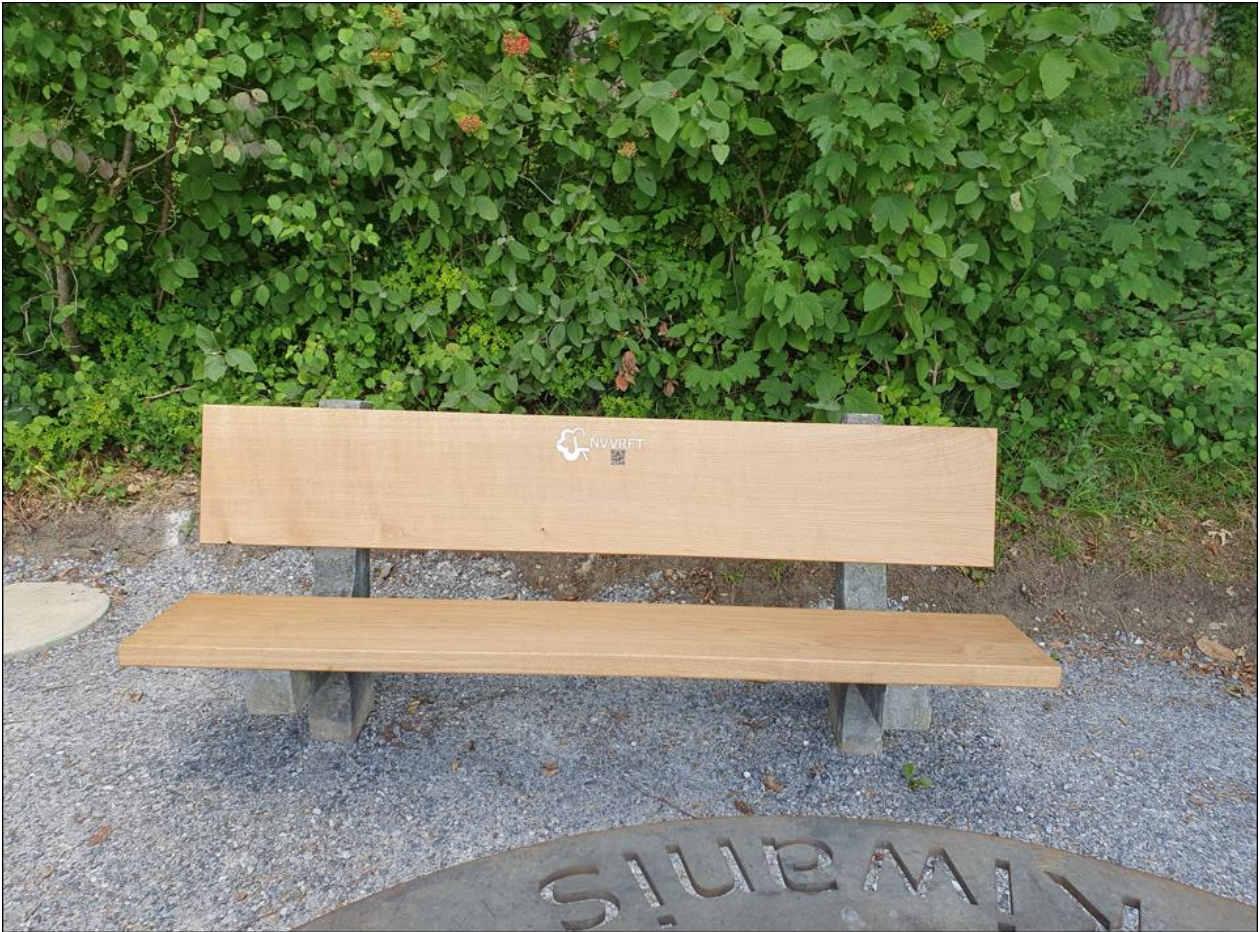
Grillstelle Tüfmatten, Oberteufen