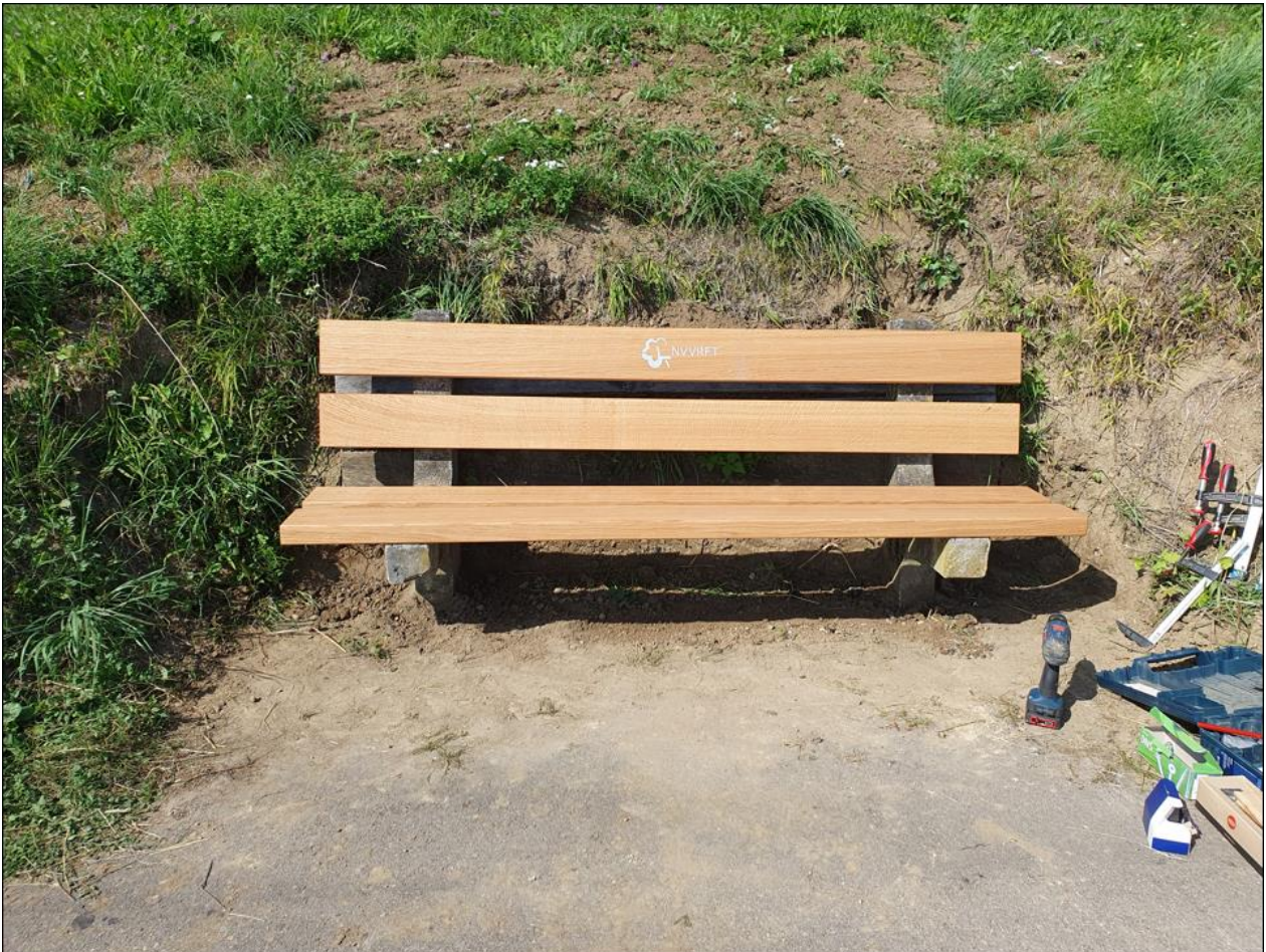
Renovierte Ruhebänk am Burgweg oberhalb von Freienstein