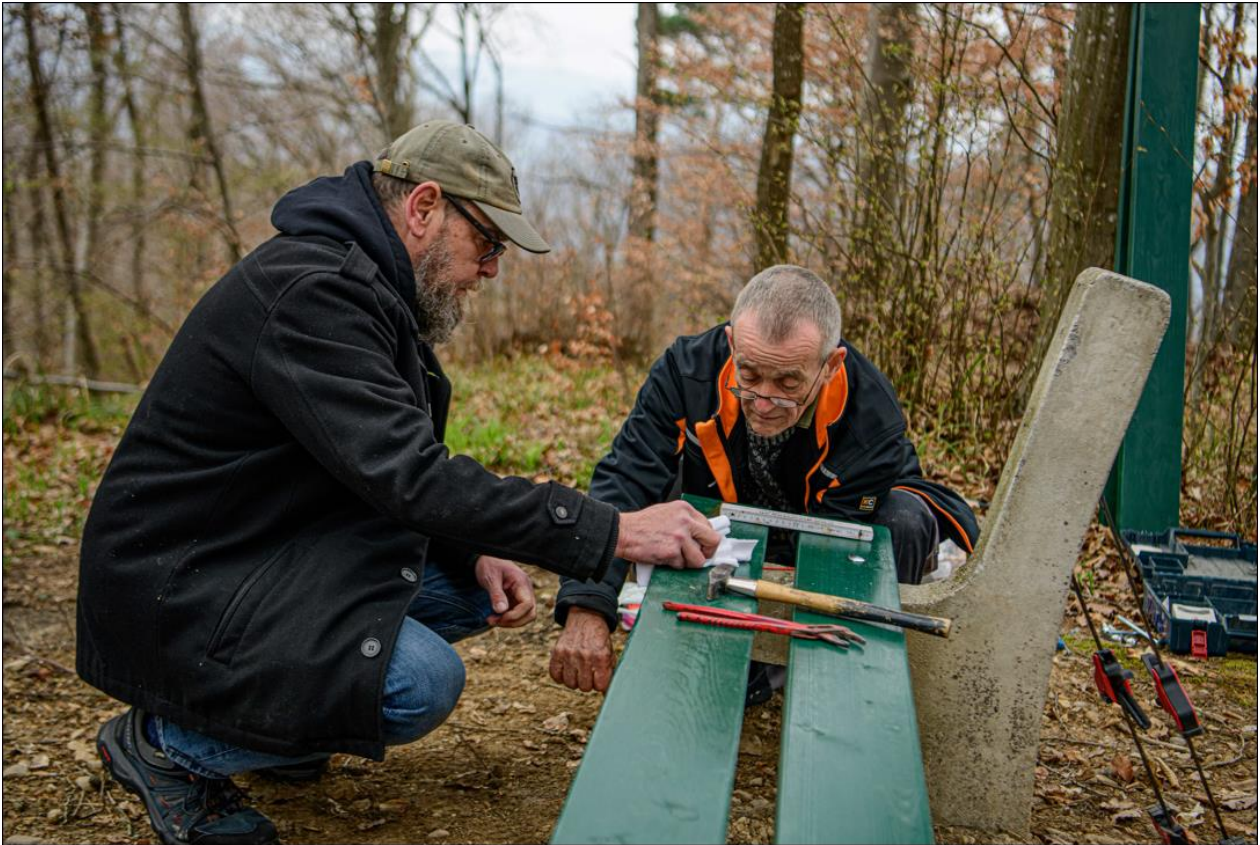
Neue Bretter werden montiert