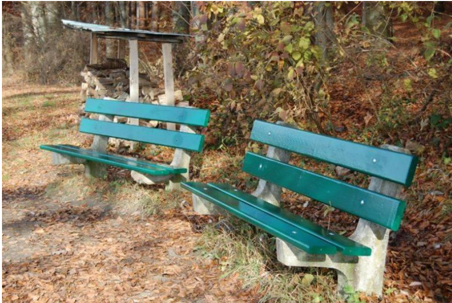
Grillplatz Oberteufen - Tüfmatten