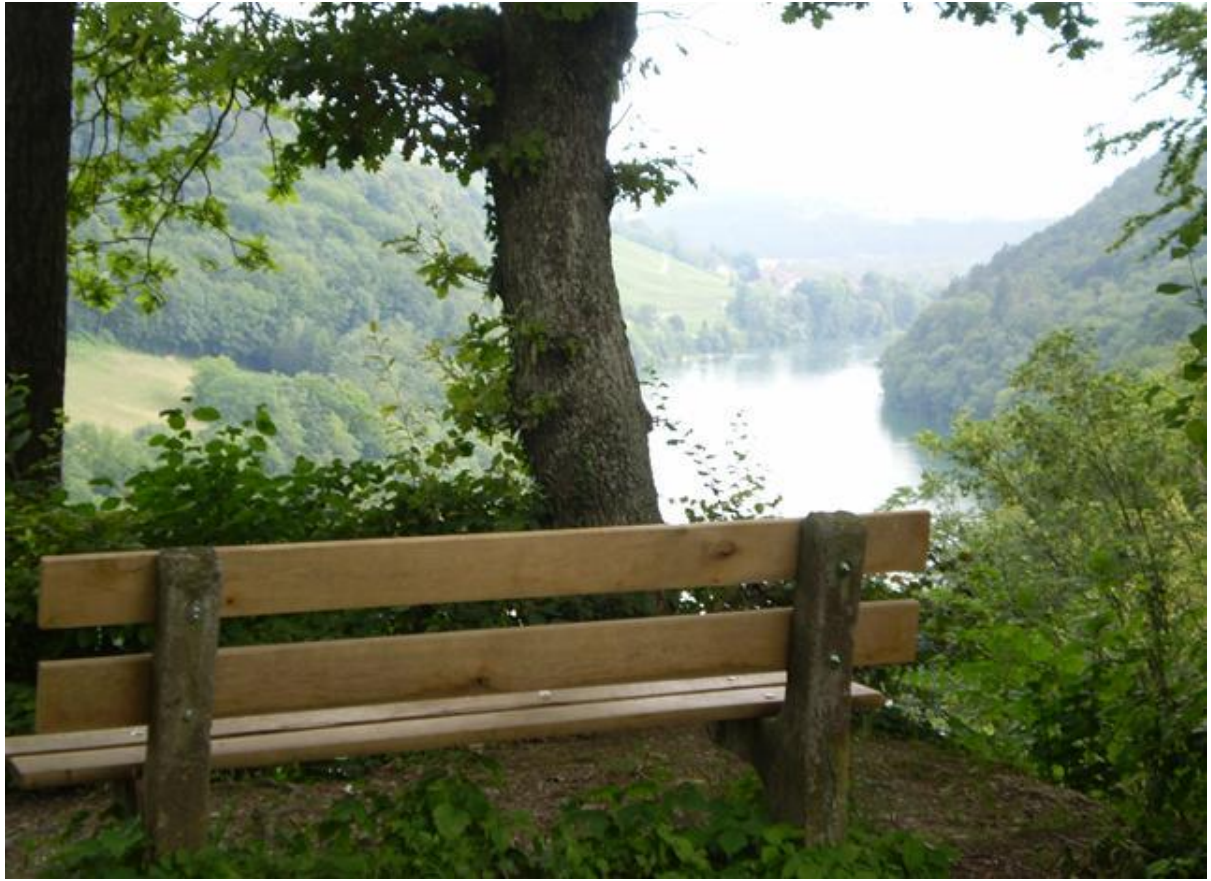
Rhyblick - beim Parkplatz Rüteneu