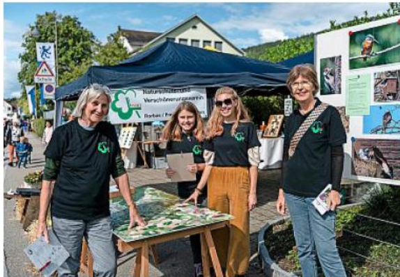
Sie warben an ihrem Stand für Naturschutz und Biodiversität.

mit & Kuebel» Pizzeria über die Biodiversität und Präsidentin Schutz- und eins über den Bedeutung von ein- und Flora. für Abwechslung Männer- und Frauen zusam- men und Pizza an den aus Rorbach d seit letztem Turnier. Die Firma GUS, Firma- und Stras- sentierte ihre ne orangefar- bend dazu 1 Swimming- n Liegestuhl lepool in Fe-